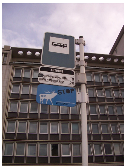
Illustration 2 : Signalétique urbaine de l'événement à Luxembourg

ment de la signalétique sur les sites en Lorraine. À l'échelle de la Grande Région, les conditions d'exposition des publics aux supports communicationnels de l'événement ont été très contrastées : omniprésente sur le périmètre de la ville de Luxembourg et très présente et dans l'ensemble du Grand-Duché, – au risque parfois d'un excès critiqué par les habitants (effet de matraquage), la signalétique de « Luxembourg 2007 » est en Rhénanie-Palatinat concentré principalement sur la ville de Trèves (très investie, et lieu central des manifestations de cette région 7 . À l'inverse, elle est quasiment absente en Wallonie, à l'exception de quelques opérations, telles que par exemple « Best of Nature » 8 , mais qui mettent en avant plutôt leur logo spécifique que le cerf bleu. En Sarre, la présence des emblématiques cerfs bleus en métal, reste encore notable trois ans après l'événement, par exemple aux alentours de la Volklinger Hütte 9 , signe de l'imprégnation de l'événement.