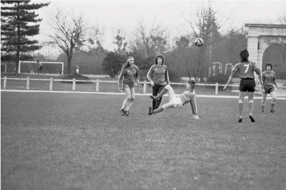
Fig. 8. Moment suspendu...

Photo-reportage du premier stage national officiel de la Fédération Française de Football pour l'équipe de France féminine à l'institut national du sport (les 4 et 5 avril 1975).