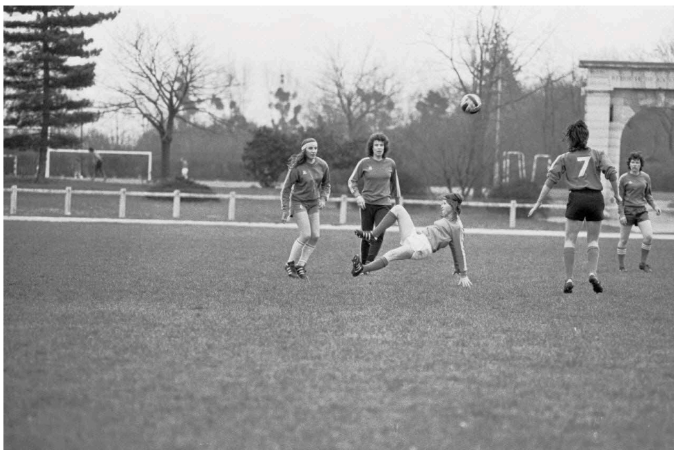
Fig. 8. Moment suspendu...

Photo-reportage du premier stage national officiel de la Fédération Française de Football pour l'équipe de France féminine à l'institut national du sport (les 4 et 5 avril 1975).