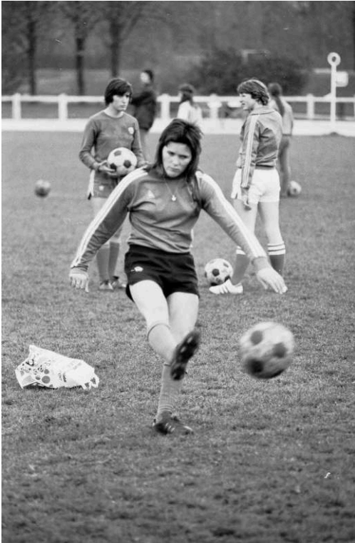
Photo-reportage du premier stage national officiel de la Fédération Française de Football pour l'équipe de France féminine à l'institut national du sport (les 4 et 5 avril 1975).