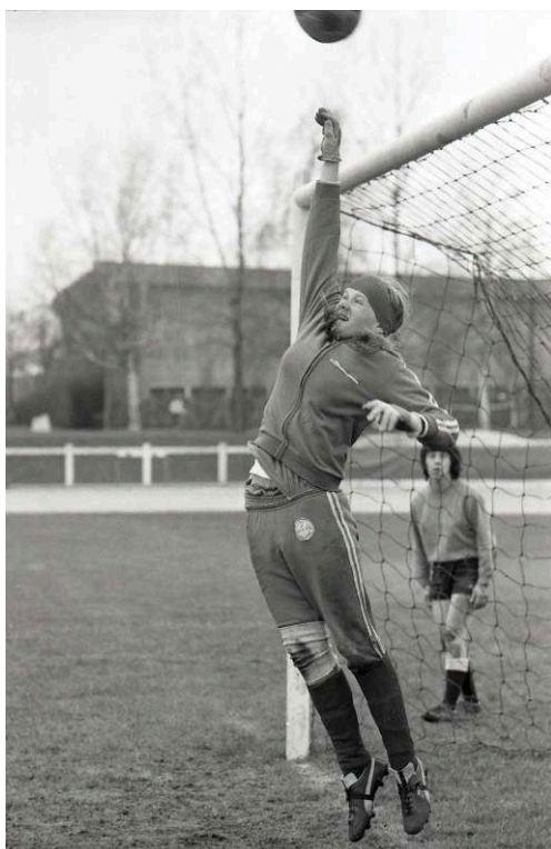
Fig. 9. La gardienne en action

Photo-reportage du premier stage national officiel de la Fédération Française de Football pour l'équipe de France féminine à l'institut national du sport (les 4 et 5 avril 1975).