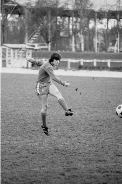
Fig. 10. Tir du gauche

Photo-reportage du premier stage national officiel de la Fédération Française de Football pour l'équipe de France féminine à l'institut national du sport (les 4 et 5 avril 1975).