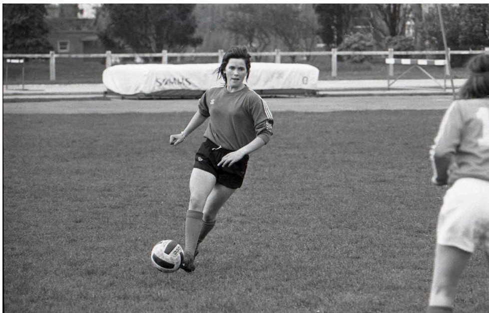
Fig. 6. En plein tir

Photo-reportage du premier stage national officiel de la Fédération Française de Football pour l'équipe de France féminine à l'institut national du sport (les 4 et 5 avril 1975).