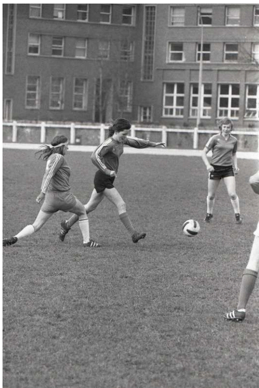
Fig. 4. Séance de dribbles

Photo-reportage du premier stage national officiel de la Fédération Française de Football pour l'équipe de France féminine à l'institut national du sport (les 4 et 5 avril 1975).