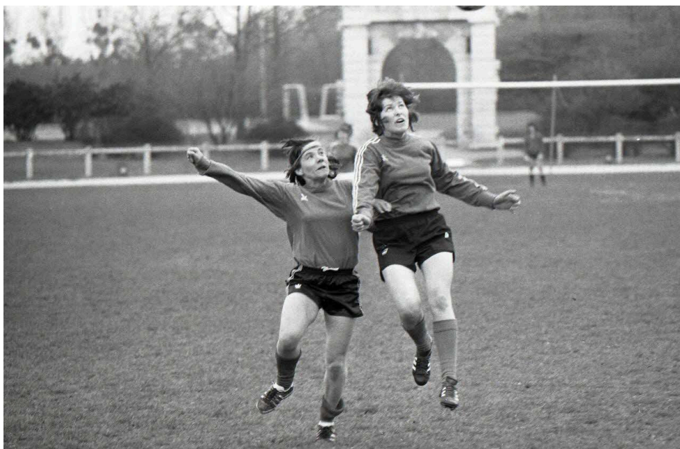
Fig. 7. Duel aérien

Photo-reportage du premier stage national officiel de la Fédération Française de Football pour l'équipe de France féminine à l'institut national du sport (les 4 et 5 avril 1975).