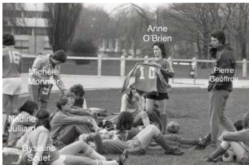
Fig. 3. Les joueuses identifiées grâce à la veille de chercheuses (voir pour plus de détails l'article « Pour une écologie des représentations des sportives » du présent numéro)

Photo-reportage du premier stage national officiel de la Fédération Française de Football pour l'équipe de France féminine à l'institut national du sport (les 4 et 5 avril 1975) sous la direction de Pierre Geoffroy pour 24 joueuses (6 de Reims, 4 de Rouen, 3 de Bergerac, 2 de Caluire, et 1 de Metz, Vendenheim, Orléans, Marseille, Plaine, Auxerre, Cavaillon et Limoges, plus l'irlandaise O'Brien de Reims).