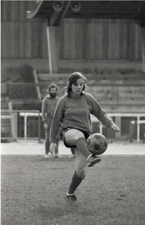
Fig. 12. Exercice sous le regard du coach

Photo-reportage du premier stage national officiel de la Fédération Française de Football pour l'équipe de France féminine à l'institut national du sport (les 4 et 5 avril 1975).