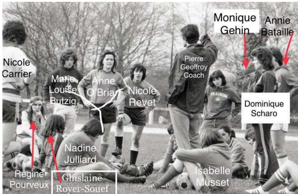
Fig. 2. Les joueuses identifiées grâce à la veille de chercheuses (voir pour plus de détails l'article « Pour une écologie des représentations des sportives » du présent numéro)

Photo-reportage du premier stage national officiel de la Fédération Française de Football pour l'équipe de France féminine à l'institut national du sport (les 4 et 5 avril 1975) sous la direction de Pierre Geoffroy pour 24 joueuses (6 de Reims, 4 de Rouen, 3 de Bergerac, 2 de Caluire, et 1 de Metz, Vendenheim, Orléans, Marseille, Plaine, Auxerre, Cavaillon et Limoges, plus l'irlandaise O'Brien de Reims).