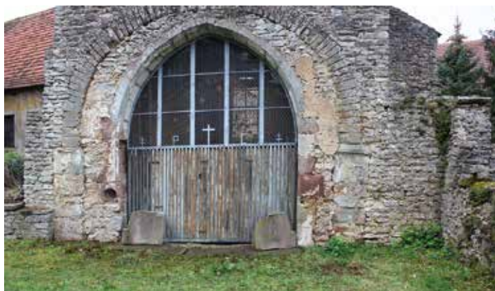
Fig. 2 : De la chapelle, il ne reste plus que le chœur qui était séparé de la nef par le mur percé d'un arc ogival et remployant des blocs sculptés gallo-romains, dont les deux stèles représentant Junon et une autre divinité difficile à identifier (cl. Blies Survey Project).