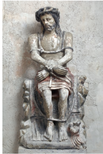
Doc 7 et 8 : églises de Belmont-sur-Vair et de Bulgnéville, statues du Christ de pitié, cliché Didier Vogel – Université de Lorraine.

Un dernier monument est constitué par la croix monumentale de Médonville, qui ornait avant sa destruction récente le pont sur l'Anger 12 . Son croisillon à double face, avec figures latérales sur consoles, toutes ornées de plis tubulaires ou en étrier, se range aux côtés des pièces énumérées.