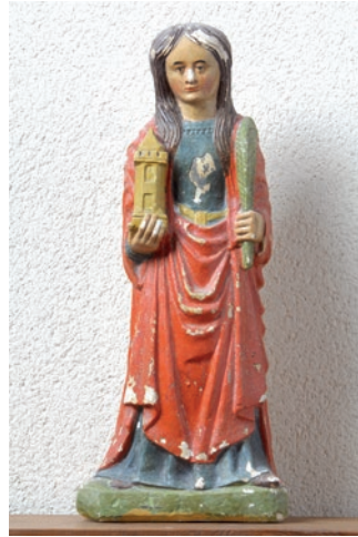
Doc 4 : église de Belmont-sur-Vair, statue de sainte Barbe, cliché Didier Vogel – Université de Lorraine.