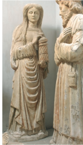
Doc 2 : mise au tombeau de Malaincourt, statue de Marie-Madeleine.

On est d'emblée frappé par le style particulier offert par les personnages, juxtaposés, on l'a dit, figés et massifs 5 . Les visages éplorés sont carrés, avec des yeux rapprochés et des lèvres pincées. Les saintes femmes, soit portent de volumineux voiles en casque animés de plis tuyautés et complétés par une guimpe, soit présentent une chevelure lissée faiblement ondulée, divisée par une raie partant du front, et tombant sur les épaules. Sauf la Vierge Marie, elles tiennent un pot à onguent cylindrique à couvercle, l'une portant aussi un livre fermé. L'animation est fournie par les vêtements aux plis marqués, multipliés et serrés. Sur les côtés où ils sont remontés par les coudes, ils tombent en éventails terminées par des zigzags. Ils retiennent surtout l'attention sur le devant, sous la taille, en raison de la multiplication de plis en U étagés, comme emboîtés. Particulièrement remarquable à cet égard est, à droite, la sainte Marie-Madeleine, où ces plis en étrier atteignent presque la dizaine (doc. 2). Ces plissements font la spécificité de ce groupe sculpté auquel convient la caractérisation de populaire. Ce style si affirmé se découvre-t-il ailleurs ? De quelle influence peut-il procéder ?