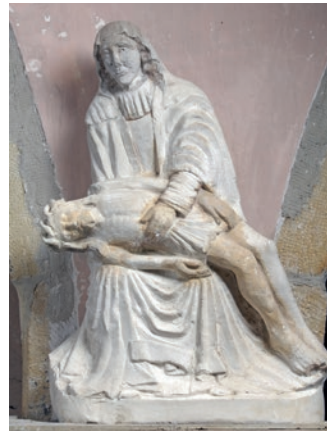
Doc 5 et 6 : églises d'Urville et de Vrécourt, statues de la Vierge de pitié, cliché Didier Vogel – Université de Lorraine.