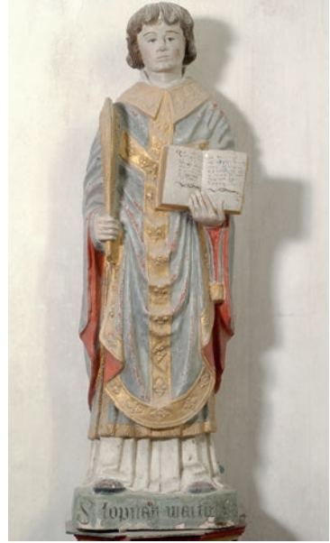
Doc 10 : église de Daillancourt (Haute-Marne, commune de Vignory), statue de saint Louvent.

La cartographie des productions incite à reconnaître l'œuvre d'un atelier itinérant, ce que confirmerait une densité spéciale le long de la très ancienne route Dijon-Langres-Toul. Mais la dispersion constatée ailleurs diminue les certitudes. D'autre part, à côté de la production standard, il existe des œuvres un peu différentes, ainsi autour de Bar-sur-Aube, notamment dans l'église de Bayel 21 . On y détecte plus d'ambition, plus de maîtrise et plus de lien avec les traditions artistiques régionales, en l'occurrence la statuaire bourguignonne. Voilà pourquoi Geneviève Bresc-Bautier conseillait de parler, non d'un atelier, mais d'un « style régional » diffusé, à partir d'un foyer initial (celui du Barsuraubois ?), par des opérateurs s'éparpillant au gré des commandes 22 . Qu'ils se soient parfois plus durablement installés dans certaines zones ne surprendrait pas. Une étude scientifique du matériau utilisé pourrait solutionner cette question.