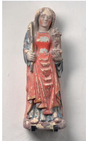
Doc 9 : église de Maisons-lès-Chaource (Aube, commune de Chaource), statue de sainte Barbe, cliché Didier Vogel Université de Lorraine.

Plus nombreuses encore sont les statues qui se comparent à la sainte Barbe de Belmont-sur-Vair. Celle-ci porte, en symétrique, dans la main droite une petite tour carrée et crénelée, surmontée d'une toiture pointue à pans et dans la main gauche la palme du martyr tenue droite. Ce dispositif, associé aux traits génériques du style observé à Malaincourt, se retrouve dans près d'une dizaine de cas en Champagne méridionale, avec la seule variante que ces attributs, la tour et la palme, sont parfois inversés 14 . Au passage, on constate que l'œuvre qui ressemble le plus à la sainte de Belmont, du fait d'une dimension identique (0,50 m environ) et d'une polychromie moderne peu différente, la sainte de Maisons-lès-Chaource (Aube, commune de Chaource), se situe à plus de 100 km du village vosgien (doc. 9) 15 .