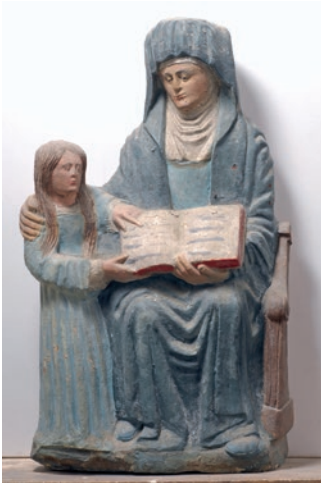
Doc 3 : église de Malaincourt, statue de sainte Anne éducatrice, cliché Didier Vogel – Université de Lorraine.

D'autres cas sont constitués de pièces jumelles. Ainsi s'observent à Urville et à Vrécourt deux Vierges de pitié , la dernière à la partie supérieure endommagée et mal restaurée (doc. 5 et 6) 10 . Leur ressemblance est certaine : l'on y retrouve notamment les mêmes plis en étrier ou en volutes latérales et le voile surdimensionné.