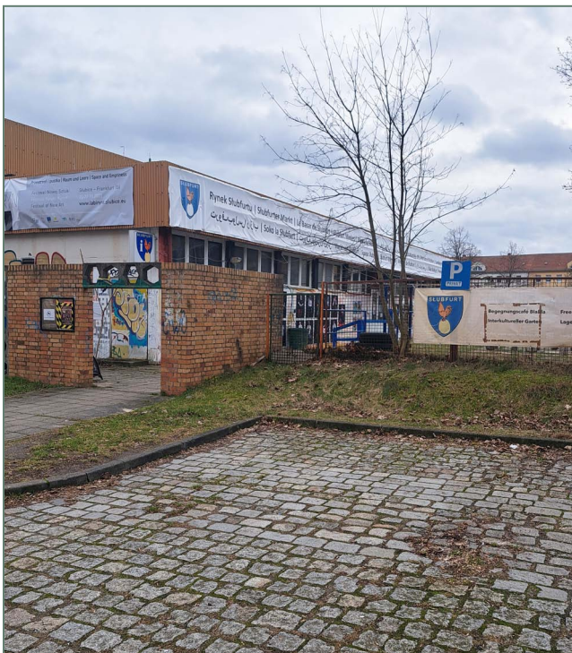
Figure 4 : Espace interculturel Place du Pont et Bazar de Stubfurt à Francfort-sur-l'Oder.

transfrontalière de Bidasoa-Txingudi. La frontière est présente et visible dans ces cas-là, mais peut-elle toujours être ressentie par les acteurs sur place ? Ou bien y a-t-il déjà une communauté culturelle de lieux et d'acteurs qui s'est engagée à faire disparaître la frontière nationale telle que Stubfurt , un projet culturel et artistique visant à offrir une identité commune à l'espace transfrontalier de Francfort et Stubice (Fig. 4) ? Nous analyserons également les impacts qu'a eue la réintroduction des contrôles sur le pont frontalier entre Francfort et Stubice sur l'image de la frontière dans les têtes et pour le travail des acteurs.