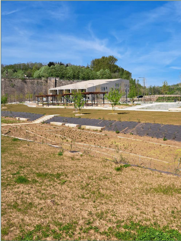
Figure 2 : L'Arche à Villerupt.

titre de la Capitale Européenne de la Culture et a fait le choix d'impliquer les communes du sud du Luxembourg et du Pays Val d'Alzette du côté français dans la mise en place de ce projet. Il a été constaté que les volontés de la coopération ne sont pas les mêmes de part et d'autre de la frontière et que les frontières nationales ont toujours joué un rôle structurant dans la réalisation de projet quand bien même les tiers-lieux ont été identifiés comme des leviers d'une coopération transfrontalière basée sur la culture (Lamour/Schulz, 2021). Le projet va également étudier l'évolution de cette coopération ainsi que l'image de la frontière nationale.