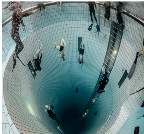
Photographie n°1 : entraînement en fosse

Quels sont les défis pour le pratiquant ? Les repères sensoriels habituellement utilisés deviennent peu utiles (vue, audition). Anne-Lise Chabert (2015) y voit « une mise en situation de handicap volontaire ». Guillaume Néry, champion d'apnée, parle de « déprivation sensorielle ». De nouvelles sensations, souvent désagréables, amènent à stopper rapidement la pratique. Mais des sensations agréables (envelop-