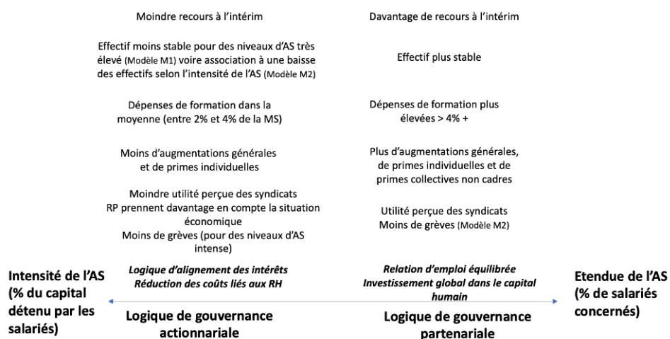
Schéma 1. Intensité et étendue de l'actionnariat salarié : des enjeux distincts en termes de GRH et de gouvernance

73 Cette étude n'est évidemment pas exempte de limites et appelle des approfondissements afin de vérifier les analyses formulées à l'égard de nos résultats quantitatifs, par exemple à propos des liens entre AS et capital humain ou encore en termes de relations professionnelles et de dialogue social. Le sens des relations que nous avons observées à partir de régressions mériterait d'être étudié de façon approfondie. Des études de cas, qualitatives, permettraient une compréhension plus fine des logiques à l'œuvre. Il serait en particulier intéressant de préciser l'analyse des enjeux sur le dialogue social et les relations sociales. La question de la représentation des salariés dans les organes de gouvernance n'a été traitée dans cette recherche que de façon indirecte, en comparant la situation en dessous et au-dessus du seuil de 3 % du capital détenu par les salariés, seuil de la représentation obligatoire des actionnaires salariés dans les conseils d'administration et de surveillance en France. Des travaux ultérieurs pourront s'intéresser spécifiquement aux enjeux liés à la présence d'ARS et d'ARSA dans les instances de gouvernance en termes de gestion de l'emploi, de GRH ou encore de dialogue social. Des comparaisons internationales permettraient d'apporter un éclairage relatif particulièrement intéressant et de vérifier si l'on retrouve ces différences de logiques entre AS intense et AS étendu dans d'autres cadres réglementaires.