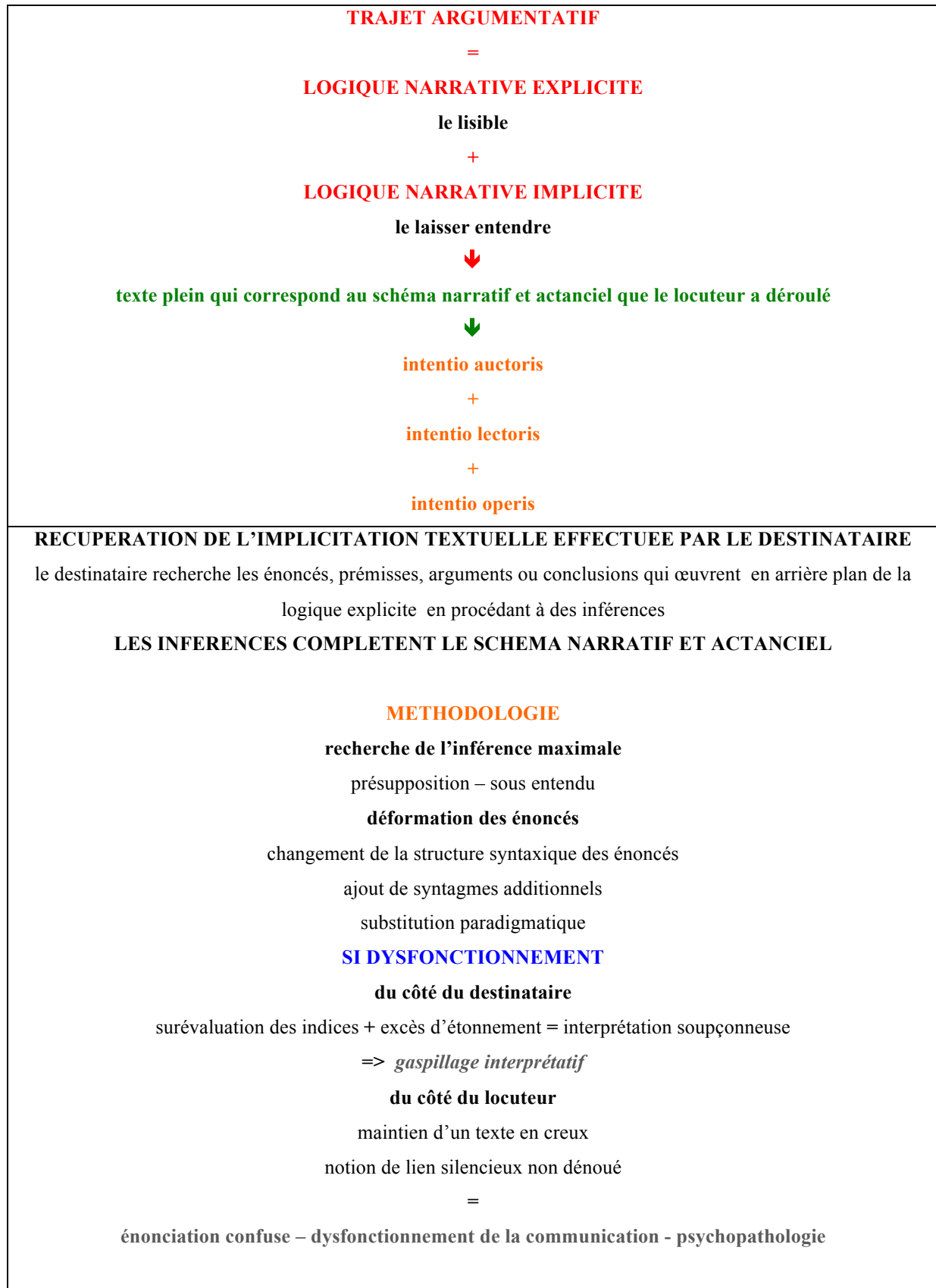
TABLEAU 7 : LE TRAJET ARGUMENTATIF