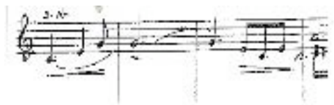
mesures 9 à 11

La fin de cette première partie de l'ouverture fait preuve d'une originalité harmonique intéressante dans les mesures 54 à 69 (voir accord de septième en fab, mesure