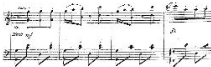
mesures 181 à 184

La troisième partie, en sol majeur, s'inspire du cancan introduit à Vienne, rappelons-le, par Jacques Offenbach. Le staccato des croches souligne l'allure joyeuse et sautillante de ce passage :