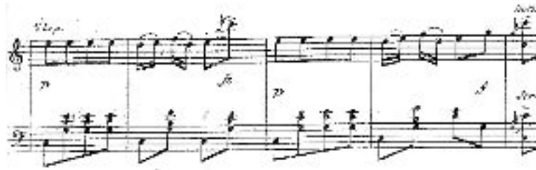
mesures 88 à 91

Cette deuxième partie est très contrastée par rapport à la première. Nous sommes toujours dans la tonalité de do majeur, mais le style est complètement différent. C'est un Allegro scherzando (vif et enjoué) de mesure binaire à 2/4 qui évoque un galop :