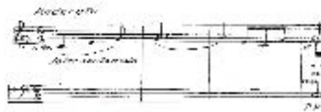
mesures 1 à 3

La première partie, en do majeur, de caractère expressif débute par le premier thème énoncé au cor, dolce sostenuto (doucement soutenu). Ce thème d'une apparente simplicité est énoncé sur les notes de l'accord parfait de do majeur. Il est répété à la mesure 9 où il évolue vers la tonalité de la mineur, mesure 12. Après un pont modulant de sept mesures usant de nombreux chromatismes, ce thème est repris et développé, (mesures 32 à 47) doublé par les trompettes, puis par le tutti orchestral (mesure 48 à 54). Ce premier thème de mesure ternaire (6/8) dans un tempo moderato (modéré) est marqué par certains accents romantiques qui ne sont pas étrangers au style des opéras de Carl Maria von Weber (1786-1826), tels que Der Freischütz (1817), Oberon (1826). Serait-ce un clin d'œil de la part de Franz von Suppè à l'opéra romantique allemand au sein d'une opérette tellement italianisante ?