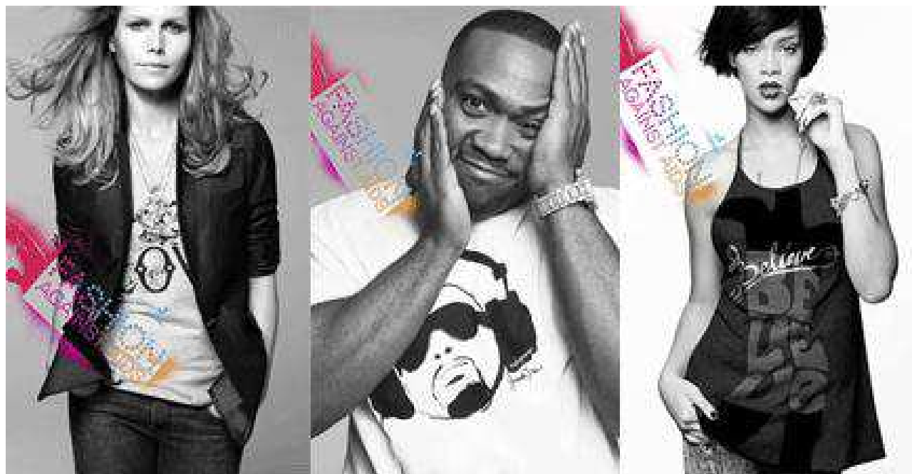
Fig. 33. Visuel de la campagne H&M : Fashion against aids .

Les jeunes savent qu'ils achètent des marques de vêtements promues par des stars car ces dernières s'affichent explicitement comme leurs ambassadrices. Un jeune qui "craque" sur un vêtement H&M porté par Johnny Depp dans un spot publicitaire sait que ce dernier est là pour le capter, l'inciter à l'acheter. Il est conscient que le spot publicitaire n'est qu'une mise en scène qui vise à le capter, le séduire afin qu'il achète l'article en question. La star est ici clairement associée à la marque dans un contexte purement marchand. D'autres types de captation s'avèrent beaucoup moins explicites, à la limite de la manipulation. Il s'agit de campagnes publicitaires où la marque s'associe à une star pour défendre une cause bien déterminée. Cette situation est souvent mise en évidence par H&M qui coopère régulièrement avec « Designers against aids » (DAA) pour concevoir des collections consacrées à la lutte contre ce fléau qu'est le sida. En association avec des célébrités telles que Rihanna (cf. image ci-dessous), Timbaland, Scissor Sisters, Jade Jagger, et bien d'autres artistes, la marque crée la collection « Fashion against aids », composées de vêtements hommes et femmes.