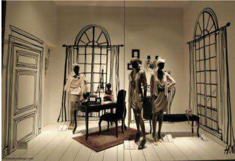
Fig.16. Vitrine H&M Bd Haussmann le 1 octobre 2009 http://www.orserie.fr/mode-tendances/article/les-nouvelles-vitrines-h-m-5819 .

Nouveau concept, nouveau style de vitrines, nouveau visage pour H&M Boulevard Haussmann. Un véritable intérieur en noir et blanc qui donne beaucoup plus de vie à ces nouvelles mises en scènes.