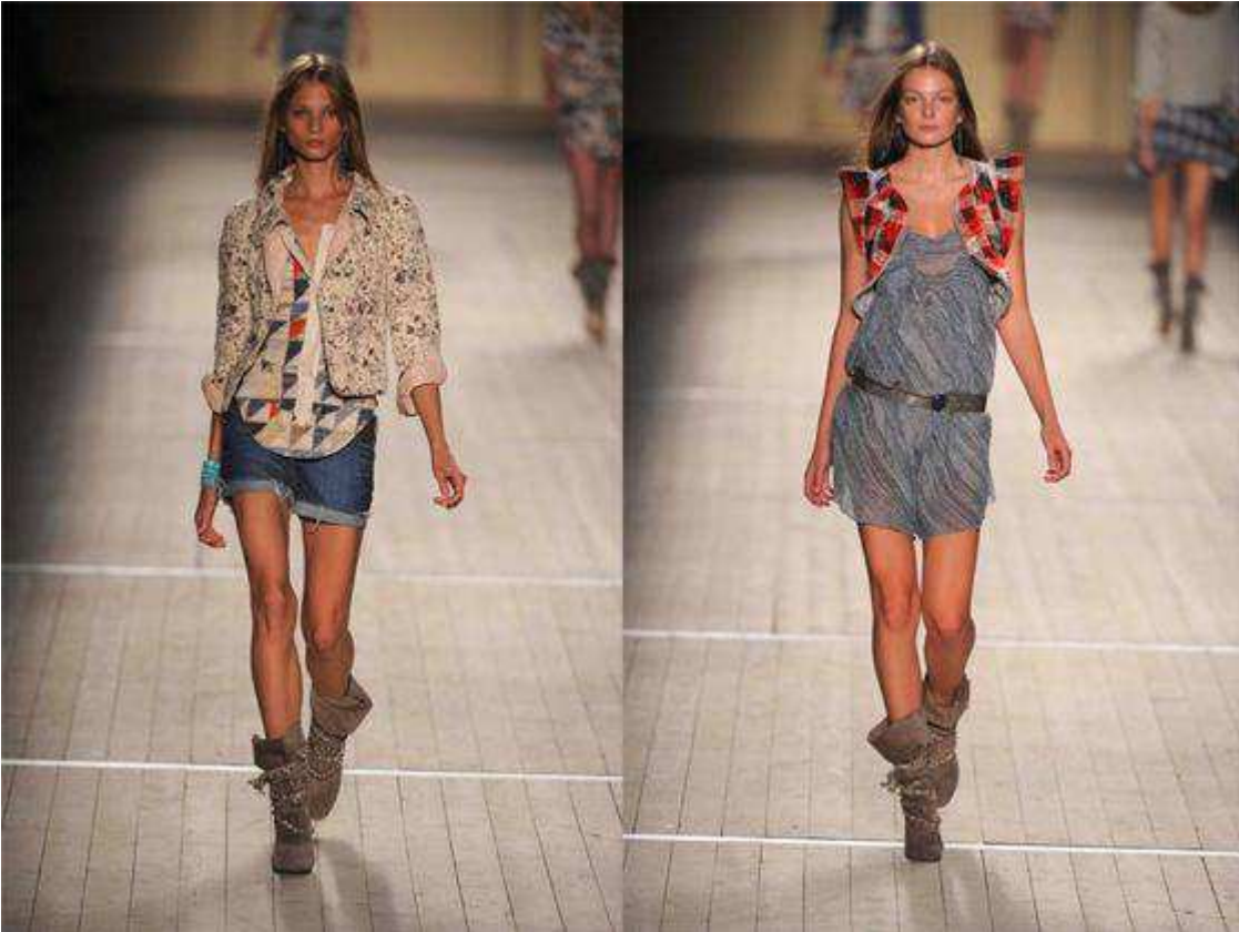
Fig.7. Modèles boots à chaines Isabel Marant - Collection automne/hiver 2009-2010.

Sur cette image, les photos du défilé mettant en évidence les boots à chaines Isabel Marant .