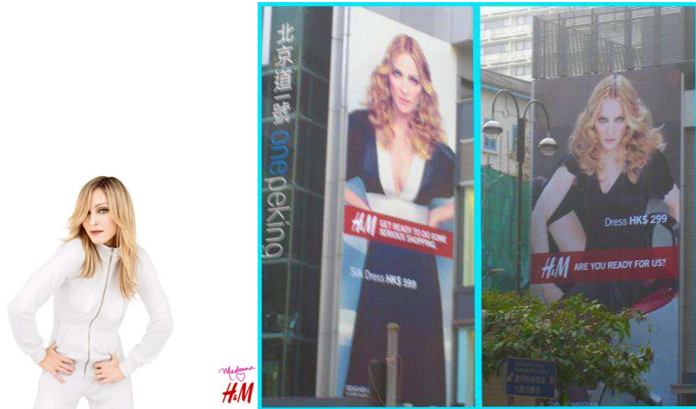
Fig.29. Visuel M by Madonna

que la collection Kate Moss était conçue en partenariat avec la mannequin à partir de ses propres vêtements préférés. Le prix aussi était très accessible, de telle sorte que ses jeunes admiratrices pouvaient s'habiller comme leur héroïne pour environ 45 livres : le prix d'une robe noire moulante. » 400 Alors qu'elle était déjà l'égérie d'autres marques, elle accepta de revisiter son inimitable style pour la clientèle de TopShop . « M by Madonna » est aussi l'illustration parfaite d'une collaboration réussie entre une marque ( H&M ) et une star de la chanson.