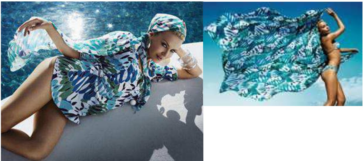
Fig.30.Collection H&M Loves Kylie , http://www.fanpop.com/spots/fashion-and-celebrity/images/65076/title/h-m-kylie-minogue .

Quelques mois plus tard, H&M exposait dans ses rayons une ligne de « vêtements de plage et de maillot de bain » ; une collection réalisée en partenariat avec la sulfureuse chanteuse australienne Kylie Minogue. Désignée comme consultante, la star présenta en 2007 une ligne de « beachwear » et « accessoires de plage » baptisée « H&M Loves Kylie », fruit de sa collaboration avec la styliste de l'enseigne, Margareta van Den Bosch. La collection comportait ainsi des « bikinis bleu-vert », parfois « dorés », des « pièces lamées argent » de même qu'une pléthore de combinaisons d'accessoires : « foulards » et « paréos » ; toujours avec des prix, accessibles aux jeunes, oscillant entre 9,90 à 29,90 euros. Le "buzz" et la campagne de communication avaient plus de chance de capter les jeunes d'autant plus que cette collaboration intervient tout juste avant « Kylie X », le 10e album de la star , paru à la fin de la même année.