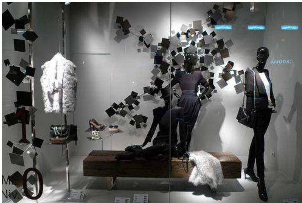
Fig.17. Vitrine ZARA strictement chic, rue Saint Honoré, 8 septembre 2009, http://www.journaldesvitrines.com/tag/zara/ .

Elégantes silhouettes noires sur fond de sculptures murales en métal chez ZARA.