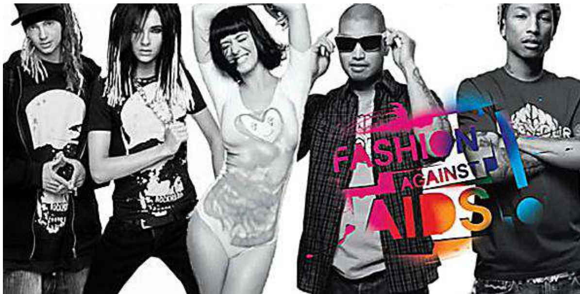
Fig. 34. Visuel de la campagne H&M : Fashion against aids .

Après Rihanna, c'était au tour des Tokio Hotel de trouver en avril 2009, du temps pour participer à la lutte contre le SIDA.