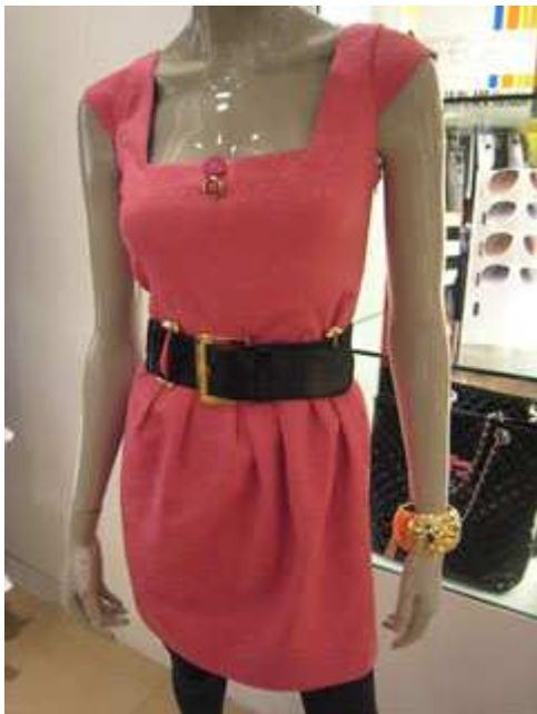
Fig. 2. Visuel contenu sur le site de WGSN illustrant les tendances suivies.

Le 9 mars, cette couleur a été présentée comme une couleur incontournable dans des magasins tel que River Island .