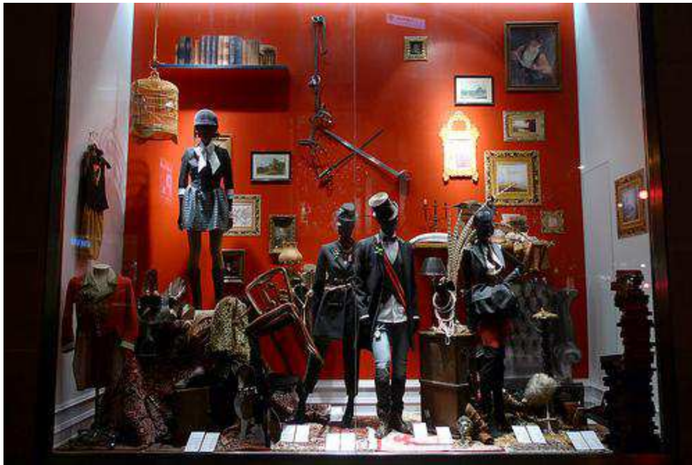
Fig.18. Vitrine H&M, 54 boulevard Haussmann, 17 novembre 2009 http://www.journaldesvitrines.com/tag/hm/ .

« H&M ne s'attache définitivement plus qu'à l'achalandage de ses points de vente. La magnifique ambiance anglaise dans la spectaculaire vitrine du magasin boulevard Haussmann le prouve. Meubles de styles, objets de curiosités et impostures visuelles côtoient tartans écossais et haut-de-forme dans un désordre cosu et sophistiqué. » 229 Ici, la couleur orange apporte plus de convivialité à l'espace de la vitrine.