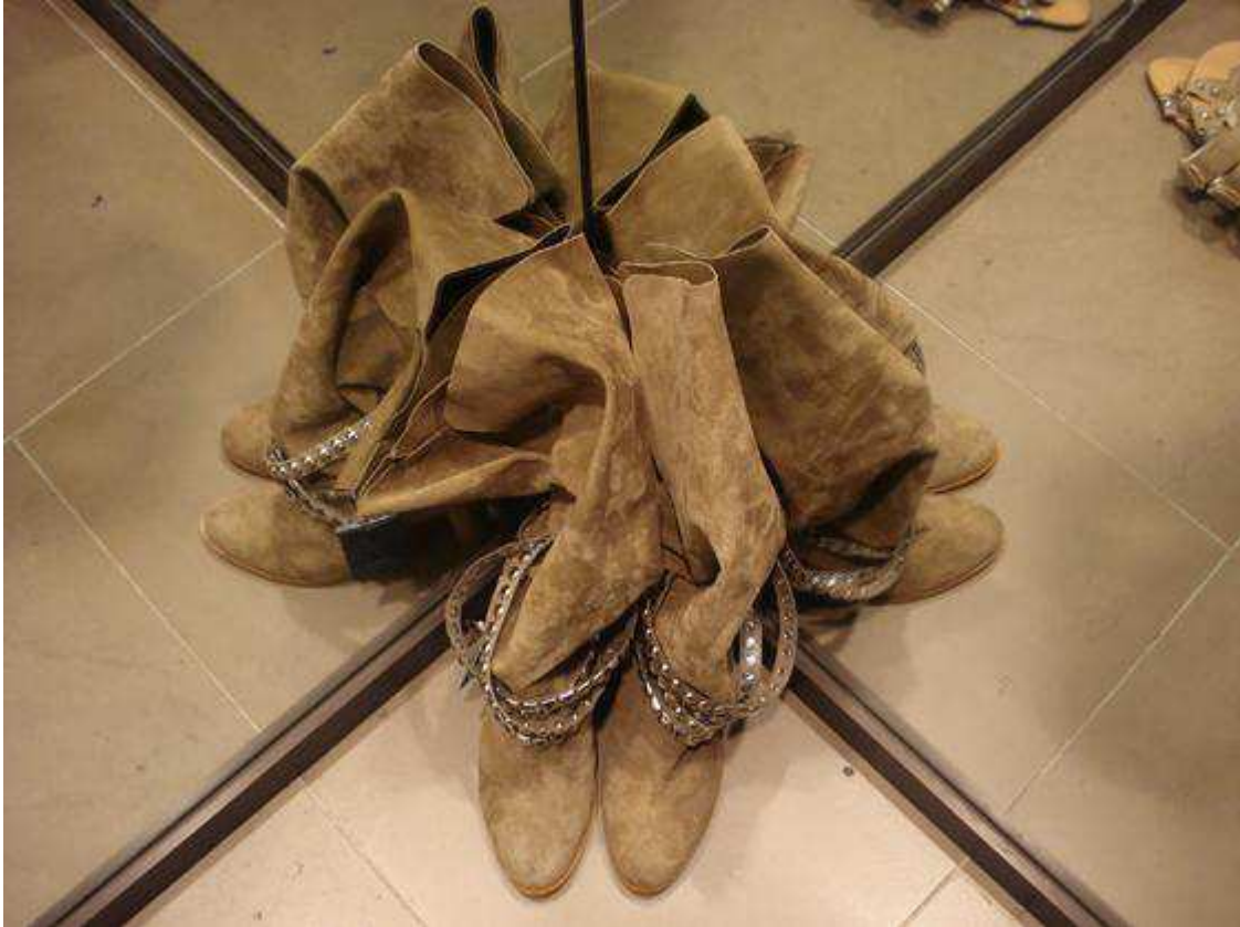
Fig.8. Photo prise chez ZARA par une blogeuse de mode au surnom de Punky et mise en ligne sur son blog le jeudi 22 janvier 2009.

Voilà la version ZARA des boots à chaînes Isabel Marant . La blogeuse de mode Punky ne peut s'empêcher d'ironiser en publiant le titre suivant sur son blog : « Ils sont Marant chez ZARA » ; elle les qualifie même de « bottes plates à la sauce Andalouse ! » Encore plus rapide, elles sont sorties avant même que les boots à chaînes Isabel Marant ne voient le jour en boutique. Quelques petites différences bien sûr comme par exemple les chaînes : elles sont cloutées alors que celles d' Isabel Marant sont plutôt comme celles des sacs Chanel . Le prix est de 139 euros chez ZARA, c'est beaucoup moins cher que chez Isabel Marant où il faut déboursier pas moins de 800 euros pour se les approprier. L'enseigne ibérique crée une collection inspirée et tendance, observée lors des défilés et vue dans les magazines. C'est