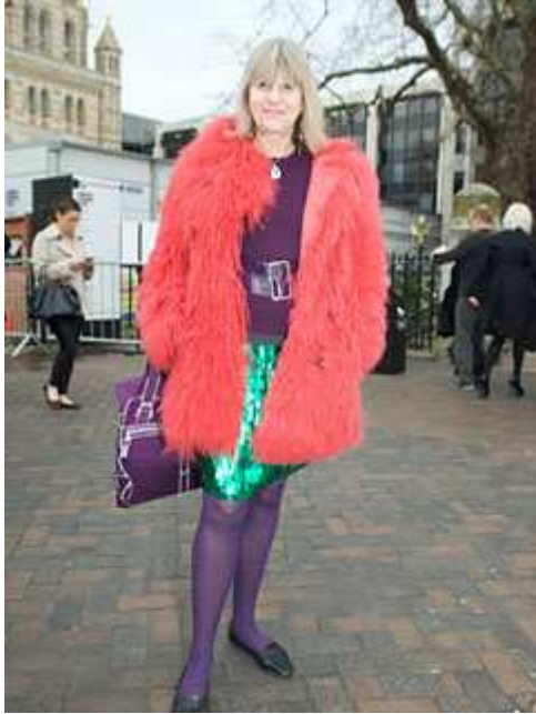
Fig. 1. Visuel contenu sur le site de WGSN illustrant les tendances suivies.

Le 9 mars, cette couleur a été présentée comme une couleur incontournable dans des magasins tel que River Island .