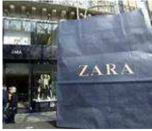
Fig.14. Modèle du sac d'emballage ZARA, www.latribune.fr .

ZARA ne s'aventure pas dans les quartiers populaires, la marque se limite dans les rues les plus prisées des centres villes. Selon Marie-Pierre Lannelongue, ZARA arriverait en tête des palmarès de vente, dans les magasins où elle a ouvert un corner, loin devant les plus grands qu'elle côtoie.