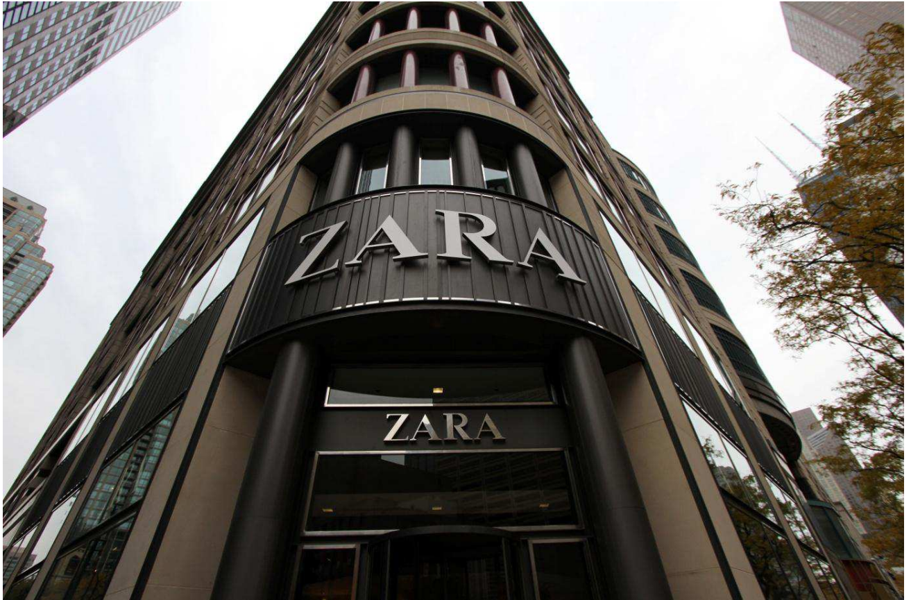
Fig.25. Visual du magasin ZARA de Chicago http://www.lecourrier.es/wp-content/uploads/ZaraChicago .

Comme on peut le voir, l'extérieur des magasins ZARA captent l'attention des passants de loin. Leurs façades sont repérables de loin de par leurs architectures souvent différentes de celles qui se trouvent aux alentours. Le mobilier et la décoration sont les mêmes dans l'ensemble des boutiques ZARA. Le choix d'un mobilier et d'une décoration à la fois design et simple s'inscrit dans une stratégie à long terme. En outre, ZARA attache une grande importance à l'espace de ses points de vente, tant en hauteur qu'en largeur : le point de vente doit être aéré. On peut constater qu'il y a deux types de magasins ZARA. Un ZARA haut-standing, dont la façade et très souvent l'intérieur même du magasin sont dignes d'un monument historique comme en atteste les images ci-dessus des ZARA de London westfield et de Chicago, et un ZARA moderne à la typologie basique. L'enseigne est sans cesse à la recherche de la première catégorie, afin de dorer son image en lui conférant une image plus luxueuse.