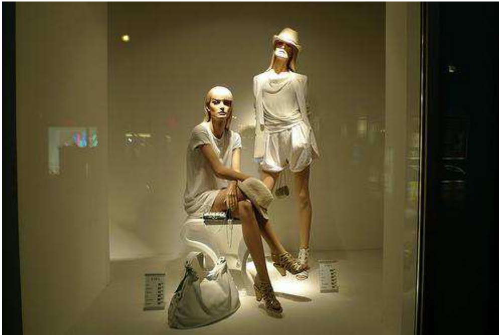
Fig.19. Vitrine ZARA : le 18 juin 2009 http://www.journaldesvitrines.com/mode-femme-homme/un-ete-en-blanc-chez-zara .