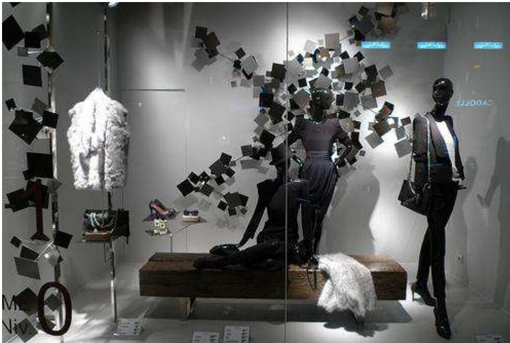
Fig.17. Vitrine ZARA strictement chic, rue Saint Honoré, 8 septembre 2009, http://www.journaldesvitrines.com/tag/zara/ .

Elégantes silhouettes noires sur fond de sculptures murales en métal chez ZARA.