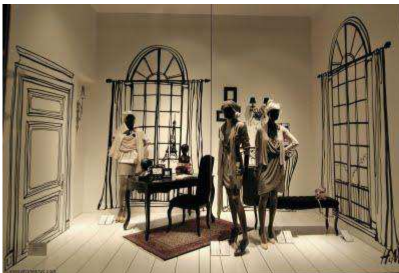
Fig.16. Vitrine H&M Bd Haussmann le 1 octobre 2009 http://www.orserie.fr/mode-tendances/article/les-nouvelles-vitrines-h-m-5819 .

Nouveau concept, nouveau style de vitrines, nouveau visage pour H&M Boulevard Haussmann. Un véritable intérieur en noir et blanc qui donne beaucoup plus de vie à ces nouvelles mises en scènes.