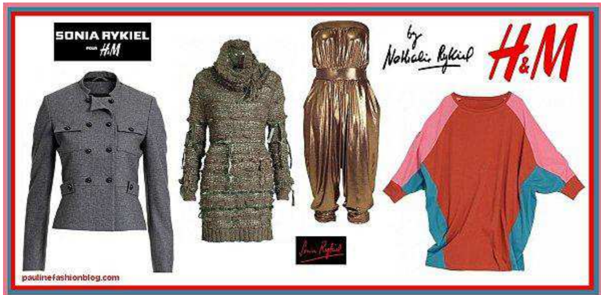
Fig.38. Modèles de la collection: Sonia Rykiel pour H&M .

dans les magasins H&M mais aussi dans les boutiques Sonia Rykiel . Quelques mois plus tard la seconde ligne consacrée à la maille et signée Sonia Rykiel voyait le jour. Celle-ci a été vendue dans un nombre restreint de magasins (28 en France, soit bien plus que pour Jimmy Choo ). Les jeunes pouvaient encore une fois de plus s'offrir le luxe de s'habiller en haut de gamme à des prix attractifs ; un argument de vente infailible.