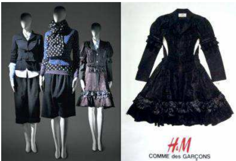
Fig.36. Modèles de la collection H&M Comme des Garçons par Rei Kawakubo.

Les prix sont un peu plus élevés que d'ordinaire ; il faut compter pas moins de 299 euros rien que pour la robe.