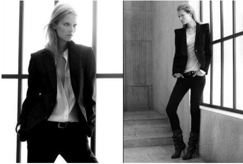
Fig.5. ZARA - Collection automne/hiver 2009-2010

À droite, l'image du défilé de mode Balmain , à gauche, un modèle ZARA qui s'en inspire. ZARA livre ici à sa clientèle sa version de l'un des must have pressenti pour la saison : des « vestes épaulées d'inspiration Balmain ». L'inspiration s'incarne aussi par le look comme en attestent les images ci-dessous.