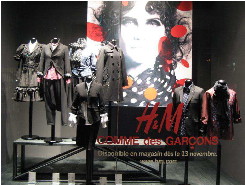
Fig.23. Vitrine H&M lors de la présentation de la collection H&M Comme des Garçons par Rei Kawakubo.

qui consiste à mettre au fond de la vitrine la photo de la campagne de publicité du moment avec un produit en premier plan. Les vitrines H&M suivent assez régulièrement cette organisation : les vitrines ont pour décoration une « light box » (tirage photo rétro éclairée) qui reprend le visuel de la campagne magazine. Bien souvent il s'agit de la photo de collaboration avec le couturier de renom choisi, comme en atteste l'image ci-dessous.