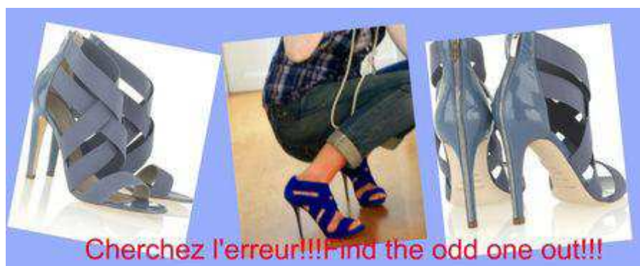
Fig. 3. Sergio Rossi @ Net a Porter.

Les sandales « Bondage » Sergio Rossi en question sont celles portées par la blogeuse au milieu de l'image. Si celles-ci valent 500 euros, la version que propose ZARA à côté ne coûte que 50 euros. Les idées circulent surtout en Italie et ainsi va la mode.