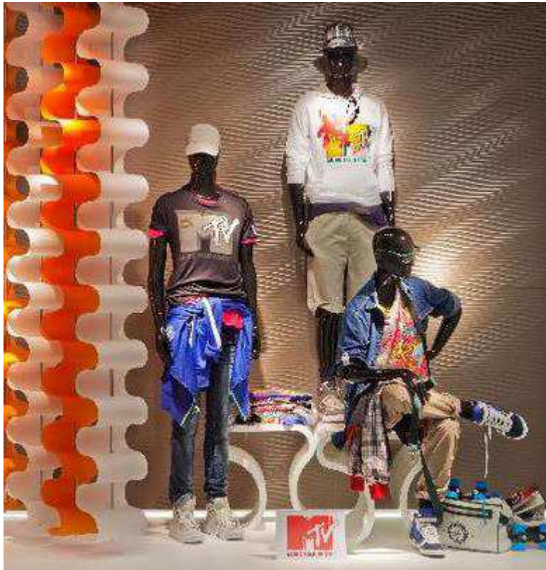
Fig. 40. Vitrine de la collection du co-branding ZARA avec la chaîne de télévision MTV.

Une ligne masculine inspirée du style de la « culture urbaine » et composée de t-shirts et de sweats.