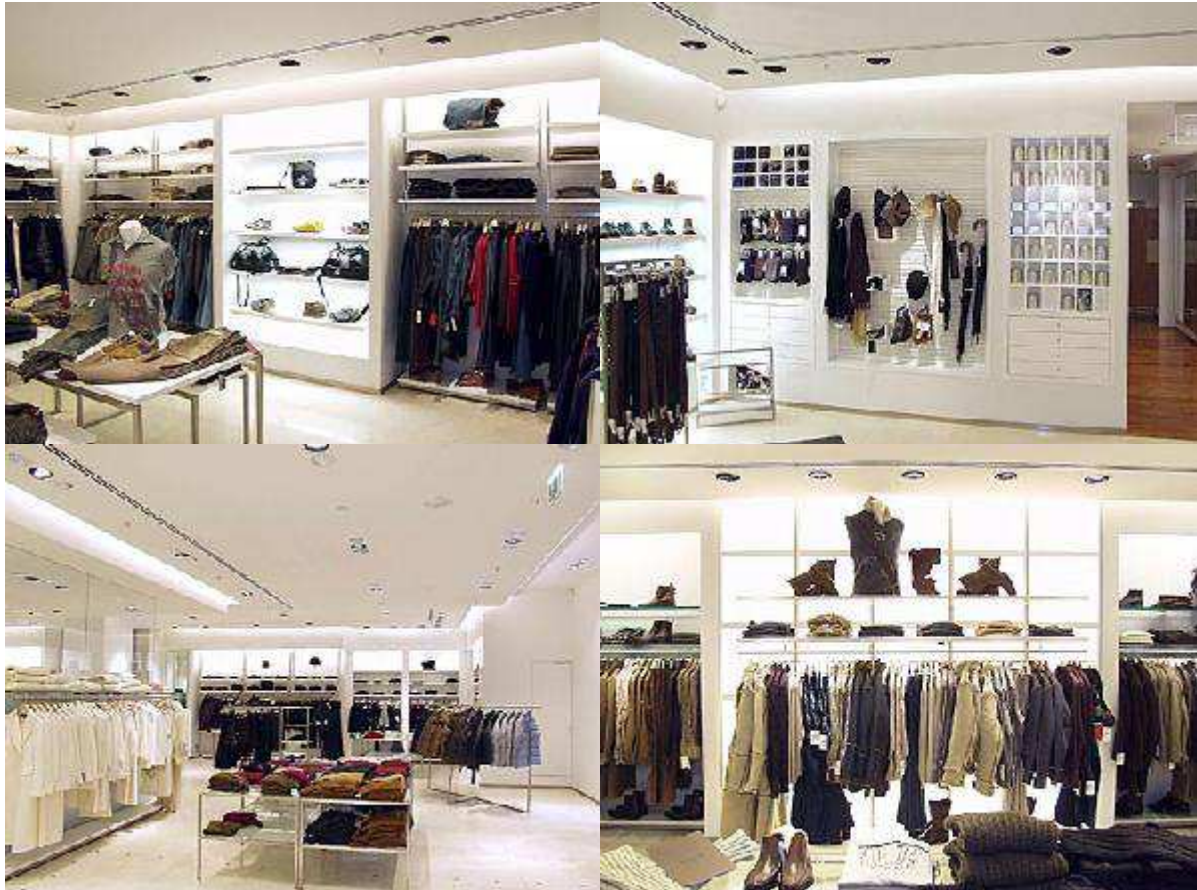
Fig. 26. Merchandising ZARA.

Les espaces sont grands, ce qui permet d'hierarchiser et de faciliter la lisibilité de l'offre de produits qui est de plus en plus complexe. « Les vêtements sont présentés dans des espaces qui respirent et habituellement, sauf les samedi après-midi pendant les soldes, les clientes aussi ont de la place autour d'elles. » 298