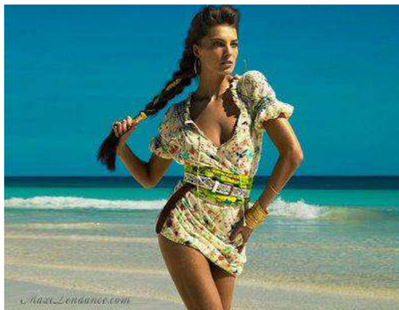
Fig.42. Robe 69,90 euros, collection été : « Matthew Williamson pour H&M », WWW.hm.fr .

Les formes multiples que prennent les insertions publicitaires dans les magazines représentent des manières plus astucieuses d'opérer la communication visuelle. C'est une stratégie complémentaire à la communication visuelle classique car en plus de la forte visibilité confortée, ces formes de publicités permettent au magazine d'acquérir une certaine crédibilité via un discours novateur. Les femmes constituent la principale cible des marques insérées dans ces magazines et la place qui leurs y est destinée est déterminante. Car les magazines féminins offrent aux marques un support idéal dont les caractéristiques sont en parfaite adéquation avec la cible féminine. Une posture centrée sur une certaine complicité avec les femmes, pour mieux les aider à exprimer leur féminité et leur potentiel de séduction. Cette presse au service des femmes bénéficie donc auprès de ces dernières d'une bonne perception qu'elle met au service des marques de mode en leurs octroyant des places stratégiques dans ses pages. Un gain important pour les marques de mode qui peuvent de ce fait asseoir ou pérenniser leur renommée. La presse féminine s'érige comme un support d'influence grâce à l'omniprésence des marques et à la réceptivité des femmes aux messages publicitaires, qu'ils soient implicites ou explicites. Grâce à la cible commune qu'elle partage avec les marques de