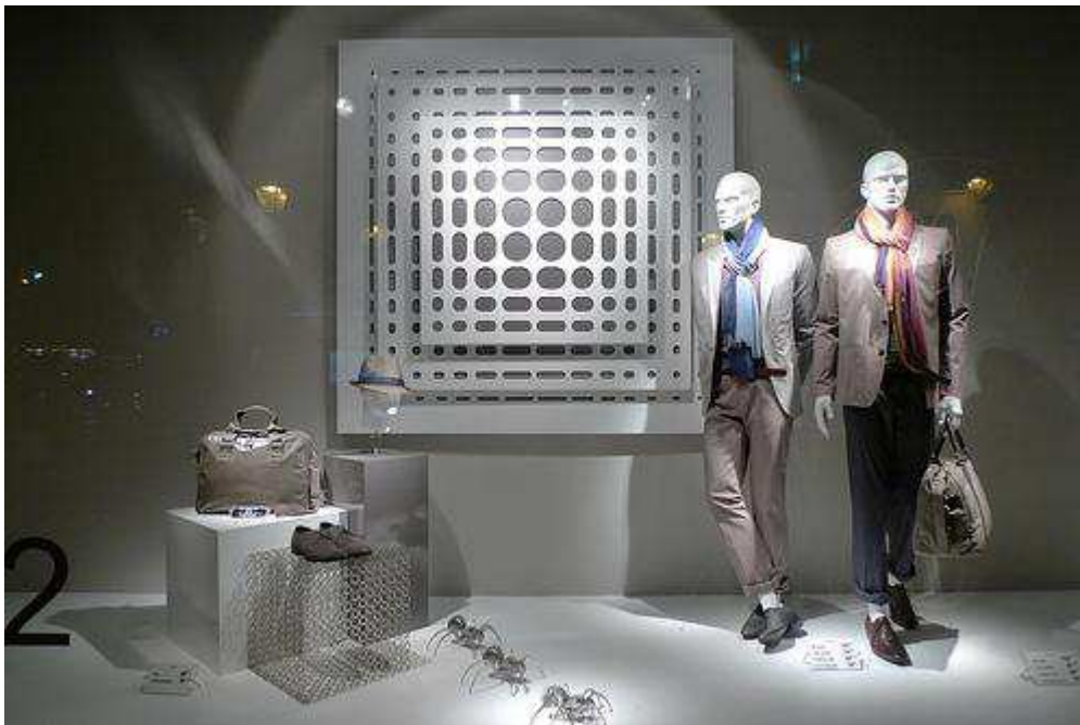
Fig.21. Vitrine ZARA Paris, février 2010.

Mais les vitrines n'ont pas toujours été présentées de la même manière. Dans les années 70, avant le minimalisme japonais qui a fait école, les vitrines étaient le plus souvent surchargées. L'idée en vigueur était alors de montrer qu'en plaçant à la vue du public le plus de produits possible, on signifiait l'existence en boutique d'un choix vaste permettant de réaliser des ventes en grande quantité. À l'heure actuelle, des impératifs de clarté, de simplicité et de lisibilité ont considérablement fait évoluer la présentation des vitrines. De nos jours, les marques présentent dans leurs vitrines un nombre limité de produits en proposant une, voire deux silhouettes seulement.