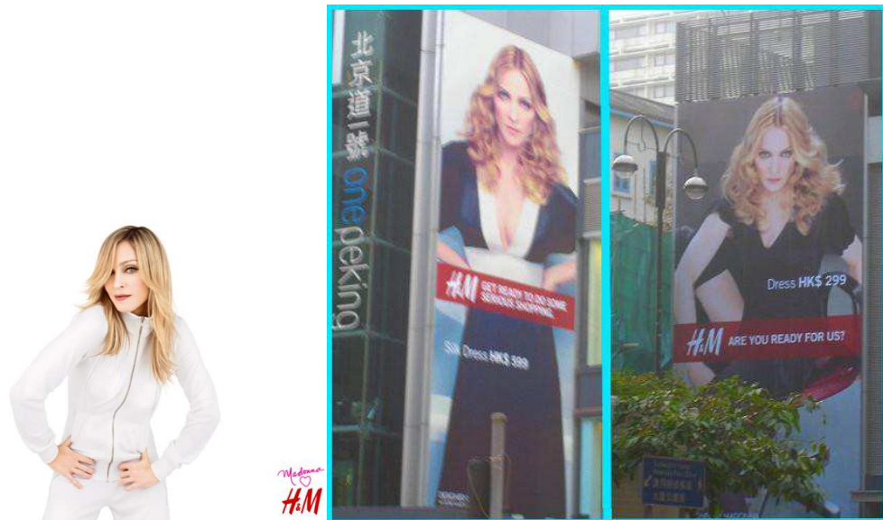
Fig.29. Visuel M by Madonna

que la collection Kate Moss était conçue en partenariat avec la mannequin à partir de ses propres vêtements préférés. Le prix aussi était très accessible, de telle sorte que ses jeunes admiratrices pouvaient s'habiller comme leur héroïne pour environ 45 livres : le prix d'une robe noire moulante.» 400 Alors qu'elle était déjà l'égérie d'autres marques, elle accepta de revisiter son inimitable style pour la clientèle de TopShop . « M by Madonna » est aussi l'illustration parfaite d'une collaboration réussie entre une marque ( H&M ) et une star de la chanson.