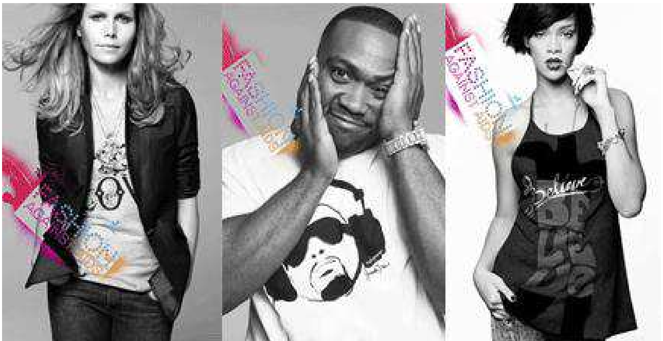
Fig. 33. Visuel de la campagne H&M : Fashion against aids .

Les jeunes savent qu'ils achètent des marques de vêtements promues par des stars car ces dernières s'affichent explicitement comme leurs ambassadrices. Un jeune qui "craque" sur un vêtement H&M porté par Johnny Depp dans un spot publicitaire sait que ce dernier est là pour le capter, l'inciter à l'acheter. Il est conscient que le spot publicitaire n'est qu'une mise en scène qui vise à le capter, le séduire afin qu'il achète l'article en question. La star est ici clairement associée à la marque dans un contexte purement marchand. D'autres types de captation s'avèrent beaucoup moins explicites, à la limite de la manipulation. Il s'agit de campagnes publicitaires où la marque s'associe à une star pour défendre une cause bien déterminée. Cette situation est souvent mise en évidence par H&M qui coopère régulièrement avec « Designers against aids » (DAA) pour concevoir des collections consacrées à la lutte contre ce fléau qu'est le sida. En association avec des célébrités telles que Rihanna (cf. image ci-dessous), Timbaland, Scissor Sisters, Jade Jagger, et bien d'autres artistes, la marque crée la collection « Fashion against aids », composées de vêtements hommes et femmes.