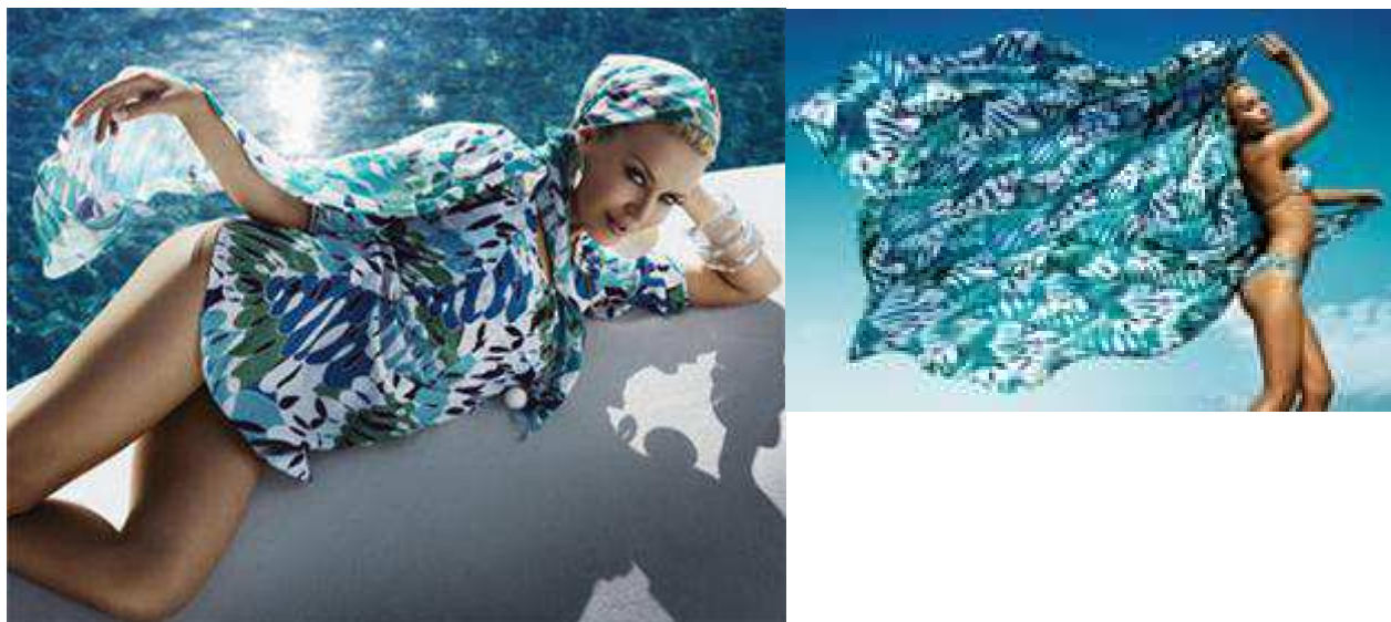
Fig.30.Collection H&M Loves Kylie , http://www.fanpop.com/spots/fashion-and-celebrity/images/65076/title/h-m-kylie-minogue .

Quelques mois plus tard, H&M exposait dans ses rayons une ligne de « vêtements de plage et de maillot de bain » ; une collection réalisée en partenariat avec la sulfureuse chanteuse australienne Kylie Minogue. Désignée comme consultante, la star présenta en 2007 une ligne de « beachwear » et « accessoires de plage » baptisée « H&M Loves Kylie », fruit de sa collaboration avec la styliste de l'enseigne, Margareta van Den Bosch. La collection comportait ainsi des « bikinis bleu-vert », parfois « dorés », des « pièces lamées argent » de même qu'une pléthore de combinaisons d'accessoires : « foulards » et « paréos » ; toujours avec des prix, accessibles aux jeunes, oscillant entre 9,90 à 29,90 euros. Le "buzz" et la campagne de communication avaient plus de chance de capter les jeunes d'autant plus que cette collaboration intervient tout juste avant « Kylie X », le 10e album de la star , paru à la fin de la même année.