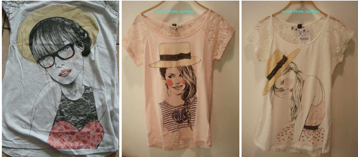
Fig.12. Image de Pandora triée sur un ensemble de photos postées sur son blog effigie.