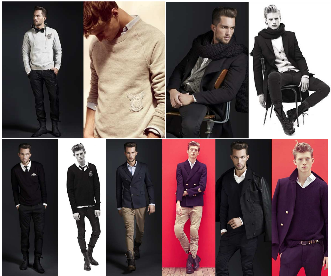
Fig.6. Lookbooks de ZARA vs lookbooks de Balmain .

Sur ce montage d'images, on dispose à chaque fois d'un comparatif de duo de photos : à gauche le look ZARA , à droite celui de Balmain . Les différentes comparaisons permettent d'opérer les rapprochements des collections de ZARA de celles de Balmain . Les coupes des vêtements, les détails tels que les boutons, les styles et les postures, les combinaisons jusqu'aux looks , rien n'est épargné. On est en phase de se demander si la frontière entre