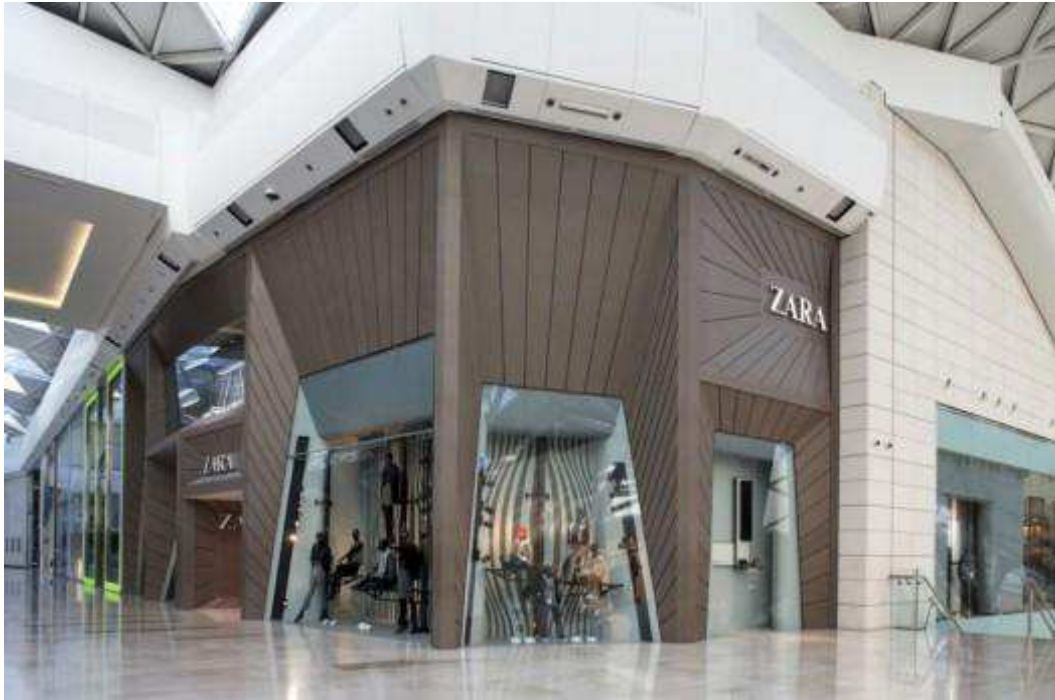
Fig. 24. ZARA London westfield présente un nouveau Edge To Mall Architecture, 10 mars 2010.

Un magasin phare de ZARA dans le centre commercial Westfield de Londres. La façade du magasin est construite de panneaux angulaires. La couleur est moulée au long de chaque panneau, en réduisant l'apparence de l'usure et aux rayures.