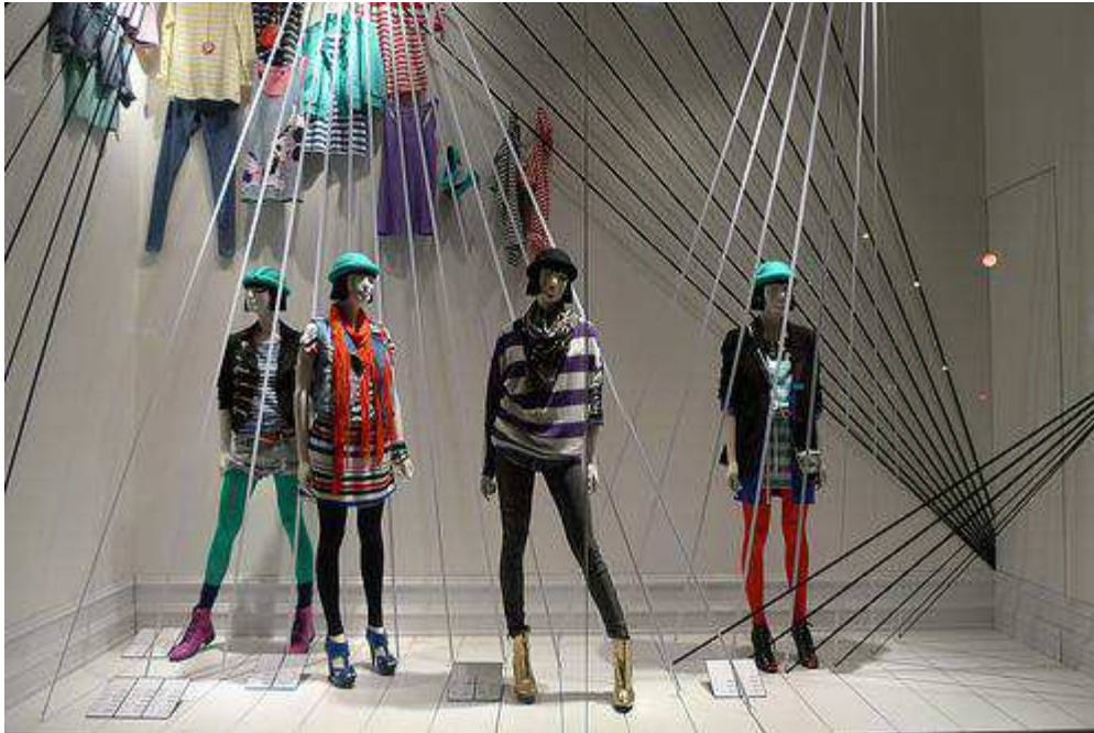
Fig.15. Vitrine H&M , 54 boulevard Haussmann, http://www.journaldesvitrines.com/tag/hm/ .

Le jean par exemple est un article qui est toujours tendance, alors pour se distinguer les unes les autres, les marques jouent sur : le délavage, la teinture, la broderie. Pour produire le vêtement unique, les créateurs iront même jusqu'à le torturer, déchirer voire le transformer en cuire. Le défi pour les marques de prêt-à-porter consiste non seulement à proposer le produit unique tout en restant dans la tendance mais aussi de marquer une différence par rapport aux autres tout en restant dans l'air du temps.