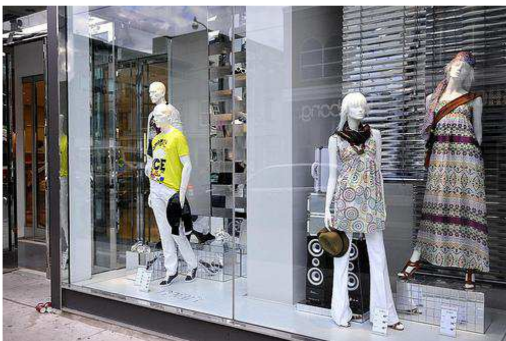
Fig. 22. Vitrine ZARA, Queen Street, Toronto, http://www.blogvertical.com .

que ce soit aussi agréable d'un côté comme de l'autre, que tout soit fluide, visible.» 260 L'absence de fond laisse le regard du passant pénétrer à l'intérieur du magasin et découvrir la proposition produits, son étendu, les articles mis en avant. Ce parti pris d'un magasin visible de l'extérieur afin d'offrir d'emblée au consommateur une bonne perception de ce qui est à l'intérieur implique de s'attacher au maintien de l'ordre sur le point de vente avec une rigueur particulière. Le passant est en effet à même de mesurer, au premier coup d'œil, la fréquentation, l'assortiment du produit de la boutique. Autrement dit, choisir d'être visible de l'extérieur, ce qui permet au passant d'avoir d'emblée une bonne perception de ce que propose le magasin, comporte des risques. Car de loin, on voit s'il y a des clients qui fréquentent le magasin ou pas. Une absence de client risque de freiner l'envie de découverte des clients. «La vitrine sans fond offre par ailleurs la possibilité de renforcer la proposition produit en plaçant à proximité de la vitrine des articles complémentaires (silhouettes, couleur, matières).» 261 Cette posture n'est pas partagée par l'enseigne ZARA qui privilégie la vitrine avec fond.