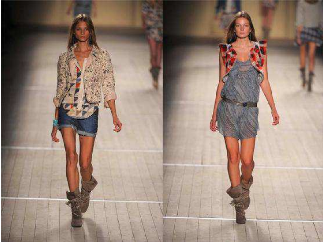
Fig.7. Modèles boots à chaines Isabel Marant - Collection automne/hiver 2009-2010.

Sur cette image, les photos du défilé mettant en évidence les boots à chaines Isabel Marant .