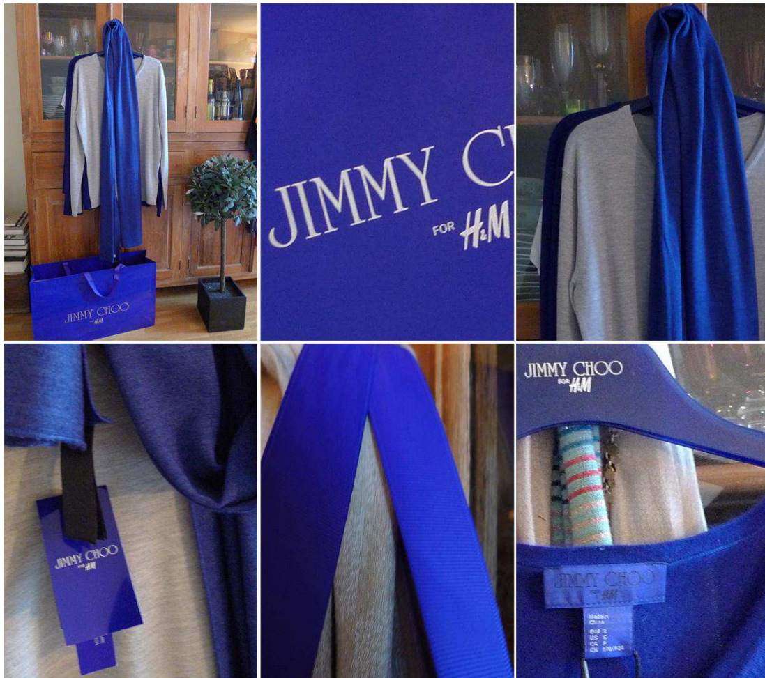
Fig.37. Visuel d'un échantillon de la collection: Jimmy Choo pour H&M .

Cette marque d'accessoires est souvent portée par les grandes stars hollywoodiennes telles qu'Eva Mendes, Lindsay Lohan, Cate Blanchett, ou encore Halle Berry. Que l'on se souvienne du film Le Diable s'habille en Prada , Anne Hathaway a eu finalement droit à sa paire de Jimmy Choo . Par cette collaboration, H&M veut offrir aux jeunes l'occasion, voire le rêve de se pavaner également en Jimmy Choo et de jouer les stars . Ainsi le 14 novembre 2009 précisément, près de 200 magasins H&M dans le monde proposaient une collection d'accessoires Jimmy Choo , constituée de chaussures et de sacs. L'équipe de design de Jimmy Choo a également créé une ligne de vêtements pour femmes de même que des accessoires et chaussures pour hommes.