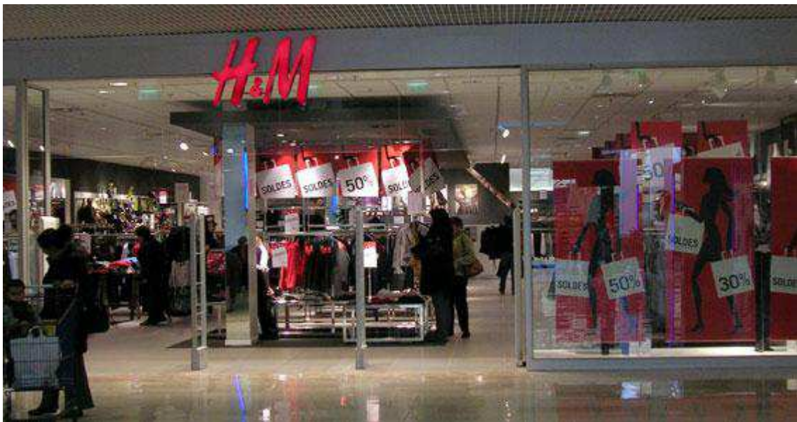
Fig.27. Visuel de l'espace de vente H&M en période de solde.

H&M évolue aussi à la fois sur le marché des vêtements masculins, féminins et enfants, des sous-vêtements hommes et femmes et des accessoires. L'assortiment H&M est à la fois large avec plusieurs références constamment renouvelées et profond avec parfois plusieurs dizaines d'articles exposés en rayon. La logique de segmentation de l'assortiment se fait par univers de produits ; un espace spécifique à la lingerie est par exemple alloué. De face, de profil, sur étagères, portants, bustes etc. H&M a poussé loin l'occupation des murs par les vêtements.