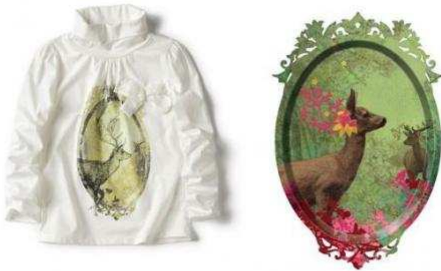
Fig.13. Image du vêtement créé par ZARA à gauche, chef d'oeuvre biche de la société de design Ibride à droite.

Cette image créée en 2008 par la société de design Ibride pour une collection de plateaux de décoration ressemble fortement à l'illustration du vêtement de ZARA. Tout comme les blogueuses, la société demande des explications à l'enseigne : « Nous exposons les faits, leurs demandons des dommages et intérêts ainsi que l'apposition Zara by Ibride sur les étiquettes des vêtements concernés » 14 Pour Amanda Beltran, porte-parole de la société Ibride , tenter un procès à un géant de la mode tel que ZARA est quasiment mission impossible, son seul recours possible reste donc l'utilisation des réseaux sociaux pour « faire du bruit », créer le buzz et manifester son mécontentement.