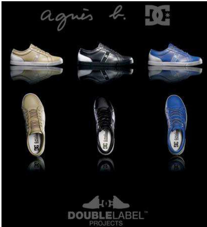
Fig. 39. Collection du co-branding DC Agnès B Double Label™.

La collection de chaussures ne sera vendue que dans les boutiques Agnès B à 200 euros la paire. Démocratiser la mode en s'inspirant des marques de luxe n'est pas le seul moyen de captation utilisé par ZARA. Proposer des articles en adéquation avec les attentes des jeunes par le biais de l'observation des tendances à suivre est une pratique désormais associée chez ZARA avec le concept du co-branding . En association avec MTV, une chaîne de télévision urbaine renommée "hyper branchée" et qui se revendique d'être le leader auprès des 15-24 ans, la marque leader de vêtements dits "tendances" à prix accessibles crée une collection baptisée « Streetmuse by Mtv ».