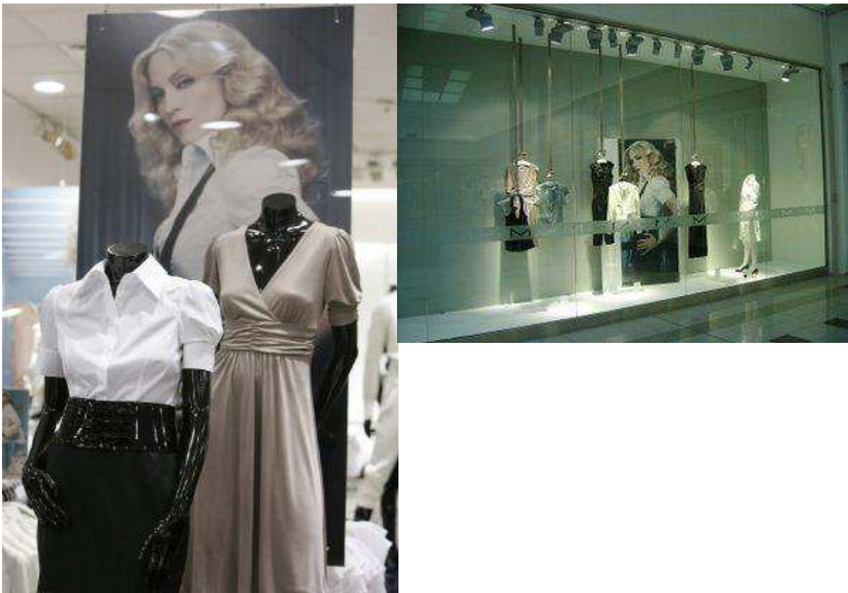
Fig.20. Visuel M by Madonna dans toutes les vitrines H&M du monde en 2007.

La vitrine est aussi le premier aspect du magasin qui accueille le client, mais au-delà de ce rôle de lien, entre l'intérieur et l'extérieur, la vitrine est un réel outil publicitaire qu'il ne faut pas négliger et qui peut détenir une place importante dans la politique de communication d'une marque de mode. Elle est un vecteur d'image et de promotion et possède un dynamisme aussi puissant qu'une photographie de mode ; elle fait appel à l'imaginaire, au ludique, au mystère et vient prolonger les valeurs d'une marque ou champ d'inspiration d'une campagne de publicité. Quand on voit dans la presse une publicité H&M avec comme modèle Madonna, star incontournable, et que dans toutes les vitrines du monde entier est reproduite la même scène mais avec un mannequin translucide, le passant fait immédiatement l'amalgame. Et au cas où il ne l'aurait pas assimilé, un visuel gigantesque de la campagne fait figure de fond sur toute la grandeur de la vitrine.