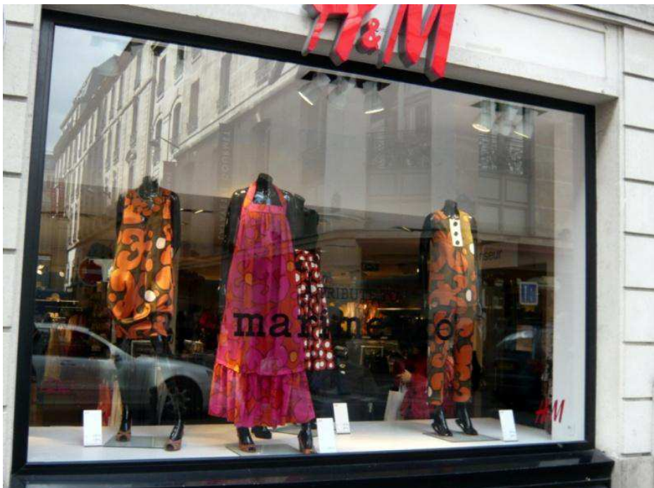
Fig. 35. Vitrine H&M pour la campagne de la collection : « A Tribute to Marimekko ».

Bizarrement, je pensais que j'allais détester vu que je n'accroche pas du tout à Marimekko à la base. Mais j'ai l'impression que H&M a remodernisé tout ça. C'est pas mal, je porterais sans souci (rien ne me fait peur en matière de mode) mais je trouve que ça fait un "peu hippie" et le look un "peu hippie", j'ai soupé. Je suis plutôt dans ma période très "femme". (Réaction d'une internaute à propos de l'article Marimekko chez H&M , la collection hommage, in http://www.madmoizelle.com/hommage-a-marimekko-chez-hm_2008-03-13-367 .)