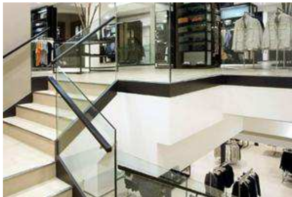
Fig.28. Visuel du merchandising du magasin pilote ZARA à Barcelone.

Au sein du magasin ZARA, le client n'a pas d'itinéraire à suivre. À l'entrée du magasin, on trouve la marque « Women », qui symbolise davantage le côté haut de gamme de la marque. En ce qui concerne l'aménagement des boutiques, les gammes de produits homme, femme, enfant etc. sont séparées en rayon, pour aider le consommateur dans sa démarche d'achat. Dans la plupart des boutiques, ces différents rayons sont à des étages différentes comme en atteste le visuel ci-dessous du magasin pilote de ZARA à Barcelone situé dans l'avenue très touristique Las ramblas .