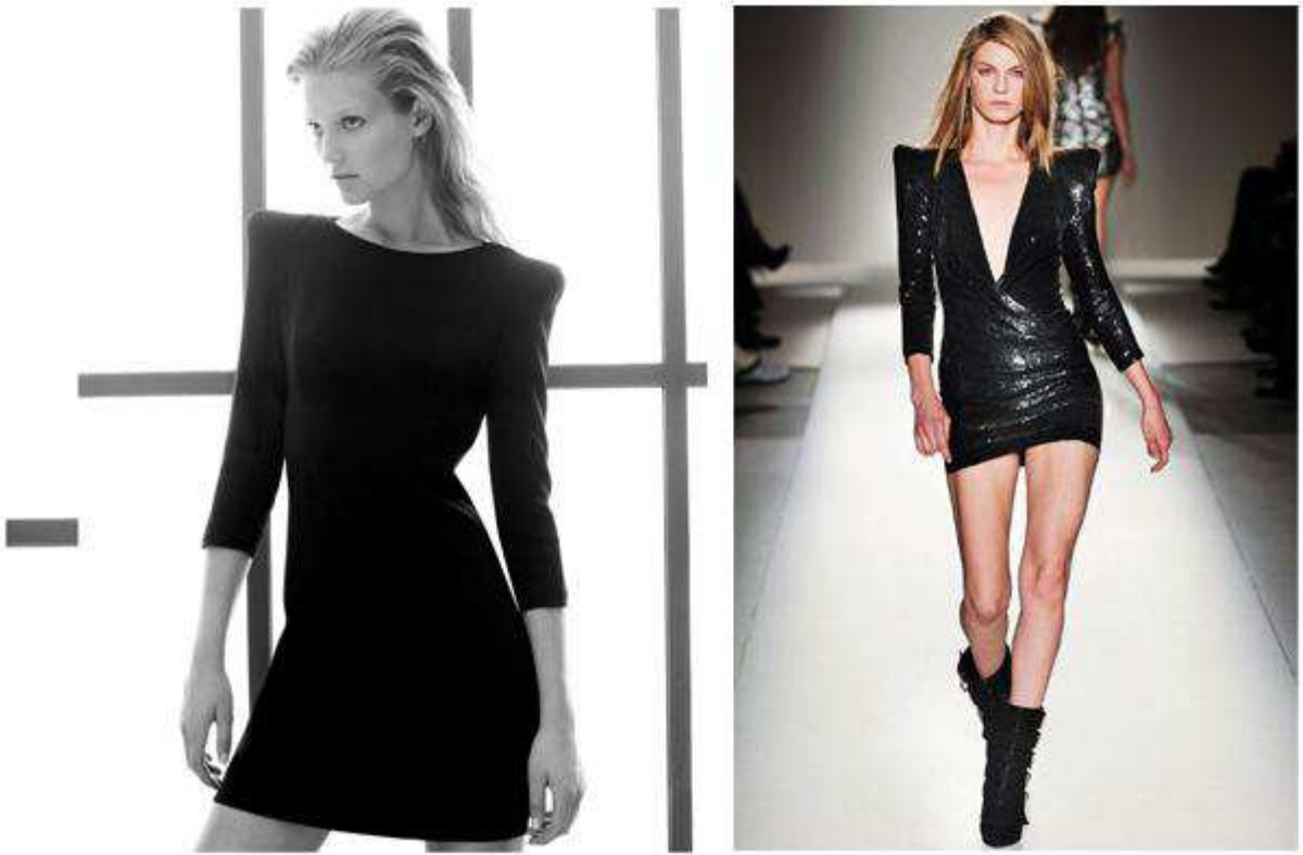
Fig.4. ZARA-collection-automne-hiver-2009-2010, www.tendances-de-mode.com .

À droite, on a l'image du défilé de mode Balmain , à gauche, un modèle ZARA qui s'en inspire.