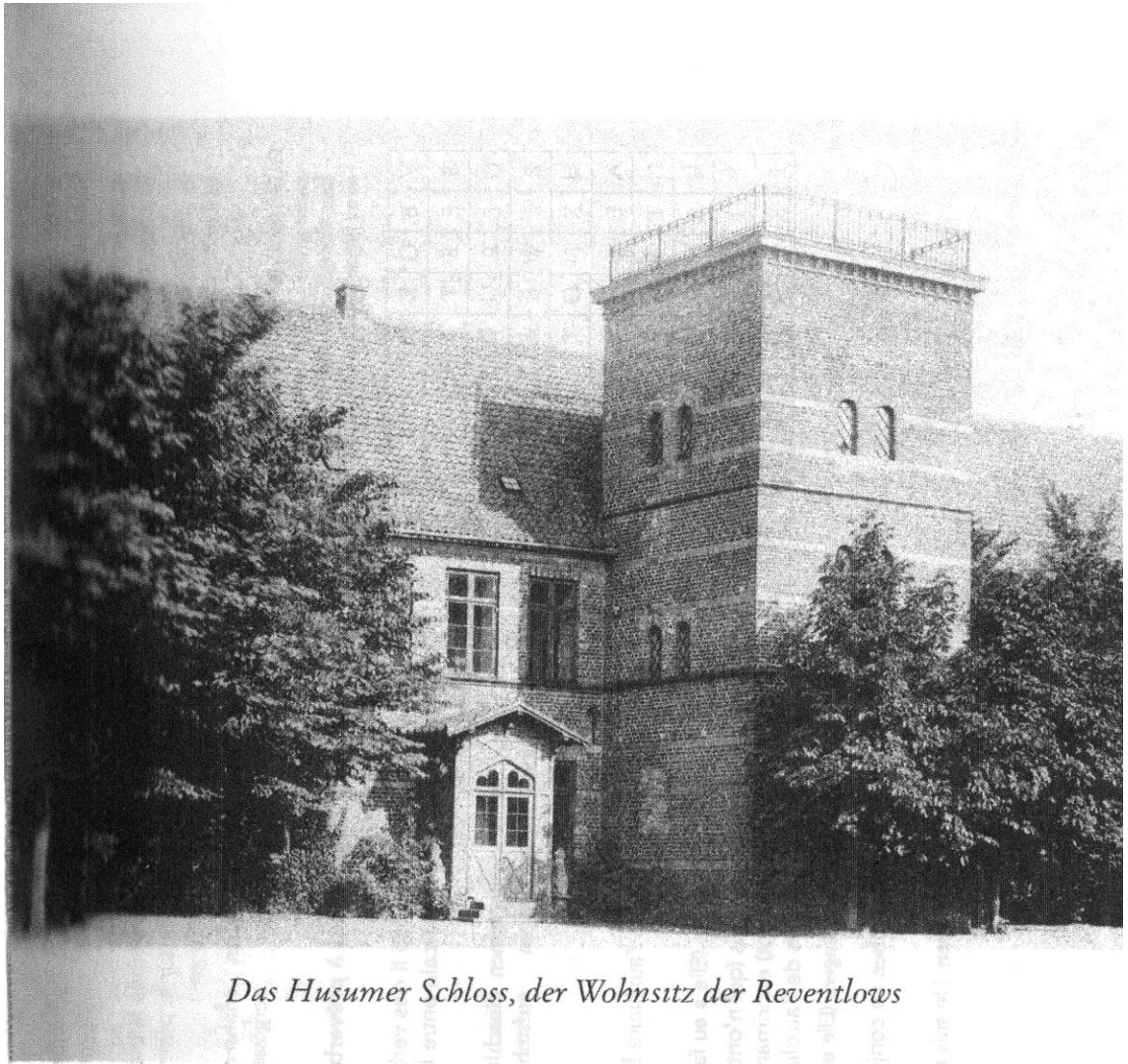
Das Husumer Schloss, der Wohnsitz der Reventlows

Le château de la famille Reventlow à HUSUM