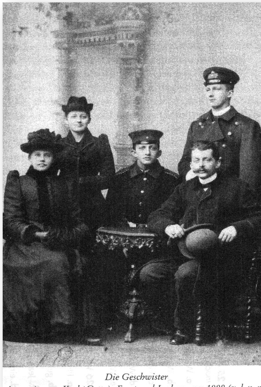
Les frères et sœurs du Comte Ernst de Reventlow (debout à droite)