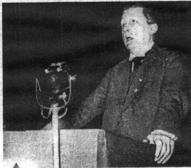
Hauer (oben) und Reventlow (unten) auf der Sportpalastkundgebung. Aus: Durchbruch 19, 1935.

Jakob Wilhelm Hauer et Ernst Reventlow au Palais des Sports de Berlin (1935)