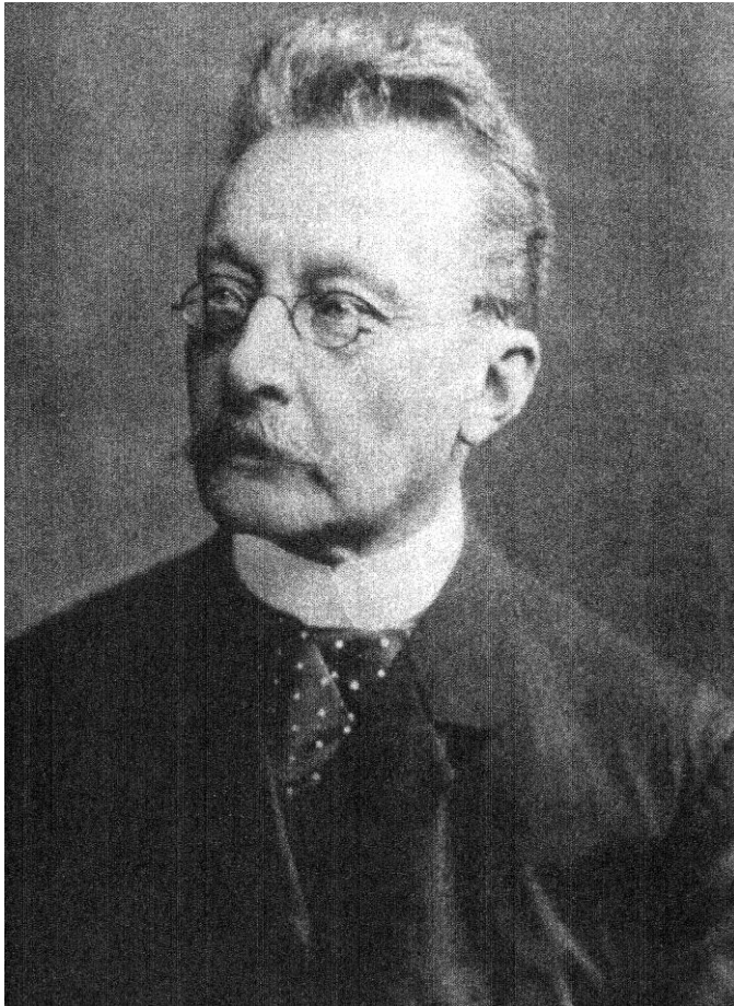
Ludwig Graf zu Reventlow (1824 – 1893)