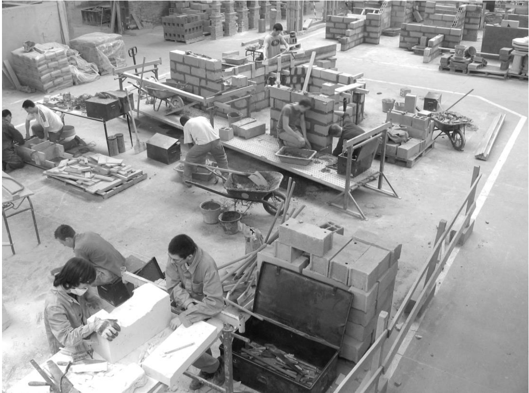
Vue sur l'atelier au moment où les jeunes gens sont en action.

d'une vrai. Nous voulions également proposer une remonté dans le temps, pour redécouvrir des techniques anciennes en composant avec des matériaux modernes. Dès le projet lancé, nous avons visité, avec les 12 élèves de la classe, le lieu où se place la tour, puis le musée de la ville. La tour a été située sur le plan relief de la ville, en retrouvant des liens architecturaux entre le passé et le présent. Cette phase de présentation terminée, les membres de la classe ont réalisé, dans l'atelier du lycée professionnel, l'ouvrage à une échelle \frac{1}{2} , deux fois plus petite, ce qui permettait de circuler à l'intérieur et de conserver un aspect imposant. Pendant toute la réalisation, les jeunes gens ont été comme emportés et ils disparaissaient physiquement dans l'ouvrage. Le petit chantier était comme une machine harmonieusement entraînée par le flux du désir de réaliser l'ouvrage.