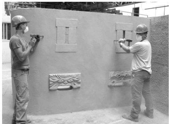
La réalisation des élèves au moment du démontage de l'ouvrage.

Nous avons même ressenti chez les adolescents de la joie dans le fait de déconstruire l'ouvrage et de ranger les éléments qui l'avaient constitué. Comme des enfants rangent leur chambre après avoir bien joués. Le moment du démontage de l'ouvrage était un nouveau départ vers une nouvelle action, celle de tout mettre à plat pour s'élancer à nouveau. Chez ce groupe d'adolescents, le désir s'est construit puis déconstruit. Les jeunes gens se sont élaborés un toit, comme une cabane de vacances, avec en plus une dimension archéologique qui serait celle de retrouver les gestes d'autrefois. En élaborant, les croquis nécessaires à la réalisation, ils se sont mis en état de production, telle une usine, avec ses ateliers, ses zones de stockages, ses espaces de conception et d'assemblage. Nous avons le sentiment, en organisant la réalisation et en conseillant sur les techniques à mettre en place d'être devant un chantier « playmobile 190 ».