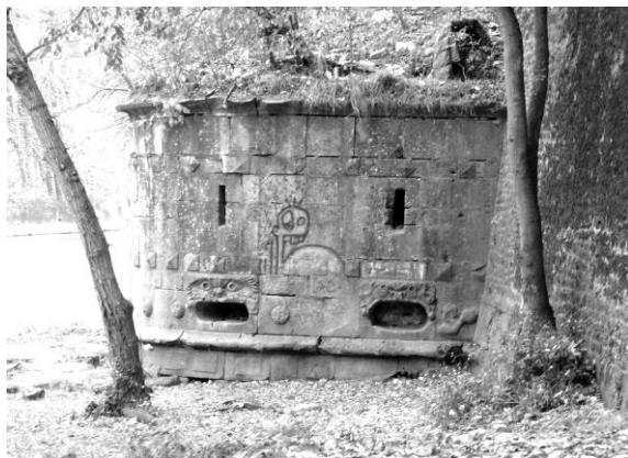
La tour Dex dans son état actuel.