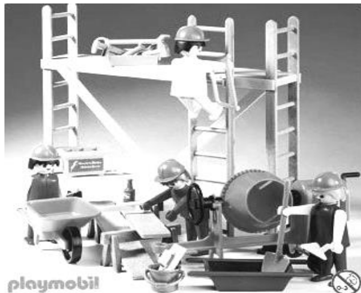
Couverture de la boîte de playmobil n° 3492, « Spécial métiers, chantier et travaux publics, ouvriers de chantier et échafaudage ».

Il y a une transposition entre la vue sur l'atelier où le groupe classe est en action et cette couverture de boîte de jouets qui symbolise le travail d'ouvriers de chantier. Ainsi, chaque membre de la classe avait une fonction, des outils, des accessoires, la charge d'une tâche et l'organisation totale de l'ensemble faisait entrer le groupe dans une machine désirante. C'était là un désir qui paraissait bien en accord avec l'image idyllique du chantier, une image d'Épinal. Mais le désir d'apprendre a duré bien au-delà de l'objet construit. Le désir s'est poursuivi dans le fait de débarrasser ce qui avait été construit. Pourtant, la norme aurait voulu conserver encore quelque temps l'ouvrage, pour le mettre en valeur, mettre en valeur l'établissement. L'acte de déconstruction, nous est apparu comme une résistance. Le groupe d'élèves continuait à apprendre en déconstruisant, car démolir et