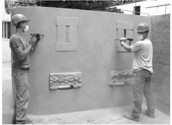
La réalisation des élèves au moment du démontage de l'ouvrage.

Nous avons même ressenti chez les adolescents de la joie dans le fait de déconstruire l'ouvrage et de ranger les éléments qui l'avaient constitué. Comme des enfants rangent leur chambre après avoir bien joués. Le moment du démontage de l'ouvrage était un nouveau départ vers une nouvelle action, celle de tout mettre à plat pour s'élancer à nouveau. Chez ce groupe d'adolescents, le désir s'est construit puis déconstruit. Les jeunes gens se sont élaborés un toit, comme une cabane de vacances, avec en plus une dimension archéologique qui serait celle de retrouver les gestes d'autrefois. En élaborant, les croquis nécessaires à la réalisation, ils se sont mis en état de production, telle une usine, avec ses ateliers, ses zones de stockages, ses espaces de conception et d'assemblage. Nous avons le sentiment, en organisant la réalisation et en conseillant sur les techniques à mettre en place d'être devant un chantier « playmobile 190 ».