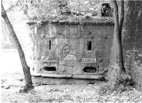
La tour Dex dans son état actuel.