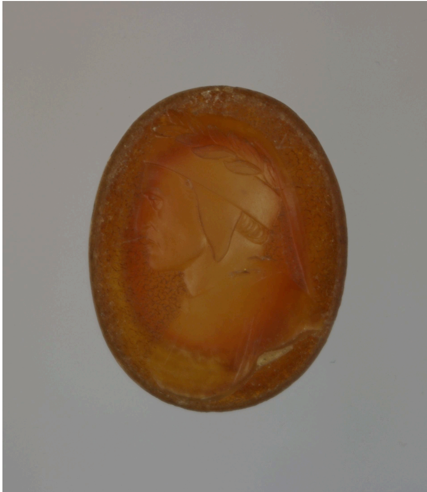
Fig. 2. Intaglio su corniola di Dante Médiathèque centrale de l'Agglomération de Montpellier