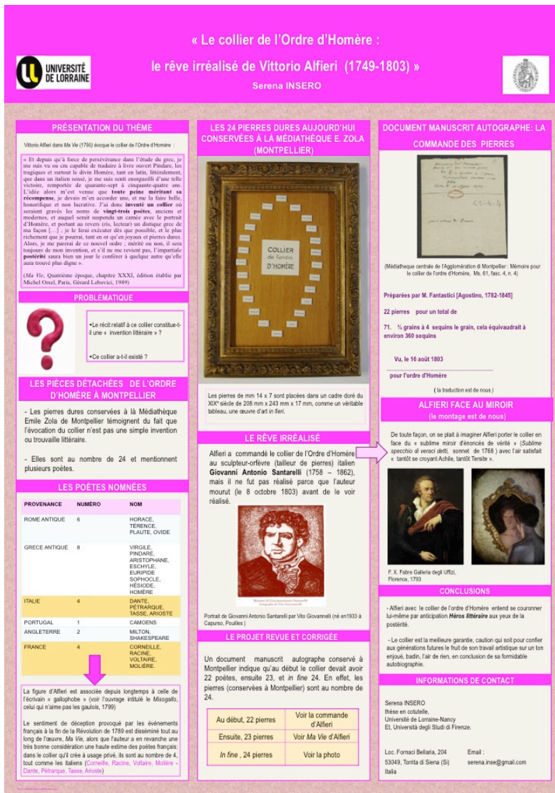
Poster sulla Collana dell'Ordine di Omero (Nancy, 2014).