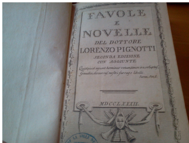
Foto del volume Favole e novelle (1782), inviato da Lorenzo Pignotti ad Alfieri. Il 2 luglio 1782 ( Epistolario , I, pp. 130-131) il poeta piemontese scrive al favolista aretino:

Ho ricevuto [...] la di lei lettera col volume delle poesie; m'ha fatto un grandissimo piacere vedere ch'ella si ricordasse di me, ma già io prima m'ero ricordato molto bene di lei: e avuto l'avviso ch'era uscito un suo libro, l'avea commesso, e ricevuto, e in parte letto quando mi giunse il suo. Tanto più glie ne son dunque tenuto, poichè coll'inviarmelo mi presta opportunità di congratularmene seco, e dirle che quelle favolette già da lei recitami, ora alla lettura mi sono anche più piaciute.