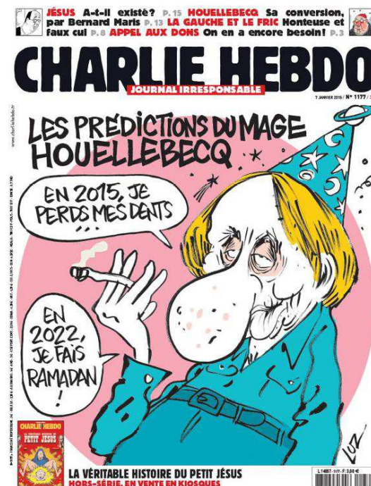
La Une de Charlie Hebdo du 7 janvier 2015

La fatalité a voulu que, le jour même de l'attentat, le nouveau livre de Michel Houellebecq, Soumission 12 , est paru dans les librairies françaises. Il n'y aurait rien d'étrange, si ce n'est que ce roman controversé (le plus attendu de la nouvelle année) traite exactement du futur de l'islam en France : le roman met en scène une France islamisée, en 2022, avec un président musulman issu d'un parti appelé « Fraternité musulmane ». Fatalité supplémentaire : le livre de Houellebecq était à la Une du dernier numéro de Charlie Hebdo , paru lui-aussi le 7 janvier et s'ouvrant avec le titre de : « Les prédictions du mage Houellebecq ».