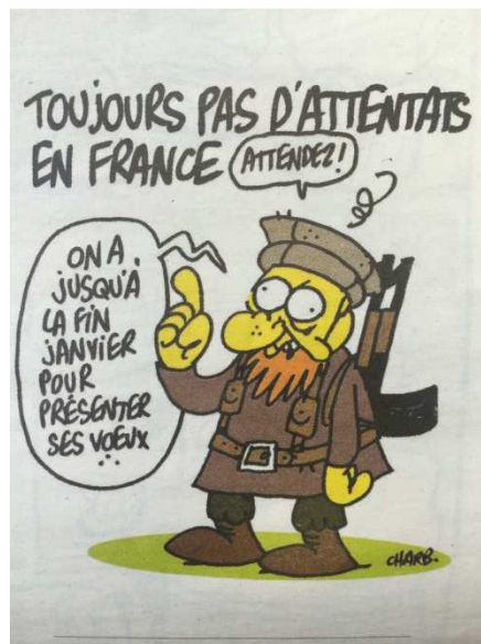
Le dernier dessin de Charb, paru dans Charlie Hebdo le 7 janvier 2015

publicitaire déjà programmée n'a pas pu être arrêtée : plusieurs kiosques des villes françaises exposaient, en coïncidence avec l'attentat, la Une du magazine L'Obs , consacrée à Houellebecq et intitulée : « J'ai survécu à toutes les attaques » 14 . Triste ironie du sort, et du titre, si l'on pense aux douze personnes tués lors de l'attaque contre Charlie Hebdo ... Le télescopage entre ces deux événements a été d'ailleurs évoqué directement par le premier ministre Manuel Valls qui, dans une émission sur RTL du 8 janvier 2015, a affirmé que « La France, ça n'est pas Michel Houellebecq, ça n'est pas l'intolérance, la haine et la peur » 15 , en décourageant ainsi toute réaction islamophobe à l'attentat ihadiste . Un attentat que Stéphane Charbonnier (dit Charb), directeur de Charlie Hebdo et cible principale de l'attaque, avait satiriquement prévu dans ce qu'il deviendra son dernier dessin, paru lui-aussi le jour même de l'attentat (une série de coïncidences dramatiques tournent autour de cet événement) :