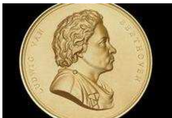
Médaille Beethoven de la Philharmonic Society créée en 1870.