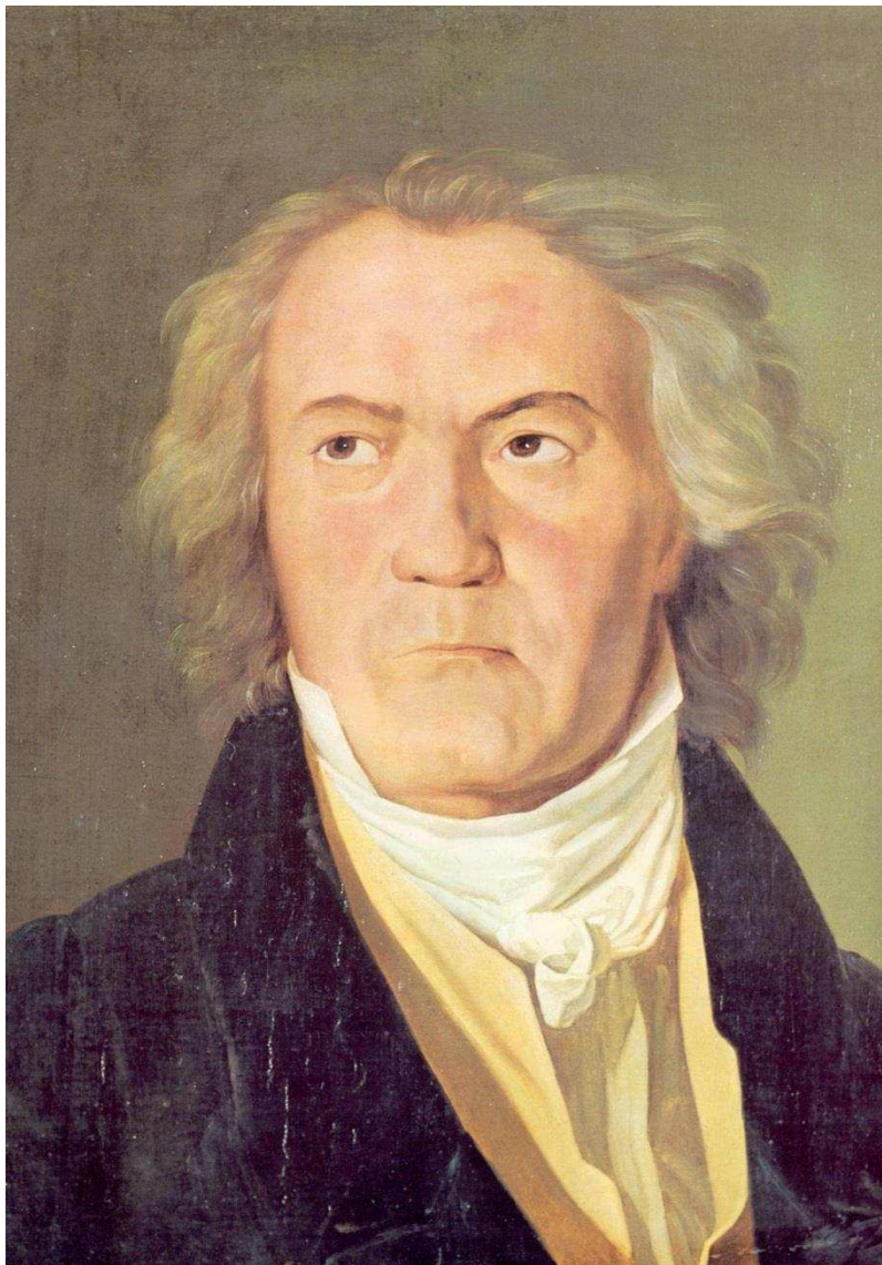
WALDMULLER, Ferdinand, Ludwig van Beethoven, 1823, huile sur toile, 84x75, Vienne : Kunsthistorisches Museum