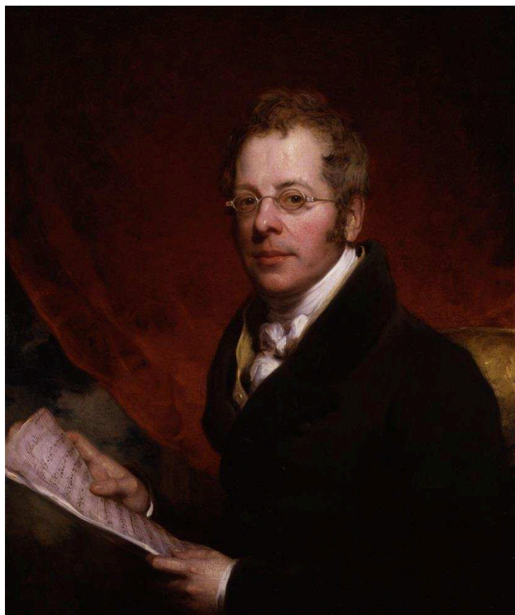
Sir George Smart 343