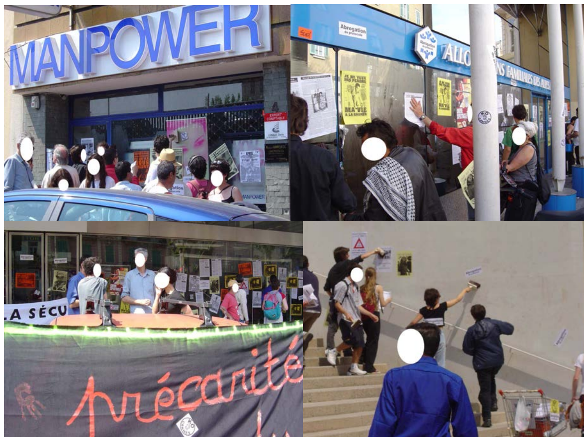
Photographies 22, 23, 24 et 25 : Promenade de « recouvrement ». Cannes, 20 mai 2004

Pour cette « promenade de recouvrement », les militants ont décidé, à l'issue d'une longue discussion en assemblée générale, de ne pas recouvrir les panneaux publicitaires. Les