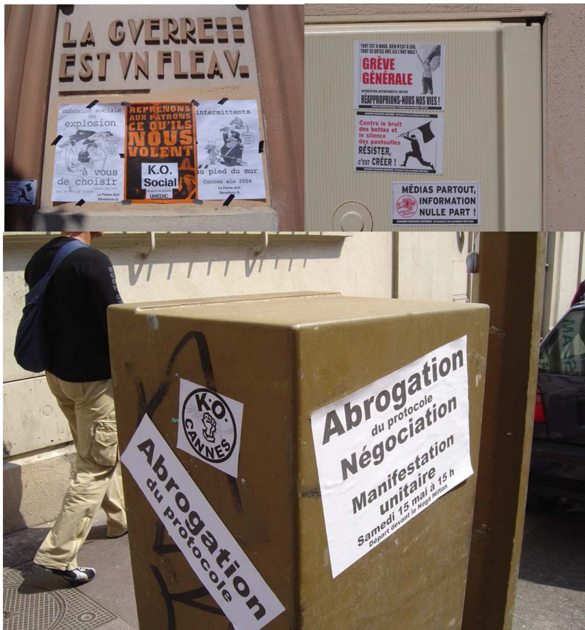
Photographies 19, 20 et 21 : Affichages dans la ville. Cannes, mai 2004.

C'est une campagne d'affichage assez classique, qui n'en est pas moins une manière d'occuper l'espace et d'attirer l'attention des passants. S'engage alors une lutte de territoire entre les intermittents et la municipalité qui prend soin de faire disparaître chaque jour les traces laissées par les contestataires, principalement sur les panneaux publicitaires et les affiches de film.