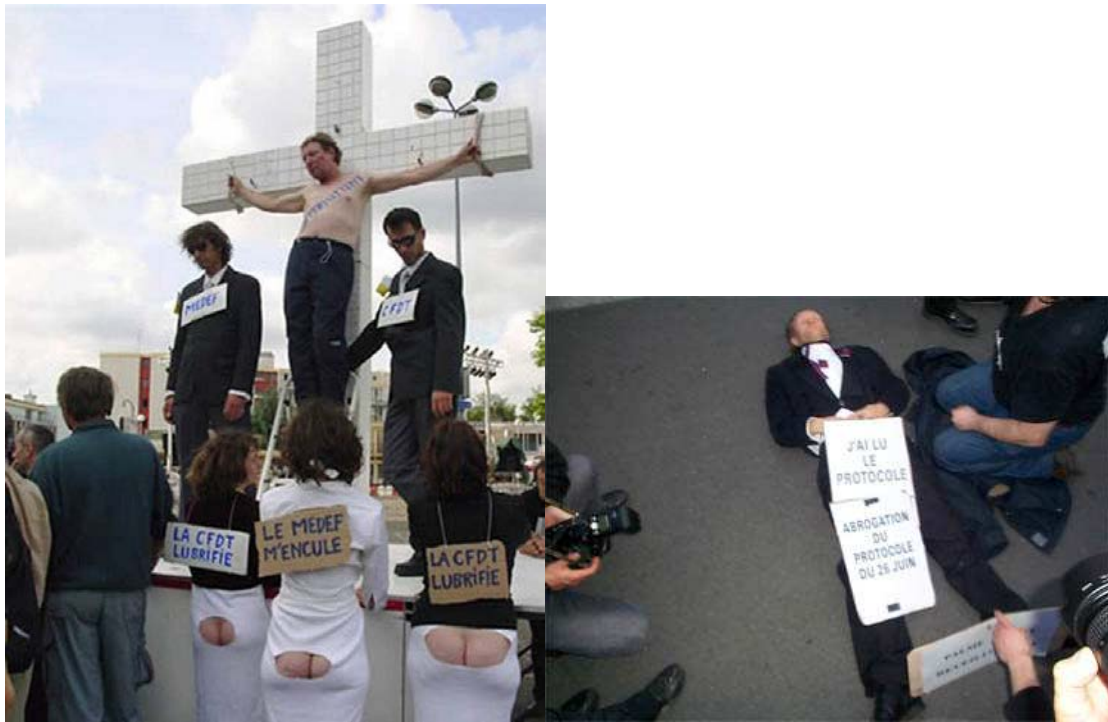
Photographie 3 : Performance Rouen, Juillet 2003 - Photographie 4 : Cannes 2004

Ces actions qui mettent en scène les corps 68 « en danger » traduisent ce que Jean-Marc Leveratto nomme une « esthétisation de la civilité ». Selon l’auteur, « aux yeux de tous ceux qui sont sensibles à la condition personnelle des “exclus”, agir pour ce rapprochement confère une supériorité aux artistes qui luttent contre l’exclusion sur ceux qui ne font rien d’autre que leur métier artistique. » 69 La particularité des actions dont il est question ici est néanmoins que la représentation met en scène l’artiste lui-même comme exclu (ou comme menacé d’exclusion, « on brade la culture »). L’action contribue donc à la fois à grandir l’artiste, celui qui met ses compétences artistiques au service d’une visée éthique, et « favorise l’engagement affectif du spectateur dans la situation » 70 au sens où la monstration de la souffrance en appelle à la compassion du public 71 .