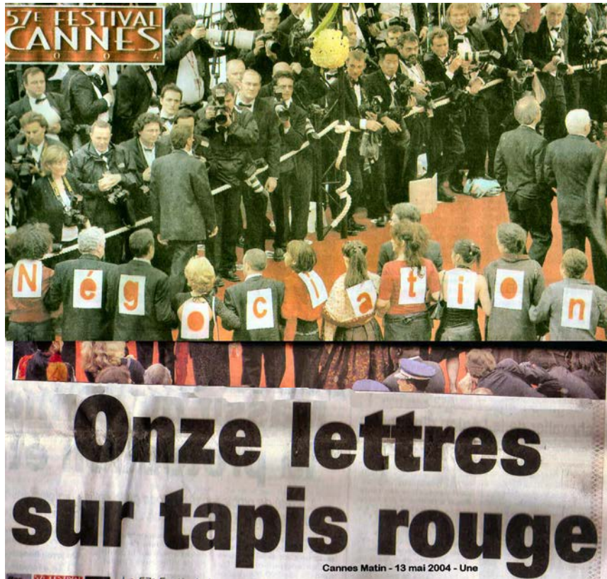
Photographie 1 : Les intermittents montent les marches (Une de Cannes Matin , 13 mai 2004)

Mais les projets des contestataires ne se limitent pas à cette parade sous les flashes et les projecteurs. Ils prévoient au contraire d’occuper l’espace pendant toute la durée du festival. Afin de bien marquer leur présence, ils s’installent dans le théâtre des Mutilés, situé dans un quartier populaire à cinq minutes de la prestigieuse Croisette. Cet espace leur avait été accordé en journée par la municipalité, notamment pour accueillir les assemblées générales. Pour les nuits, un stade a été spécialement aménagé (avec tentes et sanitaires) à la Bocca, quartier de Cannes situé à environ une heure de marche, ce qui n’est pas du goût des militants qui se sentent mis à l’écart. Dès la première assemblée générale, les militants présents votent l’occupation jour et nuit du théâtre des Mutilés. Ils y resteront jusqu’à la fin du festival.