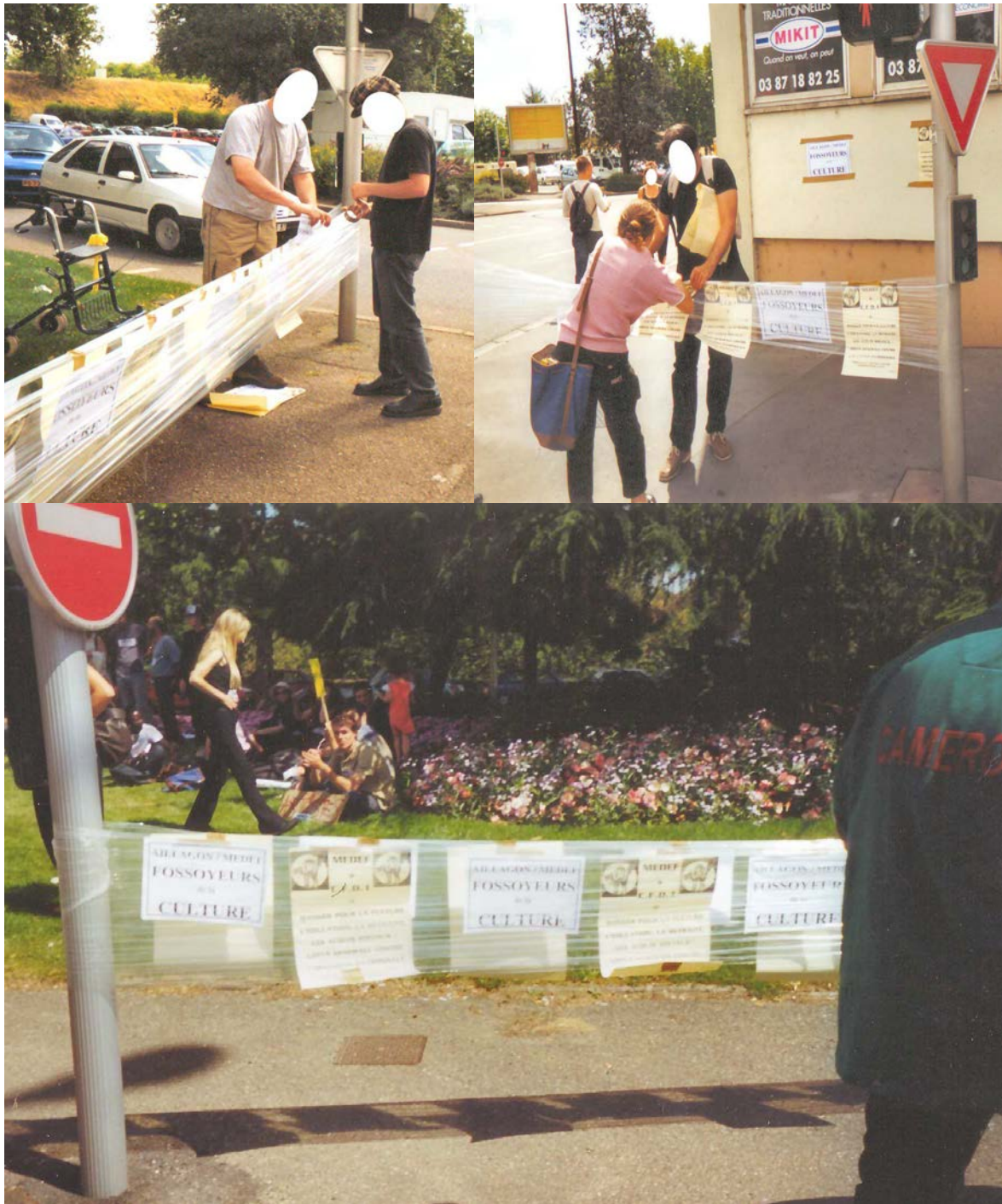
Photographies 9, 10 et 11 : Rassemblement du CIL devant les locaux messins du MEDEF, le 2 juillet 2003.

Ce type d'installation a également pu être observé dans plusieurs manifestations parisiennes de la CIP-IDF et lors de la mobilisation qui a accompagné le festival de Cannes. Une première fois, les manifestants se sont réunis sur le petit carrousel de la Croisette et l'ont encerclé de ruban adhésif ; la fois suivante, c'est directement un carrefour de la célèbre