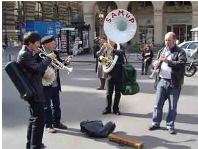
Photographie 5 : Fanfare du SAMUP. Rassemblement des intermittents devant le ministère de la Culture, 29 septembre 2005.

Parfois l'action n'est pas simplement la répétition d'une pratique exercée habituellement dans un contexte professionnel mais elle est préparée spécialement pour animer la manifestation. On retrouve alors les minutieuses préparations que l'on notait plus haut, de l'écriture des textes au souci de la mise en scène en passant par le choix des costumes.