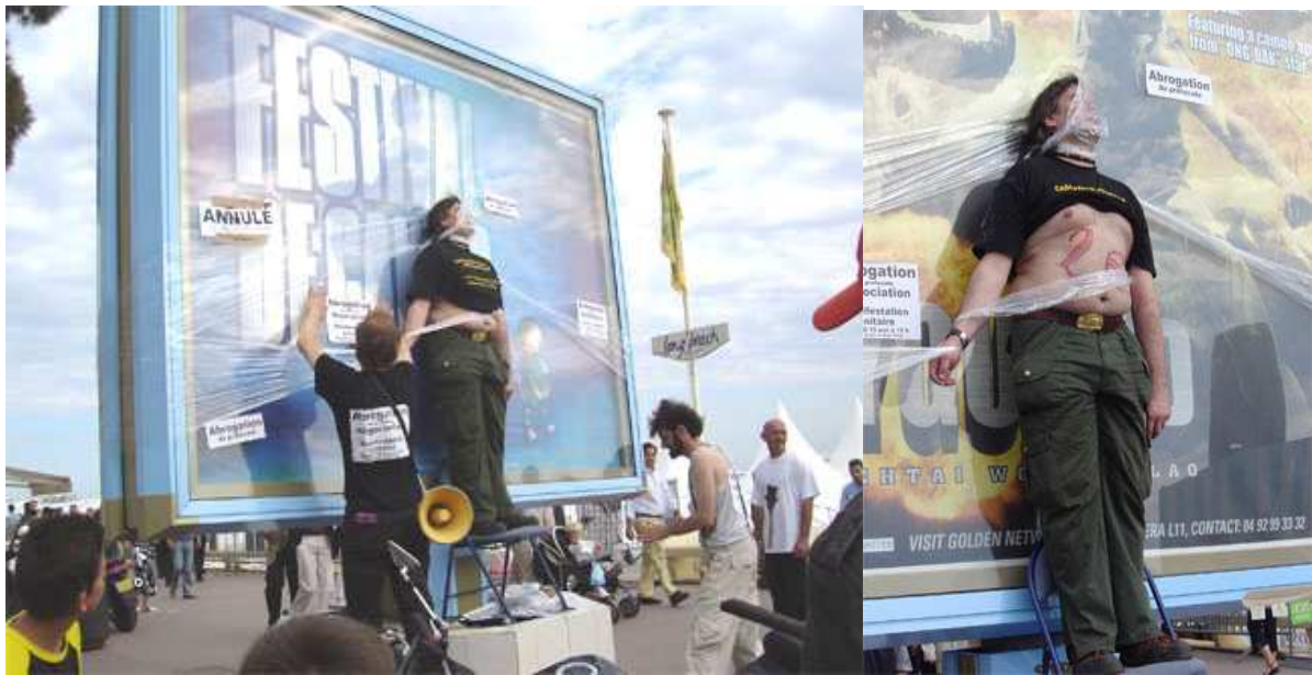
Photographies 2 et 3 : Performance militante sur la Croisette. Cannes, 20 mai 2004

être les victimes, à provoquer des émotions 67 telles que l'indignation, la compassion, l'empathie ou toute autre manifestation de soutien. Afin de capter l'attention, les mises en scène sont parfois « chocs », montrant des corps dénudés ou dans des postures qui rompent avec le décor habituel de la rue (Photographies 3 et 4).