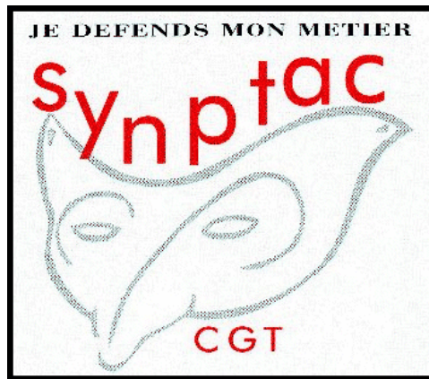
Illustration 3 : Affiche de la FNSAC-CGT « Nous voulons vivre de nos métiers »