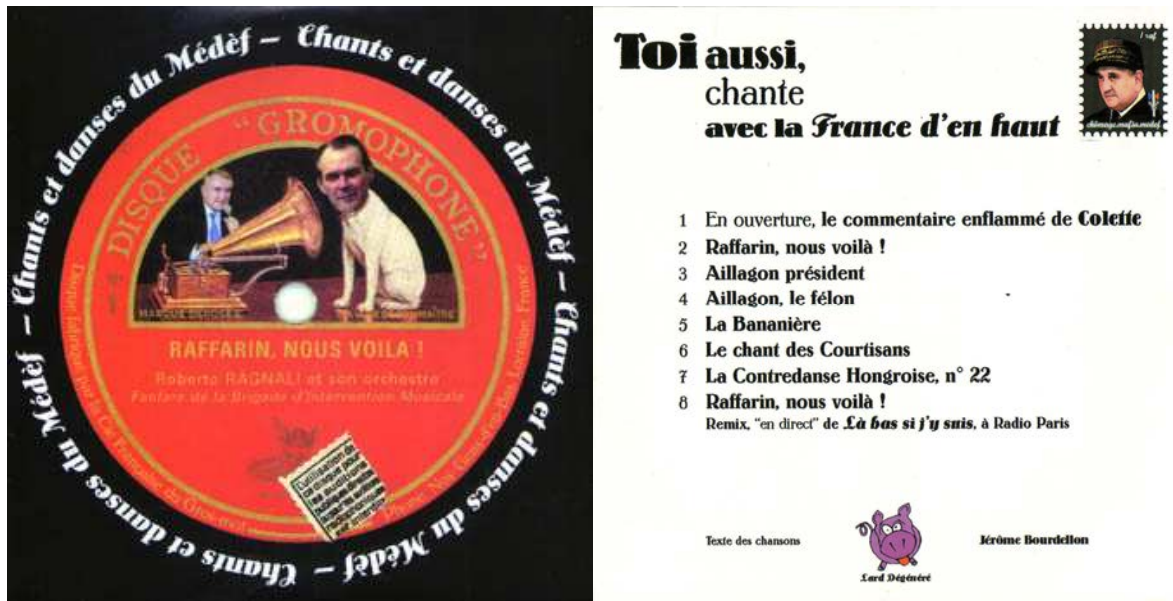
Illustration 4 : pochette du CD du CIL : « Chants et danses du MEDEF »

L'utilisation politique des savoirs professionnels ne s'arrête pas là. On peut ainsi observer des actions faisant appel aux compétences des « gens de théâtre » mais aussi des danseurs ou des professionnels de la vidéo 73 , chacun mettant son art au service de la cause qu'il défend. Mais pour se démarquer des modes d'action traditionnels, les intermittents ne se contentent pas d'essayer d'inventer de nouvelles formes, ils tentent également de s'appropriier ou de détourner des formes existantes.