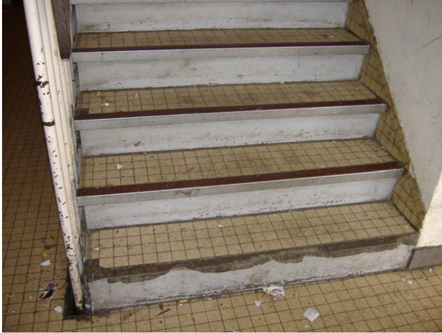
Vue du hall d'entrée voisinant du le hall précédent, situé dans la « Cour du Languedoc » à Metz Borny.

Les marqueurs centraux constitués de mégots et de papiers de cigarettes à rouler constituent l'essentiel des indices révélateurs d'une présence régulière de jeunes gens à cet endroit. En revanche, la photographie suivante illustre à quel point ce hall d'entrée est l'objet d'un réel investissement de la part de ceux qui se l'approprient tous les soirs.