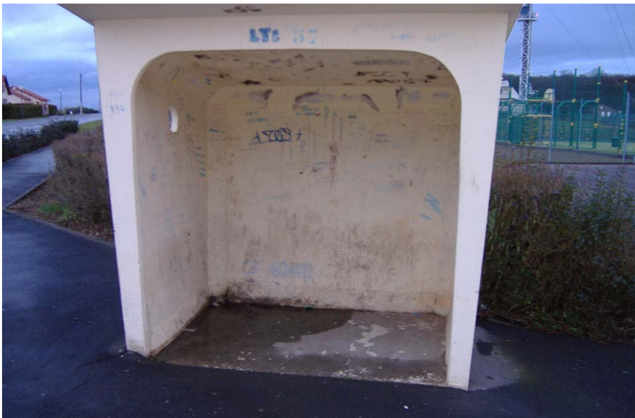
Vue de l'abribus de Luttange

montre, derrière l'abribus, l'existence d'un terrain « multi - sport » et au fond à gauche la fin du village. Cet abribus est essentiellement utilisé par les élèves scolarisés au Collège de Kédange sur Canner, le village suivant qui dispose d'un collège fréquenté par les jeunes « abribussiens » de Luttange.