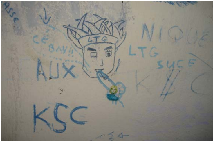
Vue grossie d'échanges à connotation sexuelle entre les « abribussiens » de Luttange et des jeunes gens de Kédange sur Canner, le village suivant.

Le visage couronné d'une coiffe avec des plumes, représente manifestement le symbole du groupe des « abribussiens » de Luttange. Des jeunes gens de Kédange sur Canner sont venus dessiner un sexe d'homme dans la bouche du symbole avec le slogan « LTG suce KSC ». En réponse, les « abribussiens » de Luttange ont inscrit « LTG fuck KSC », comme le montre la vue suivante, avec en plus un poing tendu avec le majeur redressé, symbole du « fuck » et une paire de fesses avec un sexe d'homme