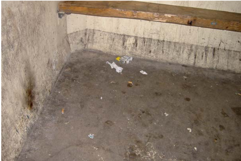
Vue du sol de l'abribus de Bettelainville

Parmi les marqueurs centraux, il faut ajouter les membres du groupe. Quand ils sont présents, ils constituent selon la terminologie d'Erving Goffman, un « groupe de plus d'un » perçus par les autres « comme étant ensemble 168 ».