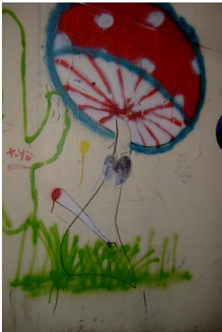
Vue de la paroi intérieure gauche de l'abribus de Bettelainville

point, voire dans un état second. Le champignon situé près de sa tête nous invite à nous référer à la représentation graphique de la paroi gauche de cet abribus. Il a manifestement consommé des produits psychotropes comme des champignons hallucinogènes ou fumé des joints de cannabis, comme le suggère la représentation graphique de la paroi intérieure gauche de l'abribus qui nous montre un champignon, de l'herbe et un « joint », l'herbe symbolisant la marijuana ou le cannabis, plante à partir de laquelle est extraite la résine cannabis ou haschich. Séchée ou sous la forme de résine, elle se fume mélangée à du tabac, le tout roulé dans le « joint » ou cigarette de forme conique.