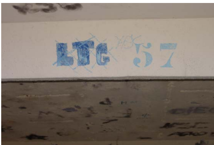
Vue agrandie du marquage de la poutre de l'abribus de Luttange

manifestement pas à dissuader les jeunes gens de s'approprier ce « micro » lieu. En regardant de plus près, nous constatons que les jeunes gens à l'origine de cette appropriation revendiquent outre sa possession, le fait de résider dans la commune de Luttange. Cette référence au territoire se traduit dans le marquage de ce « micro » lieu par les trois lettres « LTG 57 », qui est la réduction du nom du village avec de plus, la référence au département de la Moselle. A la différence des « abribussiens » de Bettelainville, cette référence est visible de l'extérieur, puisque dessinée sur l'extérieur de la poutre centrale de l'abribus.