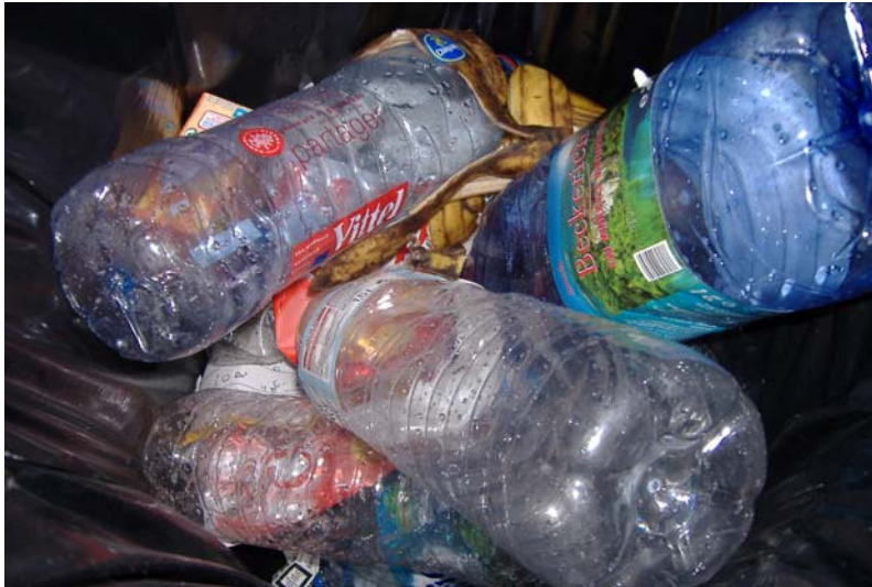
Vue du contenu de la poubelle de l'abribus de Bettelainville

Ce contenu montre que les « abribussiens » utilisent effectivement ce « micro » lieu pour se retrouver en dehors des heures de passage de l'autobus et partager des moments de convivialité. Effectivement, les contacts que nous avons avec l'un d'entre eux, nous le confirment.