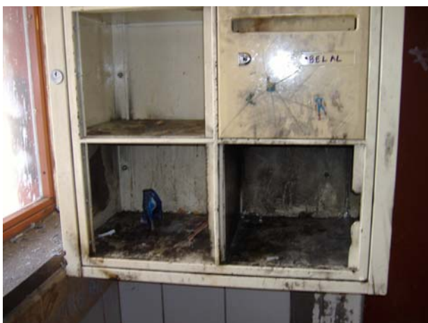
Vue des éléments vandalisés de boîte aux lettres de cette même entrée, utilisés comme cendrier.

Les marqueurs centraux constitués de mégots et de papiers de cigarettes à rouler constituent l'essentiel des indices révélateurs d'une présence régulière de jeunes gens à cet endroit. En revanche, la photographie suivante illustre à quel point ce hall d'entrée est l'objet d'un réel investissement de la part de ceux qui se l'approprient tous les soirs.