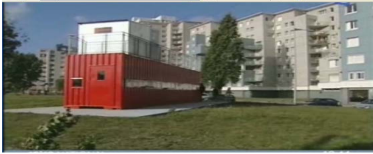
Vue extérieure de du « hall sans immeuble » de Graville - la - Vallée, quartier de la ville du Havre (vu à la télévision sur FR3, le 26.09.2007).