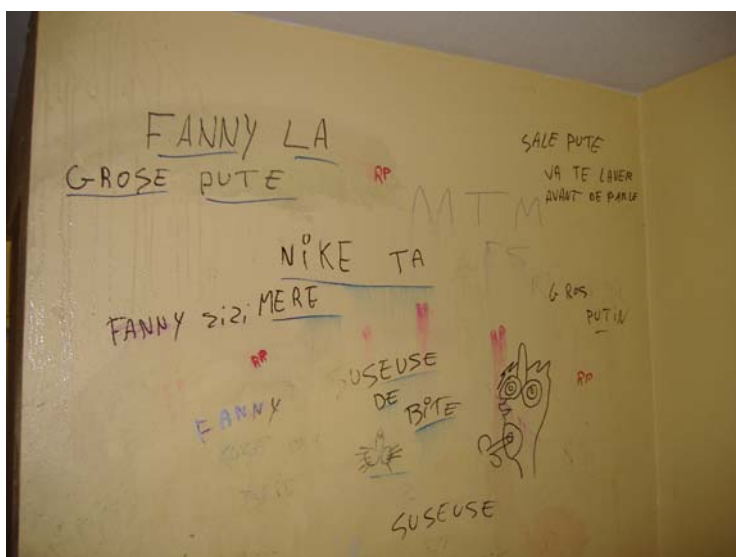
Vue du mur gauche situé face à la porte d'escalier débouchant sur le 3 ème étage.

A priori, rien ne nous indique qu'il soit approprié par un groupe de jeunes gens. Les « marqueurs signets » ciblent une seule personne que les jeunes gens du 8 ème étage insultent en utilisant des sobriquets à connotation sexuelle.