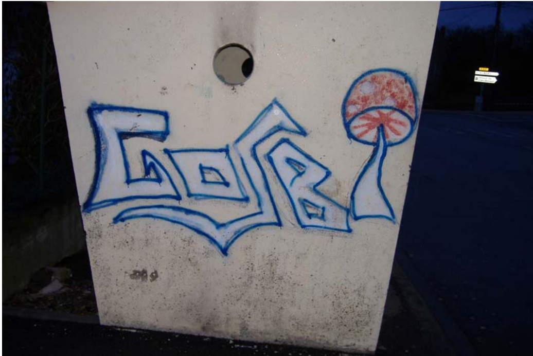
Vue de la paroi extérieure gauche de l'abribus de Bettelainville

Ces représentations graphiques sont bien évidemment traversées par des inscriptions qui sont des messages adressés à des tiers dont le sens ou les codes ne peuvent être compris que par ceux à qui ils sont adressés, ces tiers pouvant être des membres du groupe, d'autres jeunes gens, des représentants des forces de l'ordre ou d'une autre forme d'autorité, le Maire du village par exemple.