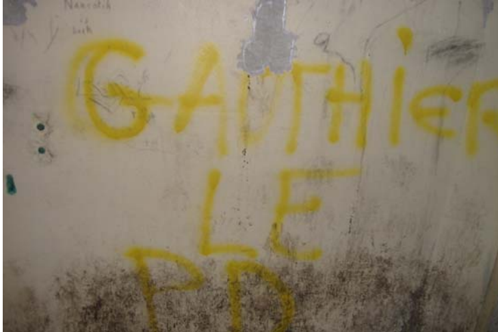
Vue de la paroi intérieure droite de l'abribus de Bettelainville

Effectivement, nous avons l'occasion de rencontrer Gauthier qui nous confirme cette hypothèse, mais qui ne nous informe pas des raisons de cette rupture. Nous ne cherchons pas à ce moment là, à en savoir plus, respectant le silence de notre interlocuteur sur cette rupture.