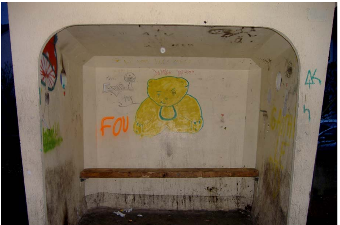
Vue de l'abribus de Bettelainville (57).

Prenons l'exemple de cet abribus. Il se situe à la sortie du village mosellan de Bettelainville qui compte 598 habitants. Les premières maisons ne sont qu'à quelques mètres de celui-ci.