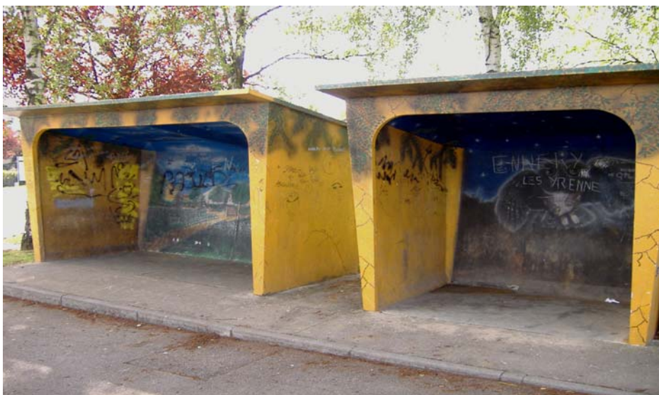
Abribus d'Ay sur Moselle, commune de 525 habitants, située sur la rive droite de la Moselle entre Metz et Thionville.

Le cas de la commune d'Ay sur Moselle (525 habitants) est emblématique de ce type de démarche. Ses deux abribus sont conformes à cette tendance observée dans ces communes rurales, soucieuses de trouver le bon compromis, entre les « ayant droits » potentiels que sont les usagers des transports publics (élèves et parents d'élèves) qui se plaignent de l'état de délabrement dans lequel se trouve chaque matin l'abribus, les jeunes gens à l'origine du phénomène d'appropriation, qui sont aussi des usagers des transports publics, sans oublier les passants et les résidents qui habitent à proximité de ce « micro lieu ».