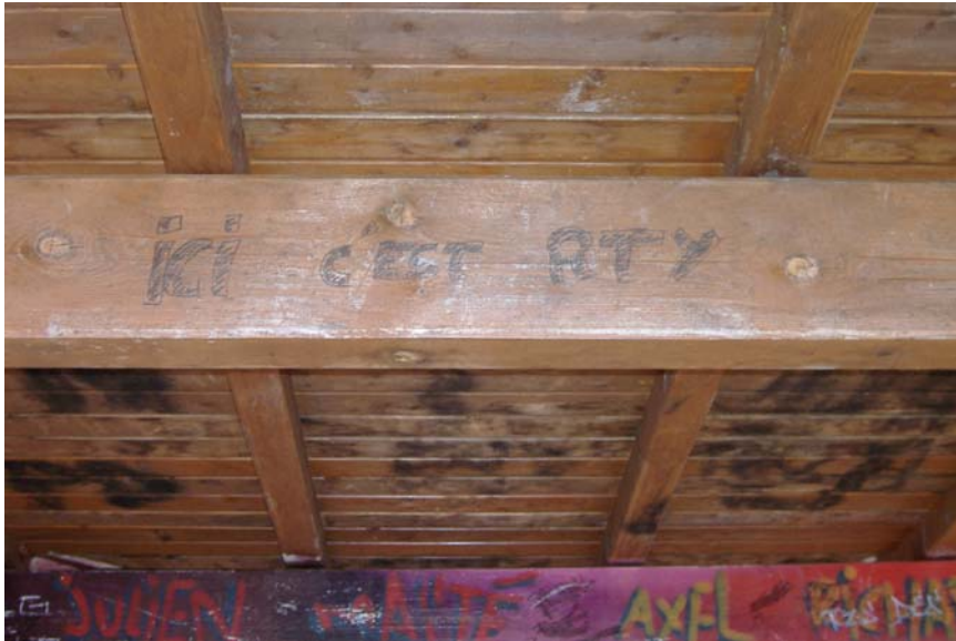
Vue grossie de la poutre située au dessus de l'entrée.

« Ici c'est RTY » signifie clairement que les jeunes gens qui ont inscrit cette information, revendiquent ce « micro » lieu comme une possession, tout en valorisant le fait qu'il résident dans la commune de Retonfey, « RTY » étant le diminutif du nom de cette commune. Le prénom des auteurs du travail de restauration se situe sur la poutre arrière. Les inscriptions nouvelles qui recouvrent ce premier travail esthétique sont bien le fait d'une autre génération de jeunes gens. Comme pour l'abribus de Luttange, nous essayons de comprendre pourquoi ce souci de revendiquer son appartenance territoriale. Il s'agit bien comme la précédente situation, de la nécessité de se démarquer d'autres jeunes gens venant d'un autre endroit. En y regardant de plus près, nous constatons que cette hypothèse est plausible, au vu de certaines inscriptions.