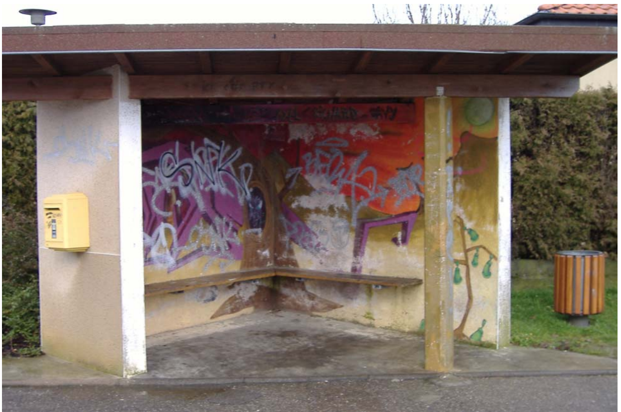
Vue de l'abribus de la commune de Retonfey.

La vue suivante montre un des abribus de la commune de Retonfey qui compte 1372 habitants. Il est situé à l'une des sorties de la commune et à la périphérie d'un ensemble pavillonnaire. Ce « micro » lieu a fait l'objet d'un premier travail de relooking , à l'initiative de la mairie, avec le soutien d'une première génération d'« abribussiens » qui s'y retrouvaient déjà régulièrement. Cependant, des inscriptions sont venues ternir ce travail. Une seconde génération d'« abribussiens » a pris le relais en imposant ses marques.