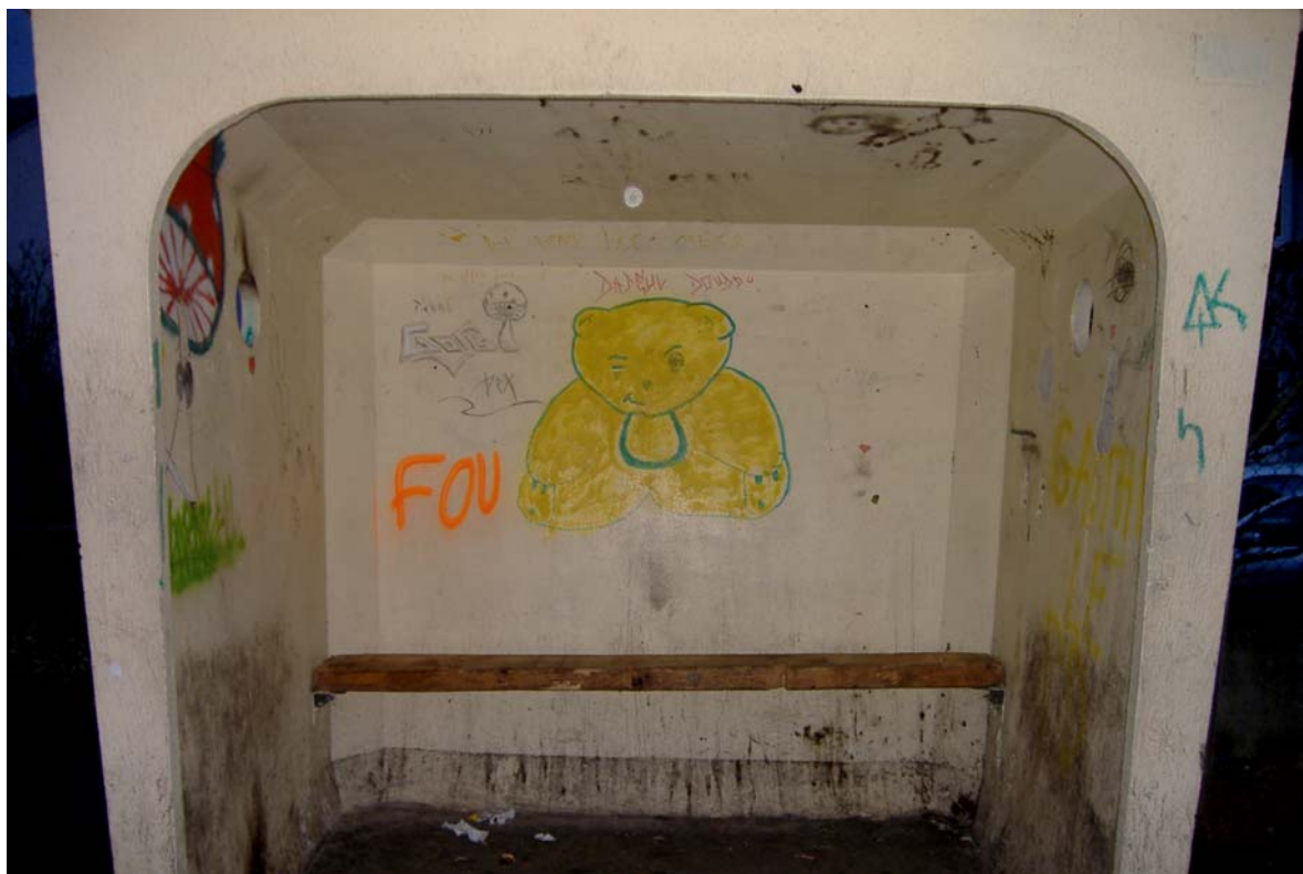
Vue de l'abribus de Bettelainville (57).

Prenons l'exemple de cet abribus. Il se situe à la sortie du village mosellan de Bettelainville qui compte 598 habitants. Les premières maisons ne sont qu'à quelques mètres de celui-ci.