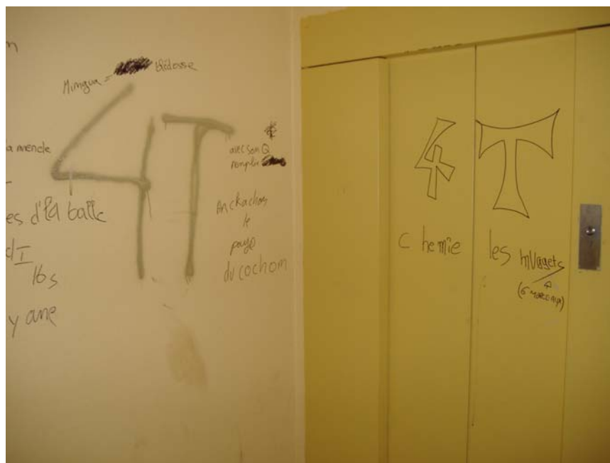
Vue des murs du palier du 8 ème étage d'une des tours de l'îlot « Des 4 tours ».

Poursuivant nos investigations, nous prenons la direction de l'îlot « des 4 tours », toujours à Metz Borny. En chemin, des agents d'entretien nous indiquent l'existence de deux paliers fortement dégradés d'une des tours : le 3 ème et le 8 ème étage. Nous prenons l'ascenseur pour nous rendre au 8 ème étage, avec le risque de nous retrouver face à face avec les jeunes gens à l'origine de cette appropriation.