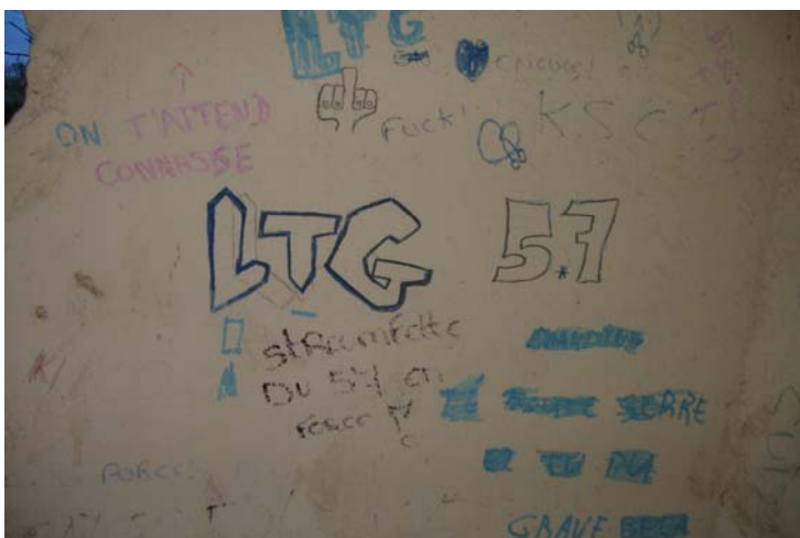
Vue grossie d'échanges à connotation sexuelle entre les « abribussiens » de Luttange et des jeunes gens de Kédange sur Canner, le village suivant.

Le visage couronné d'une coiffe avec des plumes, représente manifestement le symbole du groupe des « abribussiens » de Luttange. Des jeunes gens de Kédange sur Canner sont venus dessiner un sexe d'homme dans la bouche du symbole avec le slogan « LTG suce KSC ». En réponse, les « abribussiens » de Luttange ont inscrit « LTG fuck KSC », comme le montre la vue suivante, avec en plus un poing tendu avec le majeur redressé, symbole du « fuck » et une paire de fesses avec un sexe d'homme