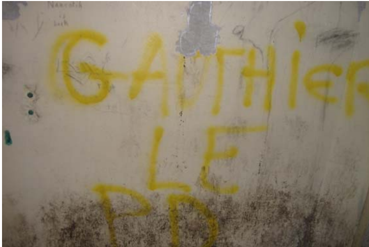
Vue de la paroi intérieure droite de l'abribus de Bettelainville

Effectivement, nous avons l'occasion de rencontrer Gauthier qui nous confirme cette hypothèse, mais qui ne nous informe pas des raisons de cette rupture. Nous ne cherchons pas à ce moment là, à en savoir plus, respectant le silence de notre interlocuteur sur cette rupture.