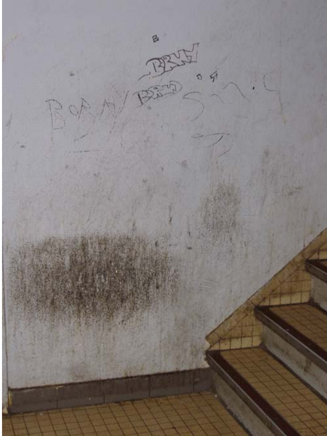
Vue de la première cage d'escalier d'un hall d'entrée situé dans la « Cour du Languedoc » du quartier de Metz Borny.

Nous ne constatons que l'existence de « marqueurs signets » témoignant de la présence régulière de jeunes gens tous les soirs à cet endroit, les traces de semelle de chaussure à environ 50 centimètres du sol attestant de la station debout, dos au mur avec un genou fléchi et le pied contre le mur, d'une partie des membres du groupe. La référence au quartier est inscrite sur le mur, « Borny ». La photographie est prise après le récent passage d'un agent d'entretien, ce qui explique la propreté du sol, ce qui n'est pas le cas de la photographie suivante, prise au pied de la cage d'escalier voisine de celle-ci, les deux halls étant communicants de l'intérieur.