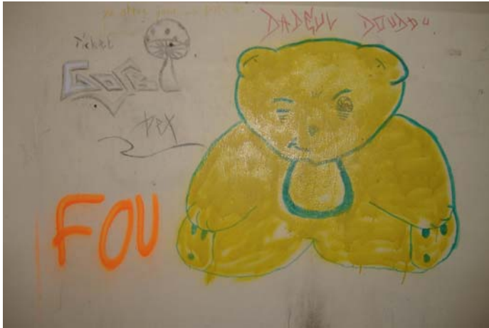
Vue de la reproduction du nounours de l'abribus de Bettelainville.