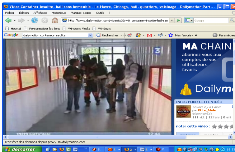
Vue intérieure du « hall sans immeuble » de Graville - la - Vallée, quartier de la ville du Havre (vu à la télévision sur FR3, le 26.09.2007).

Récemment développée par la Ville et l'OPHLM (Alcéane) du Havre elle est présentée à la télévision et dans la presse écrite, puis diffusée sur le réseau Internet 319 , comme une expérience cherchant à établir si les jeunes gens qui s'approprient habituellement les halls d'entrée du quartier de Graville - la -Vallée où logent 1 500 habitants, vont s'approprier ce faux hall , et laisser les véritables halls libres d'accès. Il s'agit d'un container de 12 mètres de longueur, de couleur rouge, aménagé en hall d'entrée et placé au centre de la cité, à une trentaine de mètres d'un immeuble de plus de 400 logements, au vu et au su de tous les résidents, avec toutes ses caractéristiques, à savoir : portes vitrées avec digicode, boîtes aux lettres, fausses