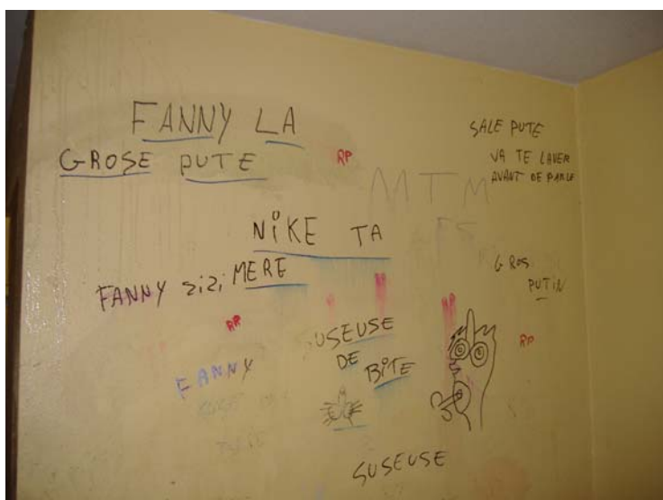
Vue du mur gauche situé face à la porte d'escalier débouchant sur le 3 ème étage.

A priori, rien ne nous indique qu'il soit approprié par un groupe de jeunes gens. Les « marqueurs signets » ciblent une seule personne que les jeunes gens du 8 ème étage insultent en utilisant des sobriquets à connotation sexuelle.