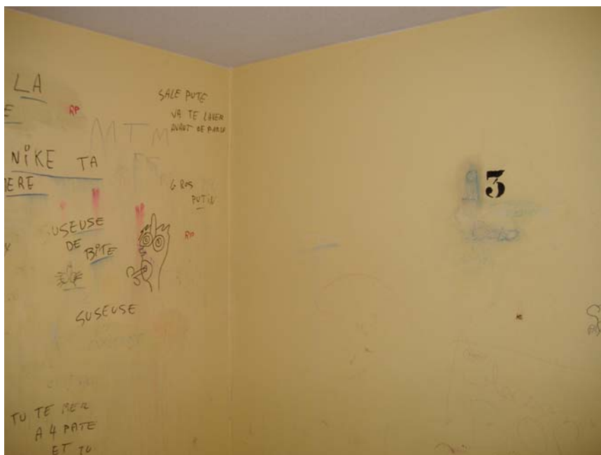
Vue du palier du 3 ème étage d'une des tours de l'îlot « Des 4 tours ».

A priori, rien ne nous indique qu'il soit approprié par un groupe de jeunes gens. Les « marqueurs signets » ciblent une seule personne que les jeunes gens du 8 ème étage insultent en utilisant des sobriquets à connotation sexuelle.