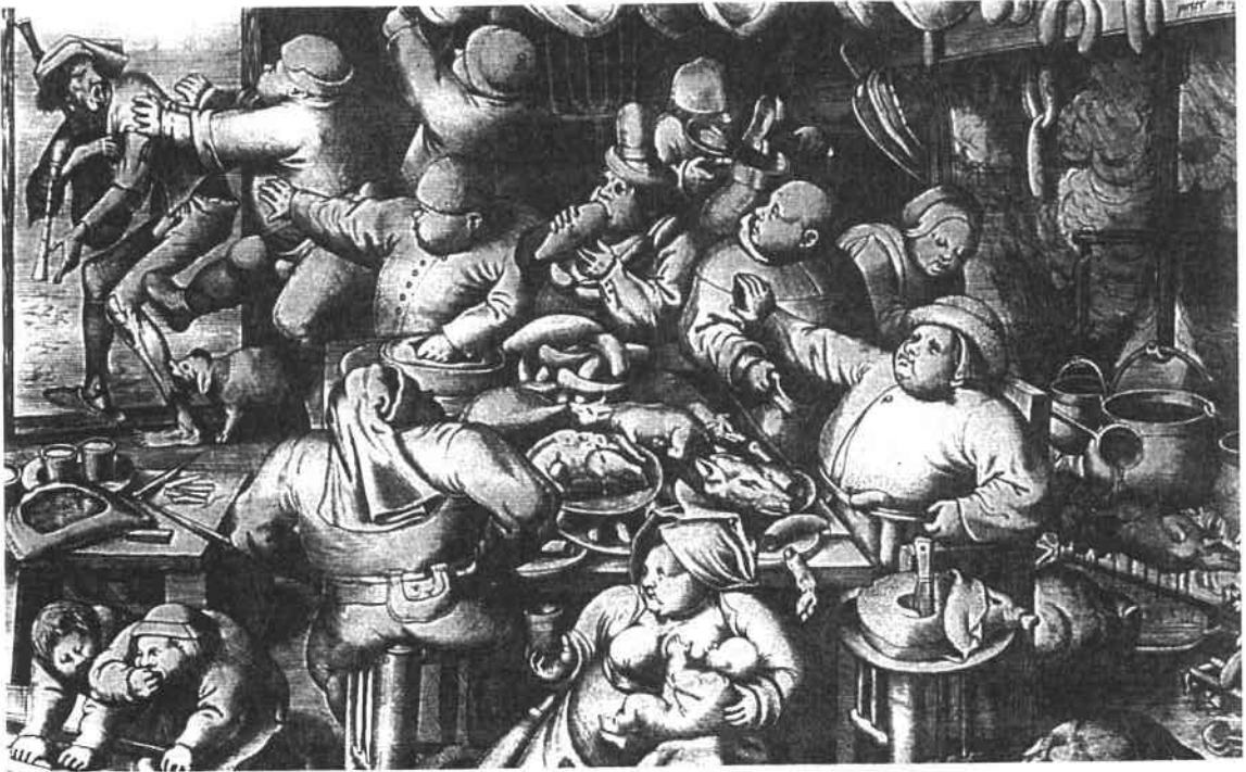
La Cuisine grasse