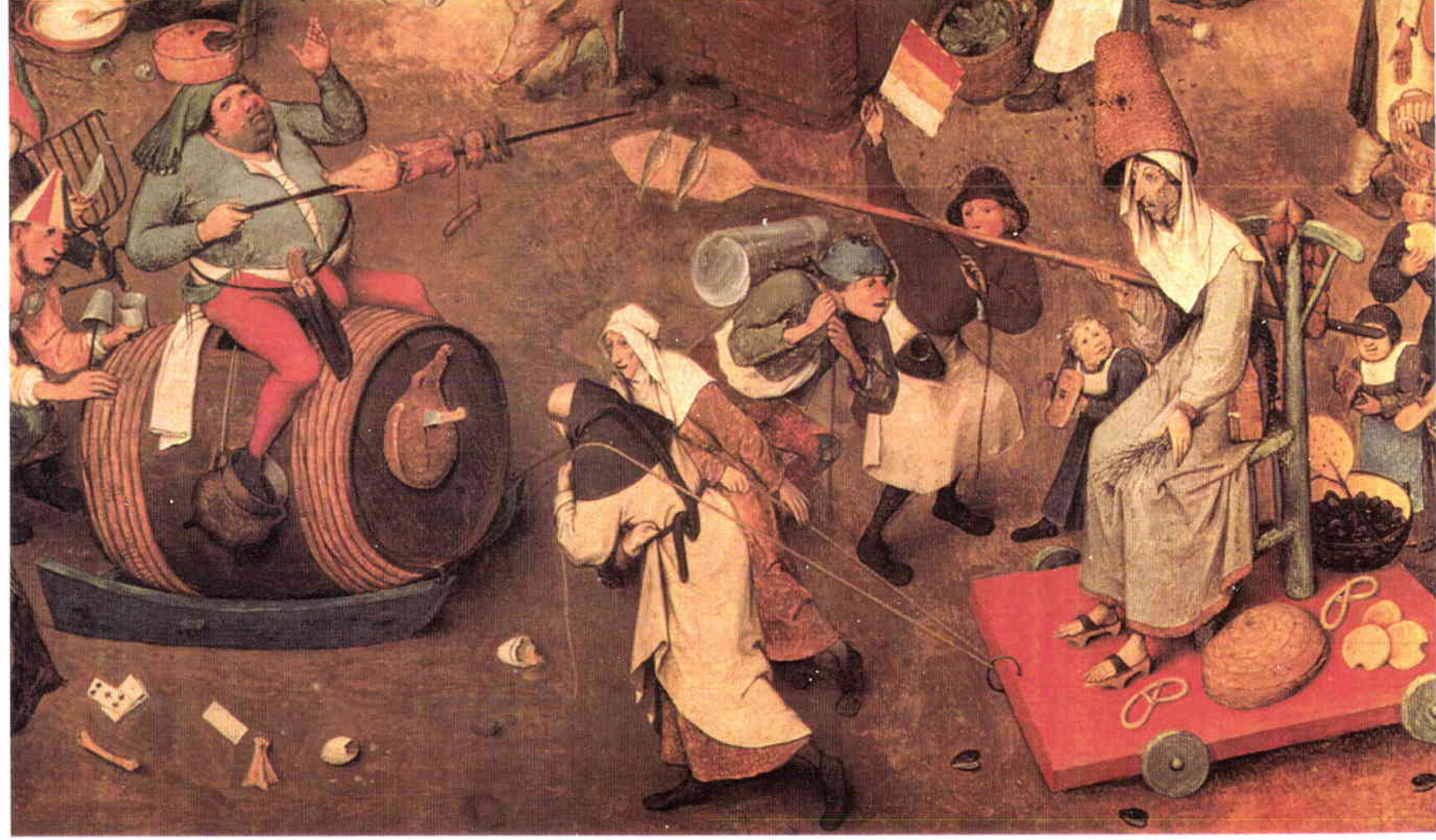
Bruegel l'Ancien. Le Combat de Carnaval et de Carême (détail), 1559 Bois, 113 X 164 cm. Vienne. Kunsthistorisches Museum.