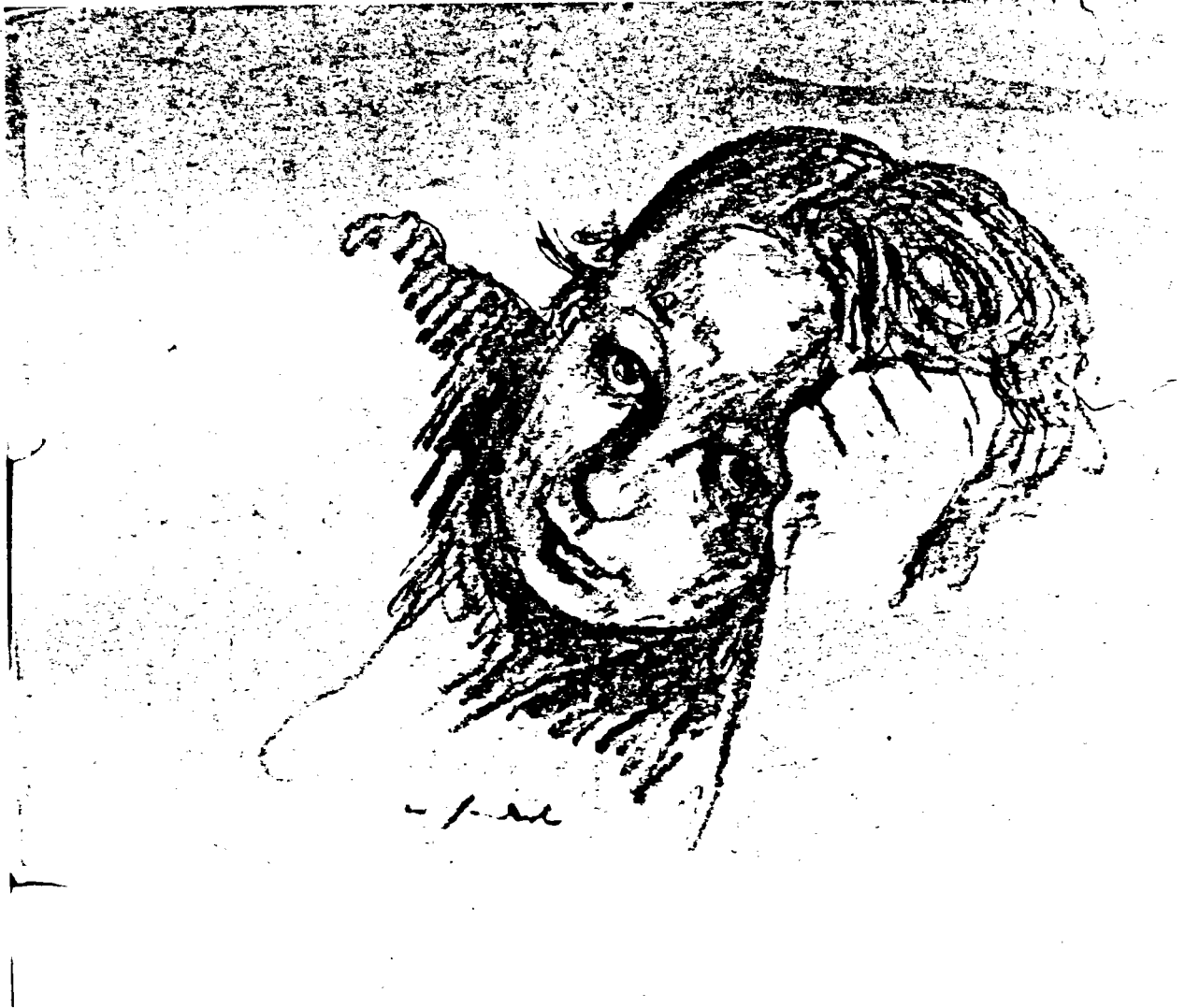
IRMGARD KEUN par Willi Jäckel