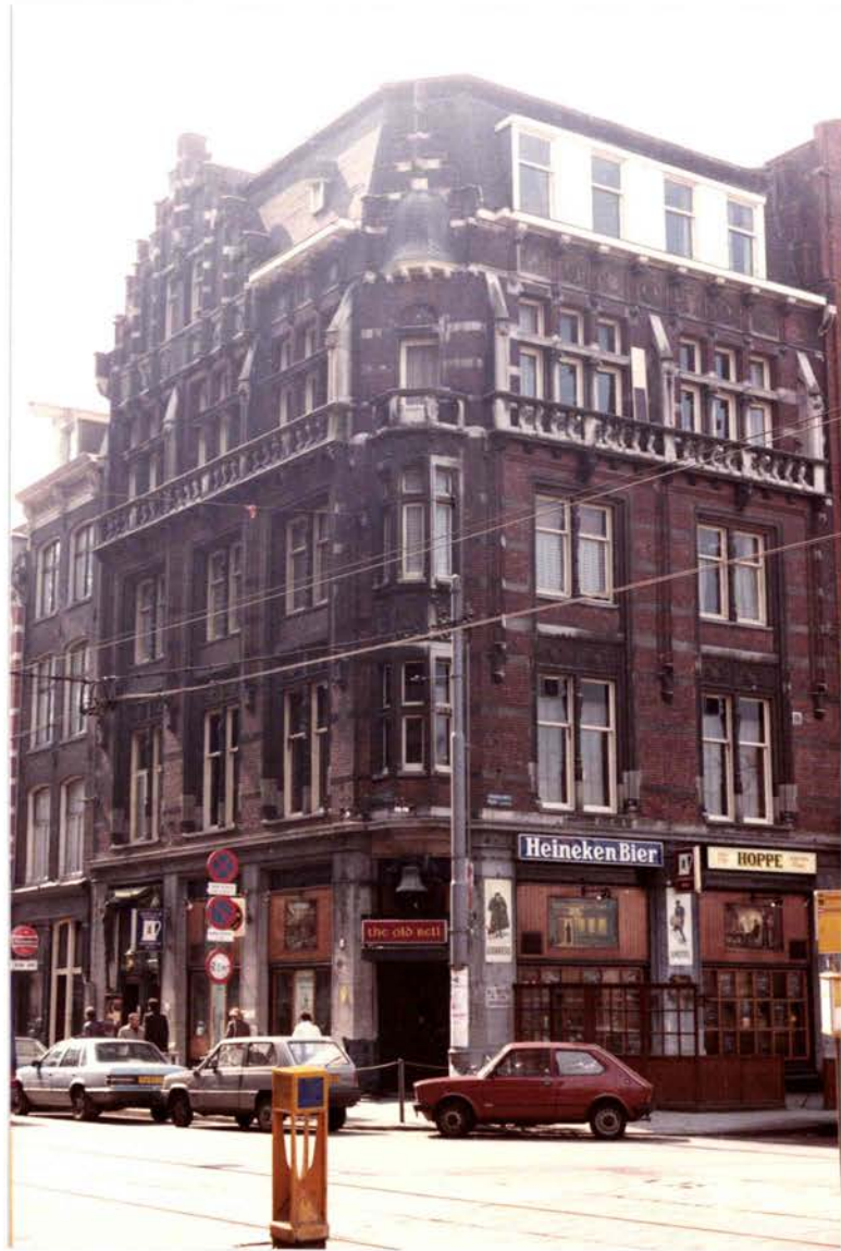
L'immeuble de l'ancien Hôtel City sur la place Rembrandt (1982)