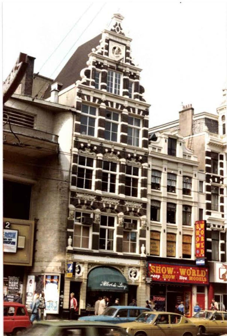
La maison d'édition Allert de Lange sur le Damrak à Amsterdam (1982)