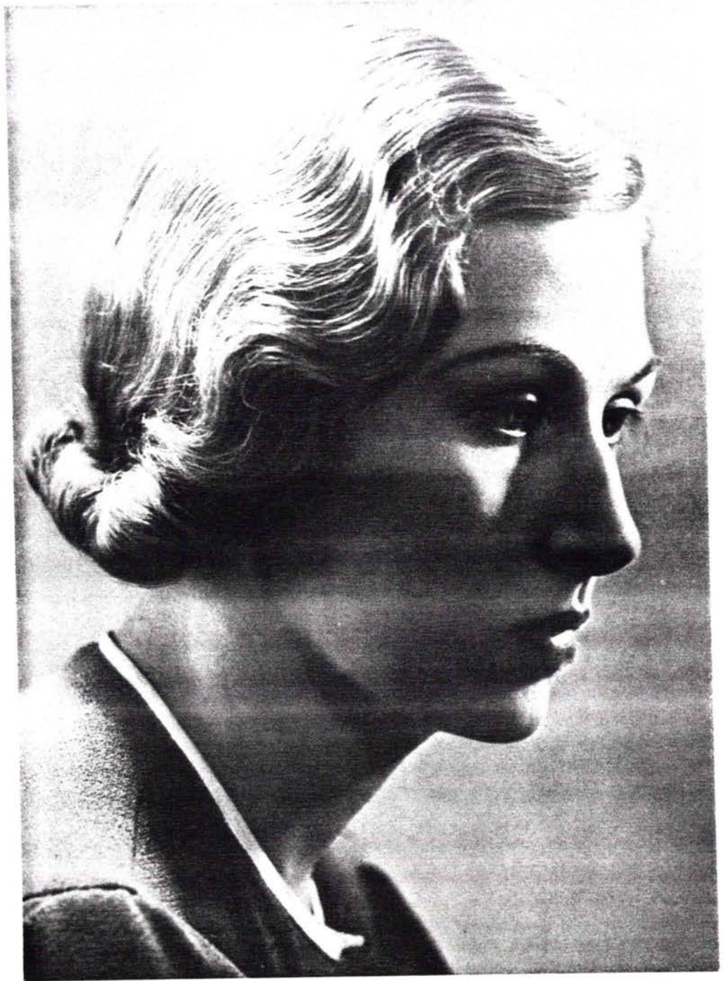
Das junge Mädchen unserer Tage

La jeune fille de notre époque (photo 1938)