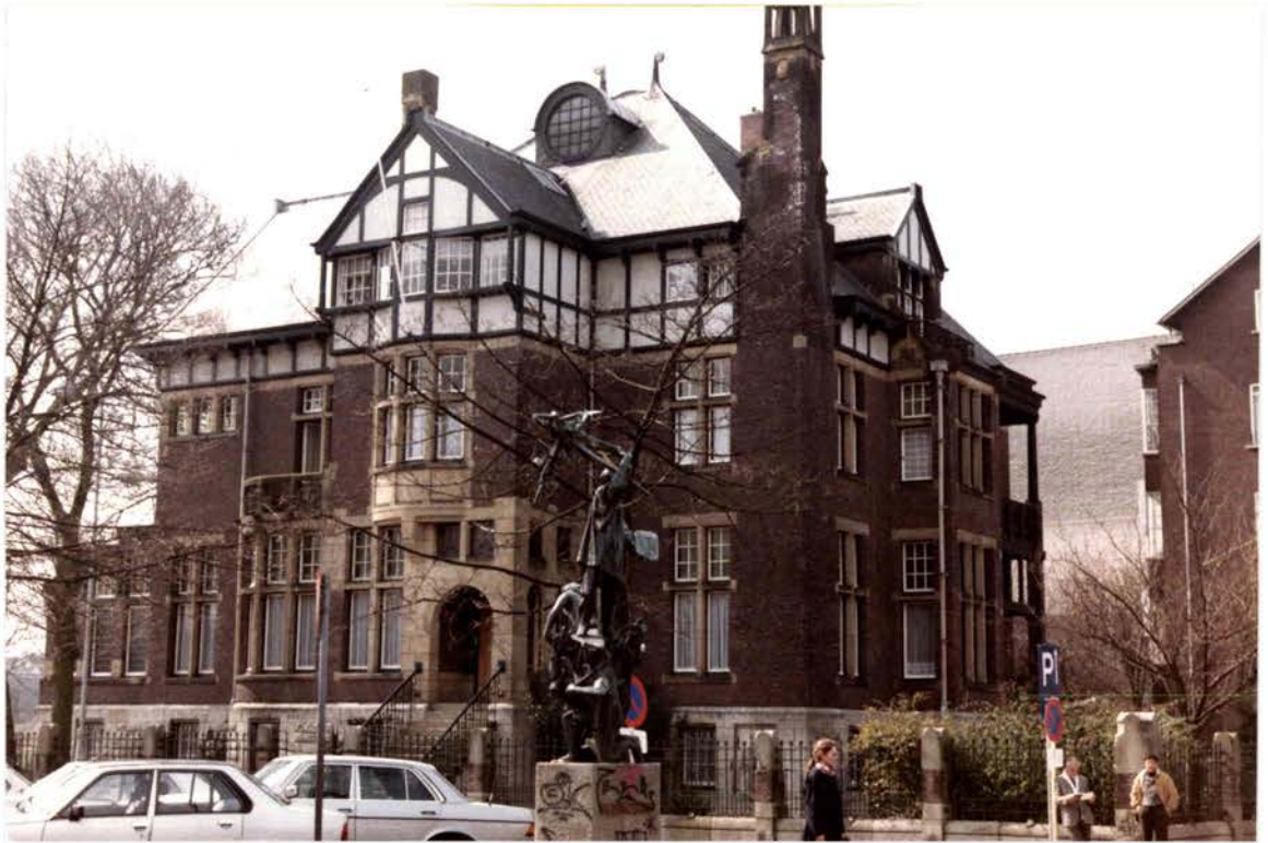
La pension de la Honthorststraat (1982)