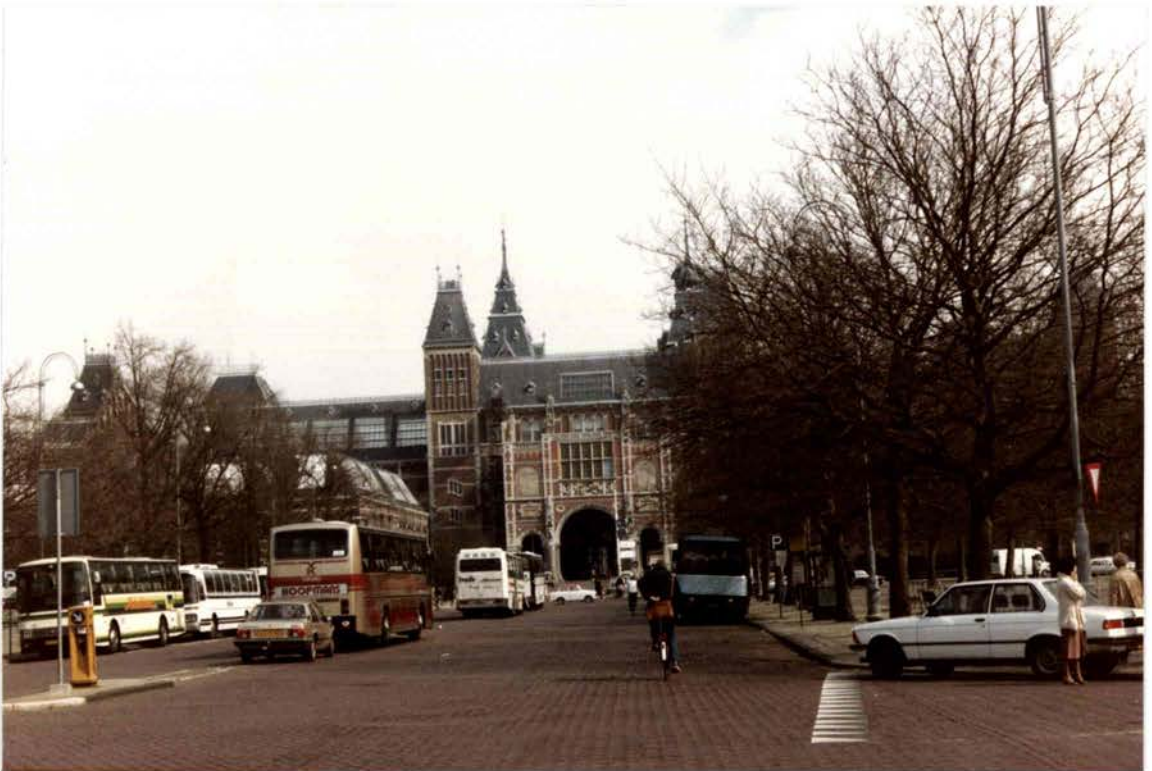
Le Rijksmuseum à Amsterdam (1982)