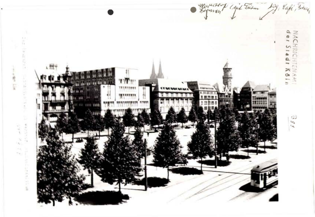
La place du Neumarkt en 1939