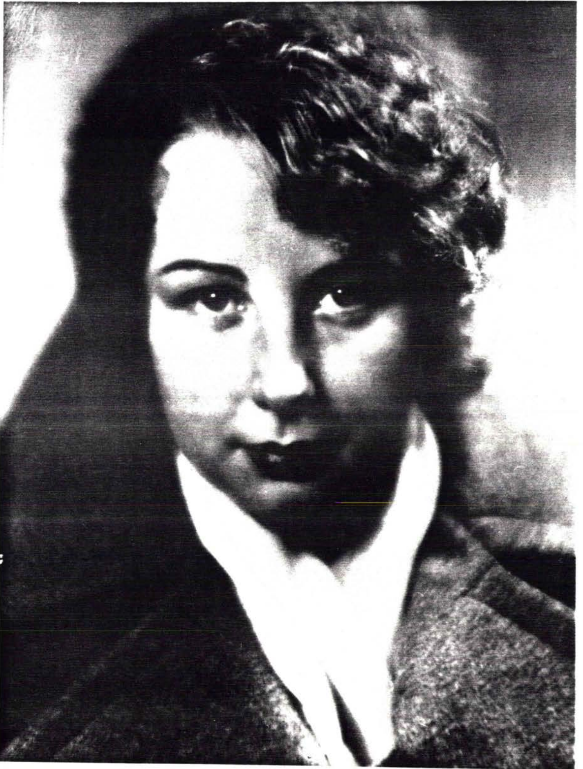
IRMGARD KEUN