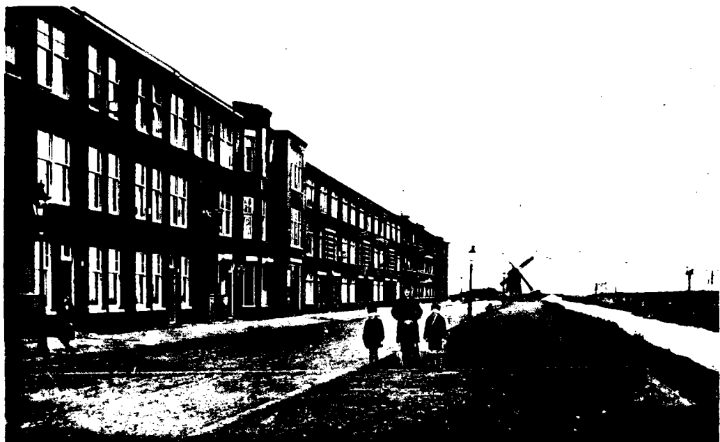
DEN HAAG. Schenkkade met Molen

La Haye fin des années trente: les faubourgs derrière la gare