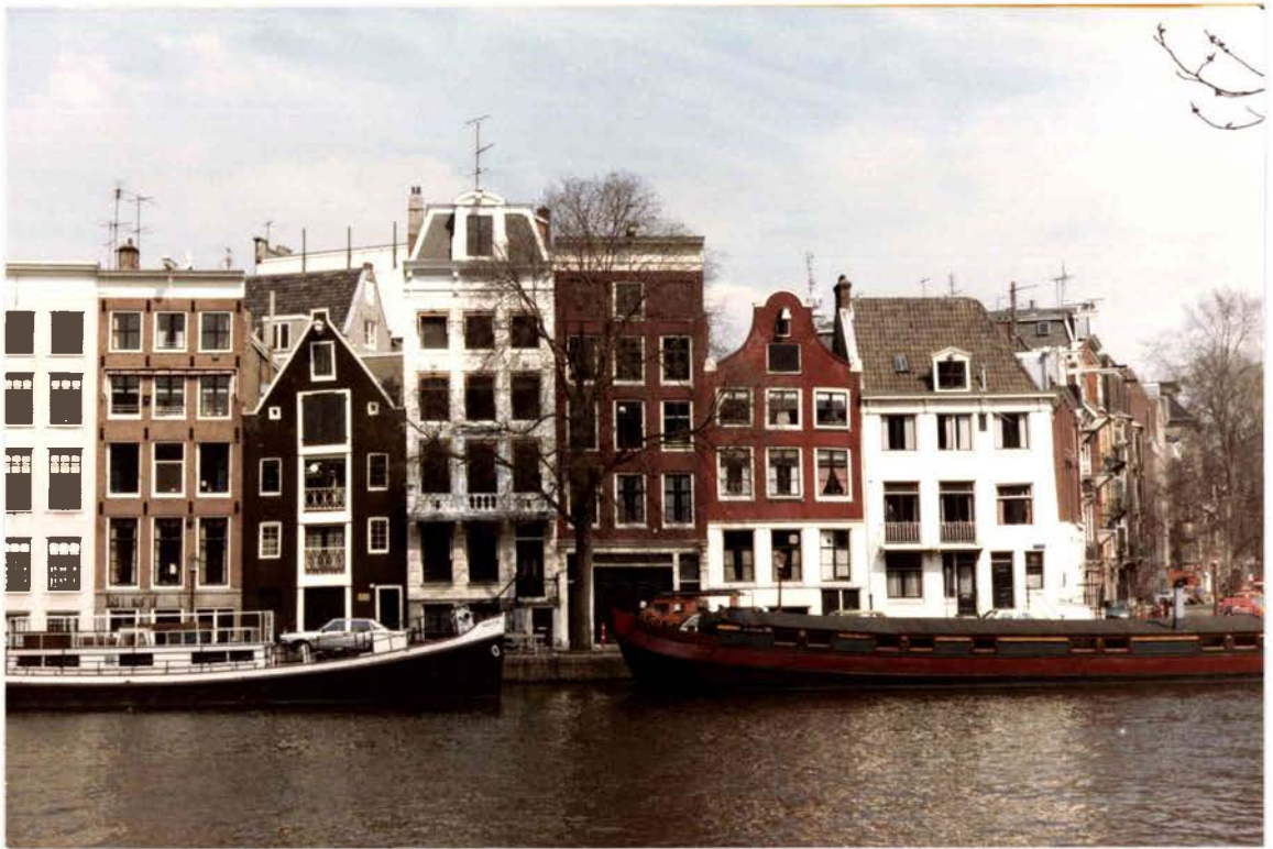
L'Amstel vu de l'Hôtel Eden (1982)