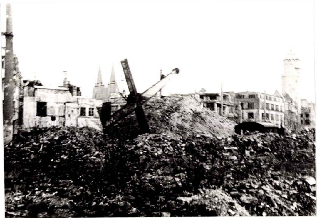
La place du Neumarkt en 1945