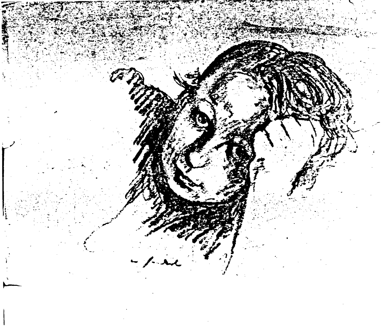
IRMGARD KEUN par Willi Jäckel