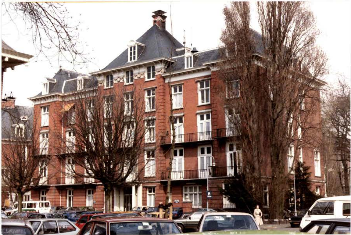
La clinique Boerhaave (1982)