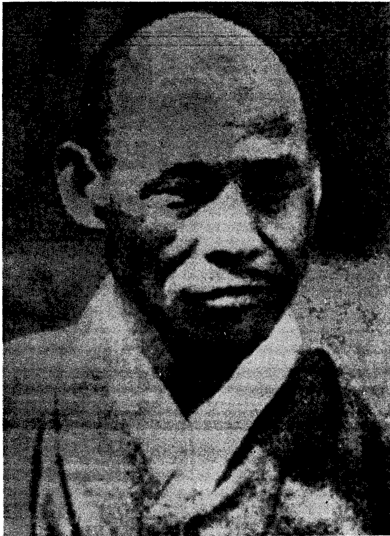
Portrait de Han Yong-un