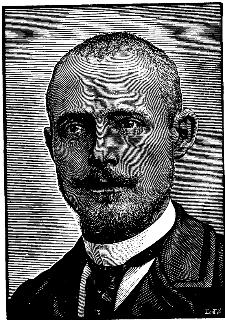
Portrait de Péguy gravé par Louis-Joseph Soulas