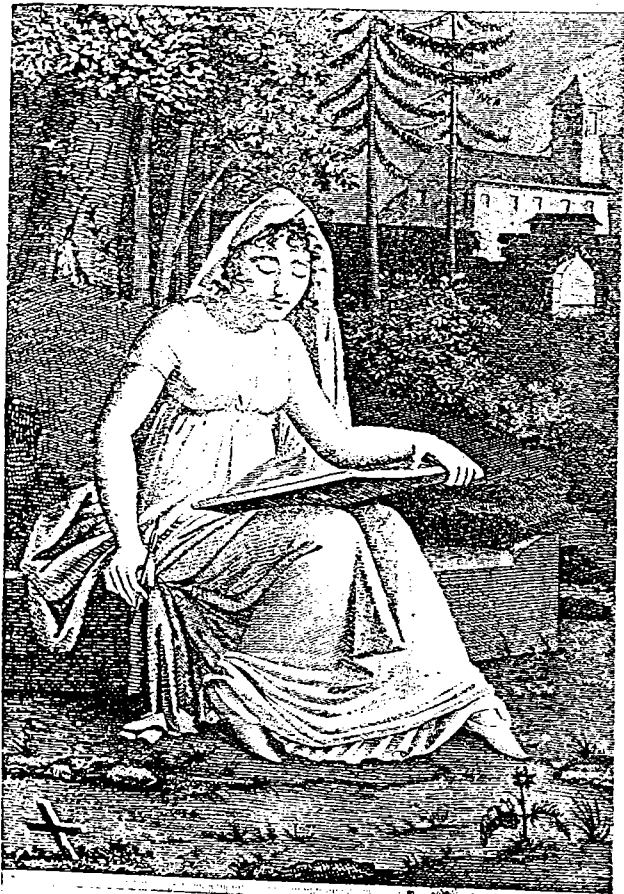
C'est Estival, assise sur une "Combe"