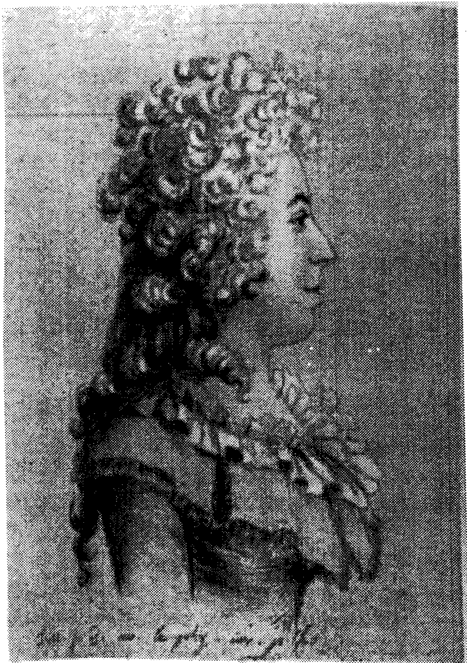
MADAME DE STAEL, d'après un portrait exécuté en 1789 (B. N., Cabinet des Estampes)