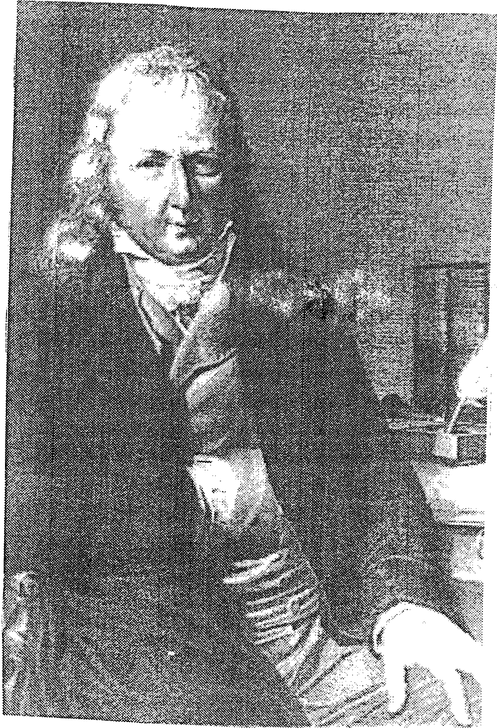
Bernardin de Saint-Pierre...