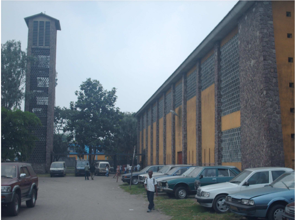
Façade et entrée latérales sud de l'Eglise Saint Alphonse de Matete (Kinshasa) Photo Coll. privée 2008.