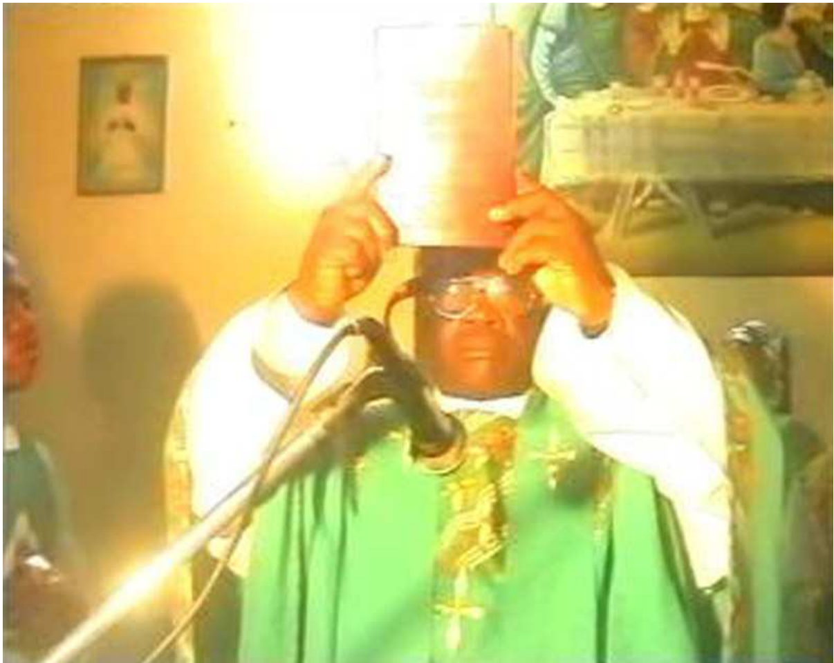
L'intronisation du Livre avant la procession de l'Évangile