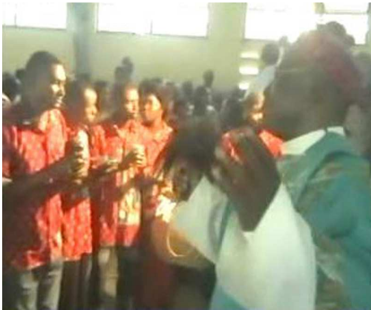
La fin de la procession des offrandes, le prêtre en liesse avec les fidèles, attend de recevoir les offrandes amenées et présentées par les CEVB