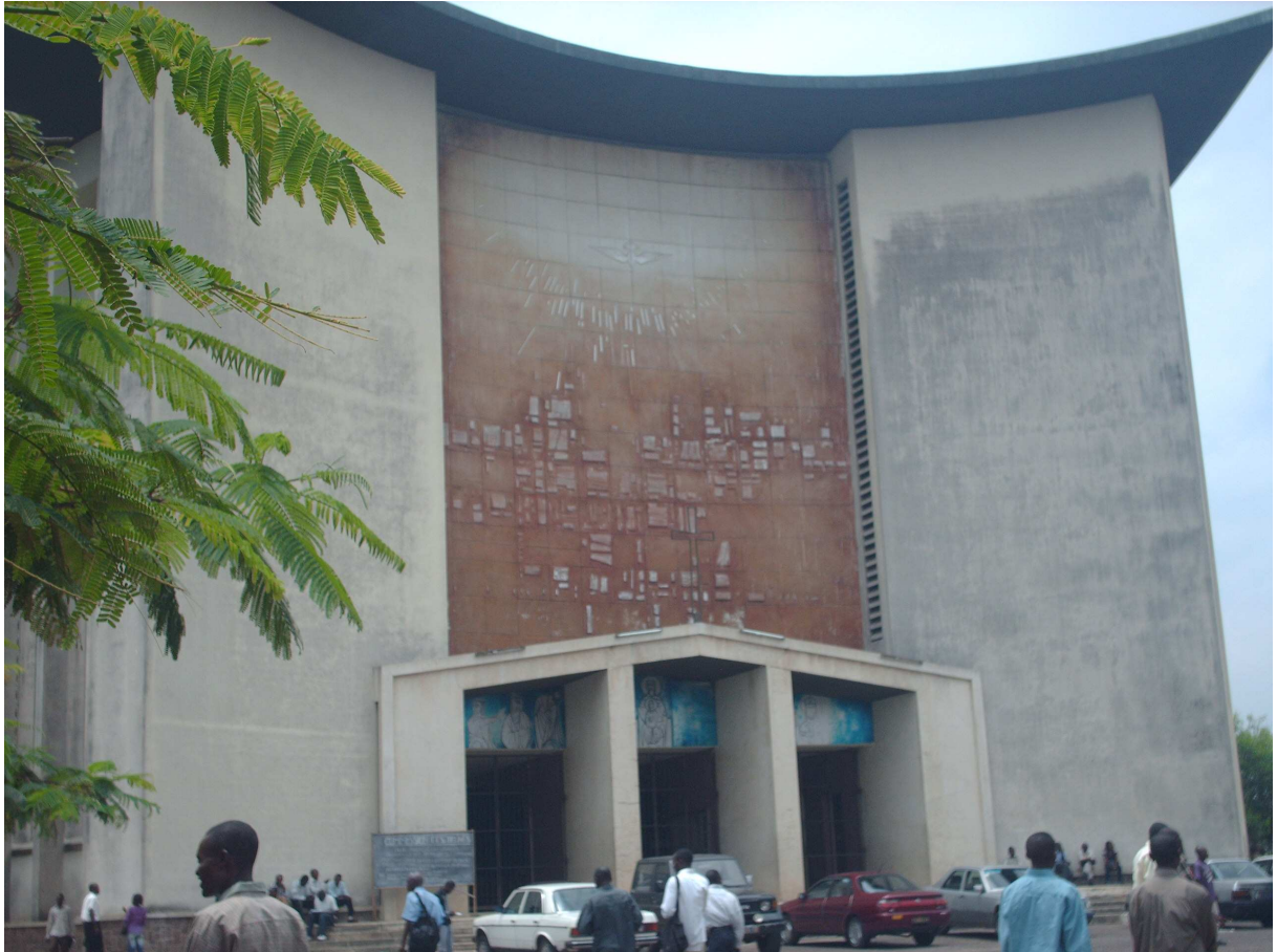
Eglise de la paroisse universitaire Notre-Dame de la Sagesse (Université de Kinshasa), construite à l'époque où l'université était l'université catholique de Lovanium ; en forme de poisson (ou de bateau), sa construction eut lieu dans les années 1953-1955.