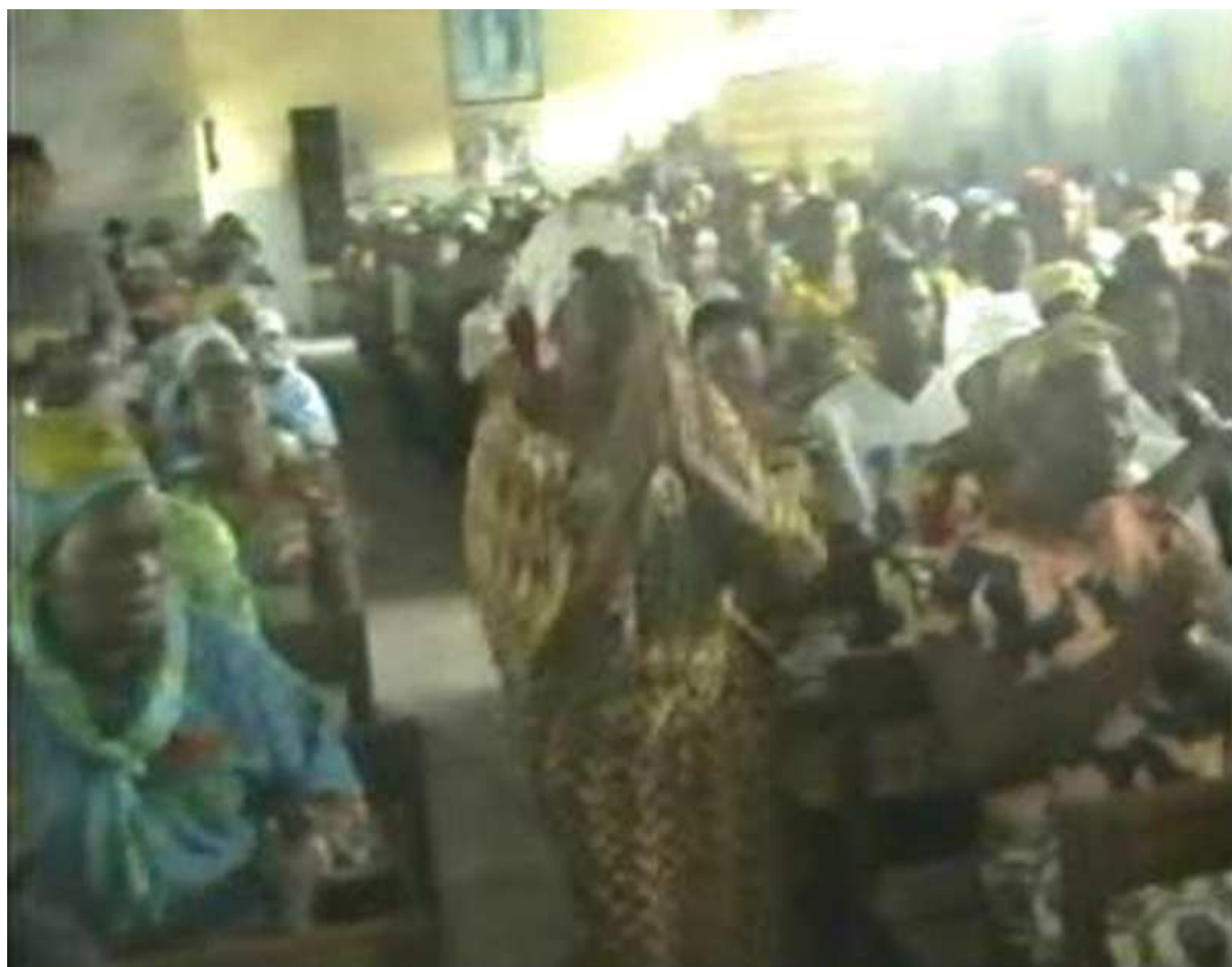
Une fidèle, comme d'autres, n'hésite pas à continuer des cris de joie et de louange peu avant l'Offertoire