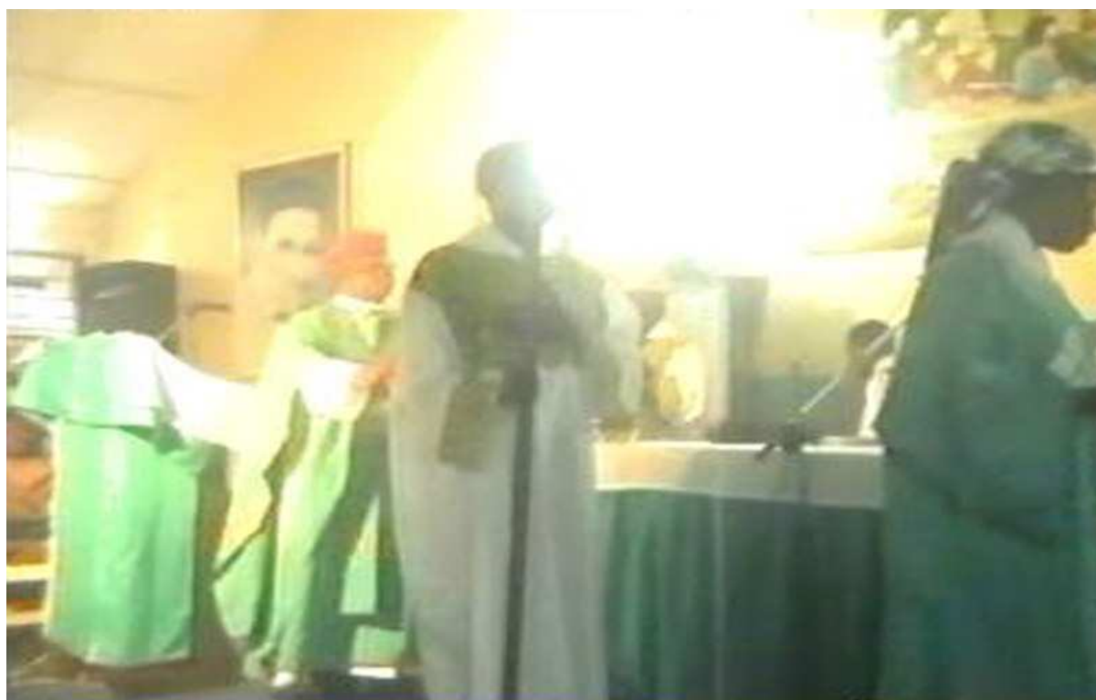
La danse autour de l'autel pendant l'exécution du Gloria ; on aperçoit des acolytes dansant tenant une lance