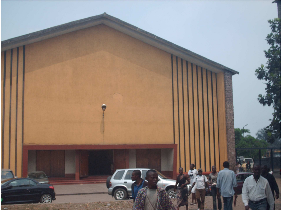
Façade et entrée principales (ouest) de l'Eglise Saint Alphonse de Matete (Kinshasa), où fut organisée la première célébration eucharistique selon le rite zaïrois de la Messe après son approbation, le 27 mai 1988. 2008.