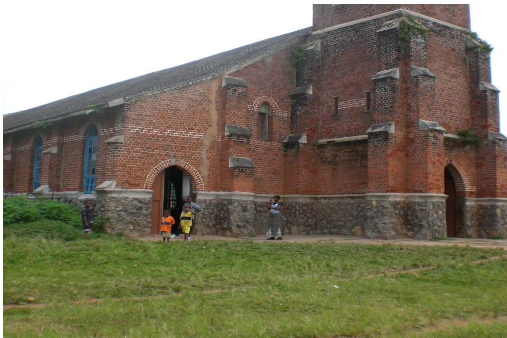
Vues de l'église de Demba Kapinga-Ngombe, St Jean-Baptiste, paroisse fondée en 1907, construction achevée en 1915, fruit de la coopération entre Scheut et la CK ; l'église fut agrandie dans le milieu des années 1950.