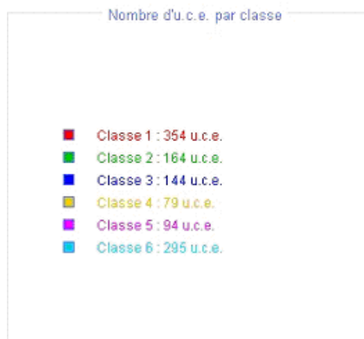
Schéma n° 1 :