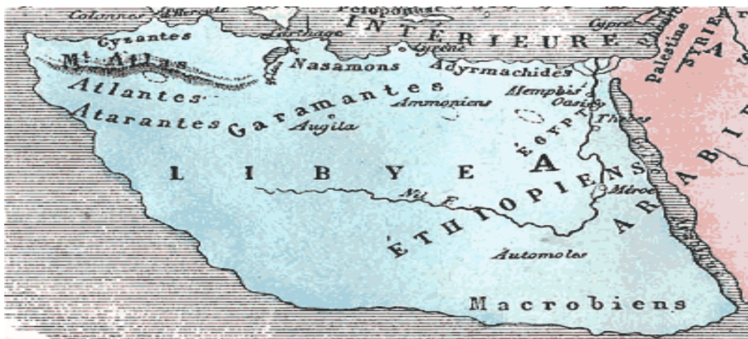
Figure 1 : Le continent libyen vu par Hérodote 1

Selon cette citation, la Libye est donc un terme qui, autrefois, désignait l'ensemble de l'Afrique du Nord et parfois même, l'Afrique toute entière comme c'est illustré par la carte de la Libye indiquée ci-après.