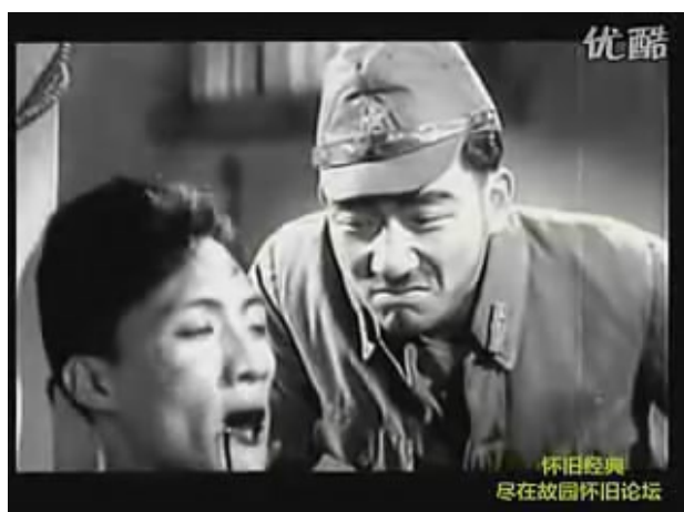
Image 25. Portrait de l'officier japonais 87