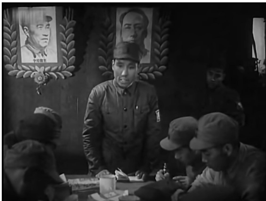
Image 16. Le chef de la Nouvelle quatrième armée assignant les tâches pour les opérations militaires 75

Dans la seconde moitié du film, La renaissance de notre terre , le portrait de Mao dégage également une force imposante qui suscite l'admiration. En apprenant qu'un petit portrait de Mao (environ 20 centimètres) a été remis par le comité local du Parti du comté aux soldats de la Nouvelle quatrième armée qui ont combattu dans des conditions difficiles, un soldat qui a subi une blessure aux yeux pendant la Guerre de résistance contre les Japonais déclare avec enthousiasme : « Un portrait du président Mao ? Je veux le voir aussi ! ». À ce moment-là, la scène se réduit à un plan rapproché du soldat aveugle qui tend les mains avec précipitation vers les autres soldats présents. L'infirmière qui tient le portrait des deux mains lui dit : « Comment pourrais-tu le regarder ? Attends que tes yeux soient guéris ! ». Le soldat dit alors avec empressement : « Je veux le voir aussi, je peux le voir, donne-le-moi, donne-le-moi ! ». Elle