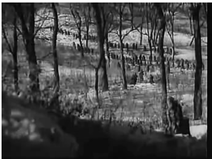
Image 20. Une troupe de l'armée japonaise sur la plaine de Huabei 82