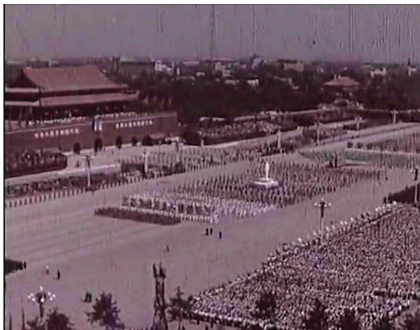
Image 32. Défilé militaire transportant une statue de Mao Zedong sur la place Tiananmen devant les dirigeants du pays 156

Ce montage véhicule un message clair : bien que Nie Er soit mort, sa musique donne du courage au peuple chinois pour poursuivre la résistance contre l'agression japonaise et continuera de l'encourager pour poursuivre la révolution. Grâce à la technique cinématographique du montage, divers plans peuvent être superposés à l'infini et de manière flexible, et offrir ainsi des possibilités de significations infinies. Le montage d'images, qui dure