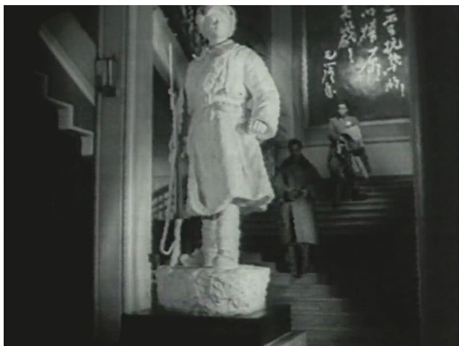
Image 14. Propos de Mao Zedong apparaissant dans le hall du Mémorial des martyrs à Harbin 71

Dans cette scène, la caméra est fixe. Ici, le réalisateur Ling Zifeng utilise un cadrage en profondeur du hall du Mémorial des martyrs de la révolution qui abrite la statue d'un combattant de l'Armée unie antijaponaise du Nord-Est, laquelle apparaît au premier plan. Les inscriptions qui mentionnent les propos de Mao occupent l'ensemble du mur, juste au-dessus de l'escalier. Ces inscriptions figurent sur une immense toile placée au-dessus de la statue, créant une présence encore plus massive dans l'espace. Sur cette image fixe, seules les deux personnes descendant les escaliers sont en mouvement, de sorte que ce cadrage donne à l'image un effet visuel solennel.