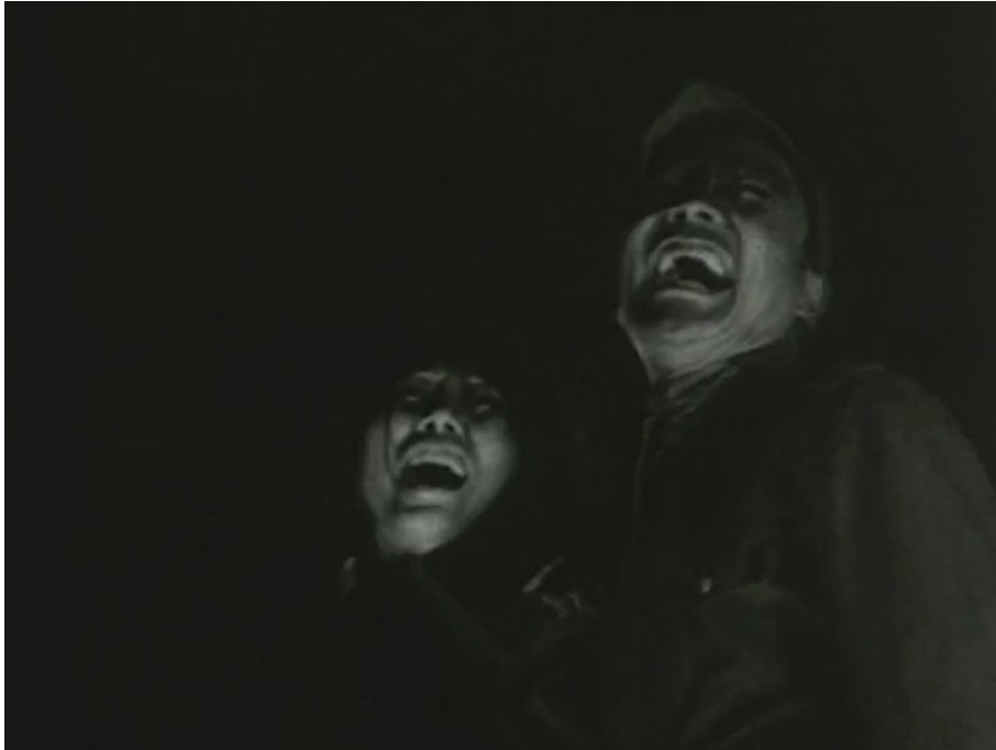
Image 28. Les éclats de rire de deux soldats japonais 92