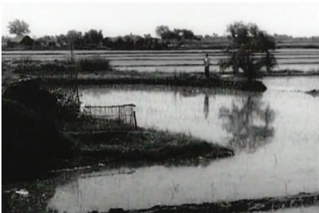
Image 34. Ermeizi regardant s'éloigner la Nouvelle Quatrième armée 158

La réalisatrice explique ce qu'elle veut décrire dans la scène du départ de la Nouvelle Quatrième armée :