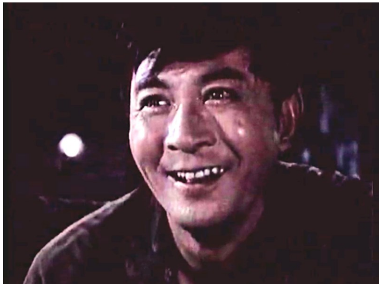
Image 30. Expression du visage de Nie Er apprenant l'acceptation de sa demande d'adhésion au Parti 154

Suite à ce plan rapproché vient un gros plan sur quatre mains vigoureusement serrées, suivi par un autre plan rapproché où deux mains jouent du piano. Au même moment, commence le prélude de La chanson de fin d'études . Zhen Junli explique ce qu'il veut montrer dans cette scène :