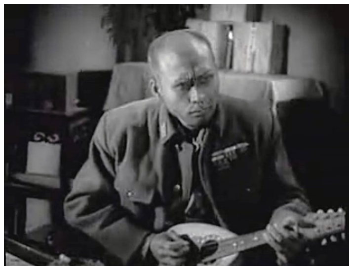
Image 37. L'officier japonais Matsui jouant du shamisen