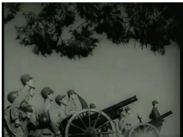
Image 22. Le repliement de la milice communiste du village 84