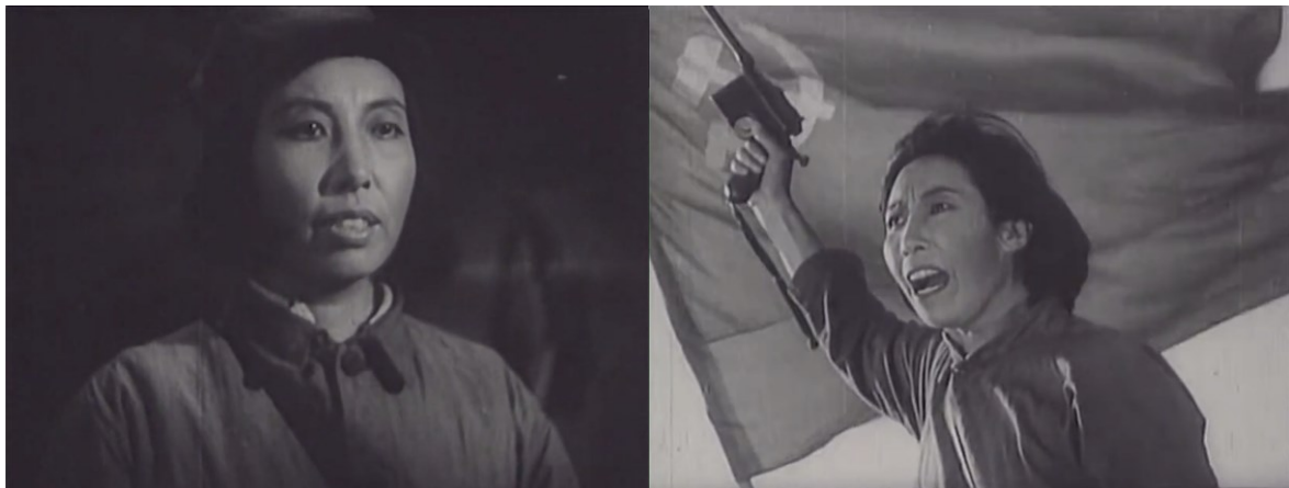
Image 9. Zhao Yiman conduisant les troupes au combat contre l'armée japonaise 64

À partir du moment où Mao Zedong publie son célèbre article « Du gouvernement de coalition » en 1945, son paragraphe de conclusion sera largement cité par les médias durant l'ère maoïste : « Des milliers et des milliers de martyrs ont donné héroïquement leur vie pour le peuple. Levons haut leur drapeau, avançons sur la voie que leur sang nous a tracée ! » (Mao, 1945). À travers les personnages emblématiques des films sur la Seconde Guerre sino-japonaise, l'esprit combatif mis en avant par Mao Zedong est incarné de manière vivante, de sorte que le discours de Mao Zedong est plus facilement compréhensible pour le peuple chinois et aussi plus convaincant. Si les rôles féminins principaux de ces deux films peuvent mieux supporter