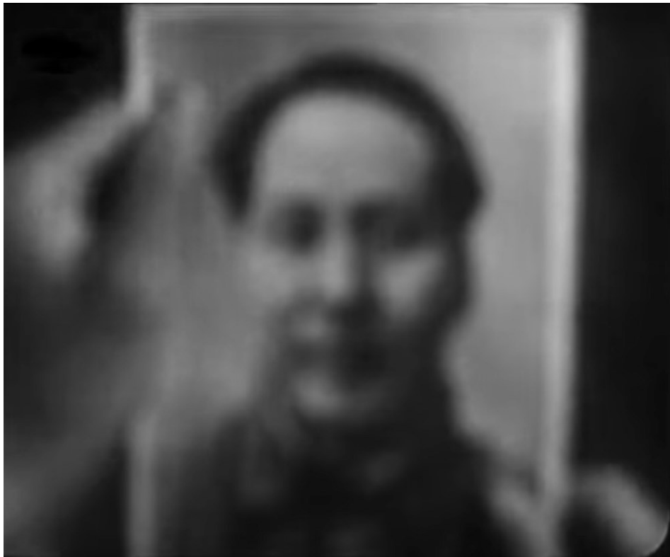
Images 17 et 18 - Le portrait du président Mao passant du flou à la netteté 78 .