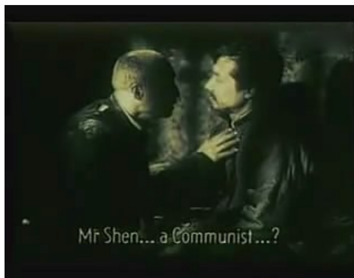
Image 5. Shen Yuan se présentant au policier sous son identité communiste 56