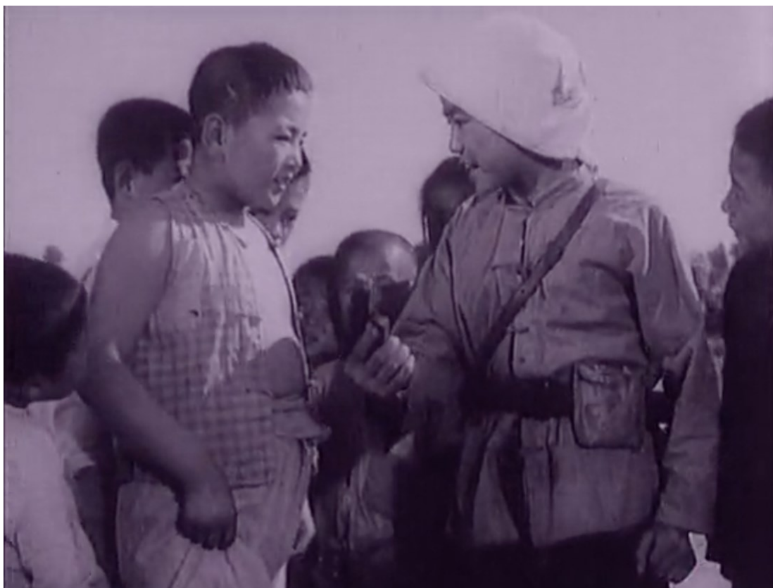
Image 29. Zhang Ga offrant le pistolet en bois à son ami 142