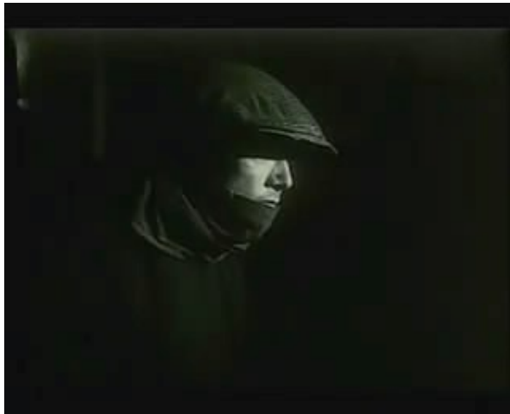
Image 4. Shen Yuan se cachant dans un coin 55

Enfin, Shen Yuan est arrêté par le gouvernement du Guomindang. Avant son exécution, il s'entretient avec le policier. Pour la première fois, il se présente sous sa véritable identité – membre du PCC – et explique sa motivation en tant que martyr de la révolution : construire une nouvelle société pour le peuple. Ainsi la création du personnage de Shen Yuan représente-t-elle un élément révolutionnaire, entraînant de fait une déviation du ton de la nouvelle société. De ce point de vue, le film Ma vie témoigne de la période de transition entre l'esthétique cinématographique avant 1949 et celle du début des années 1950.