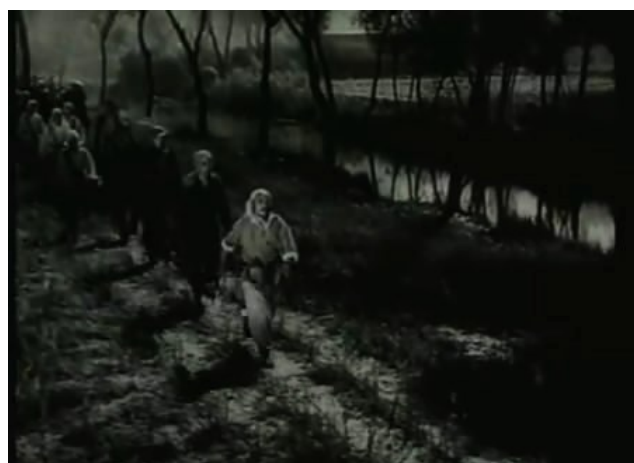
Image 23. La fuite des paysans du village vers la plaine de Huabei 85