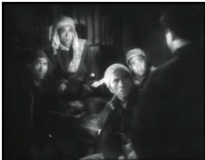
Image 1. Lao Ma encourageant l'esprit de résistance des miliciens 51

Dans le film Nouveaux héros et héroïnes , le responsable du PCC du district Baiyangdian 52 , Hei Laocai, prend en charge de diriger les paysans, surtout les deux personnages principaux, Nui Dashui et Yang Xiaomei, et devient leur tuteur spirituel. Il propose à ces jeunes de travailler pour le Parti et les envoie dans l'armée communiste pour leur formation militaire et politique. Avec l'aide de Hei Laocai, ils réussissent à transformer des paysans persécutés en combattants antijaponais courageux et intelligents.