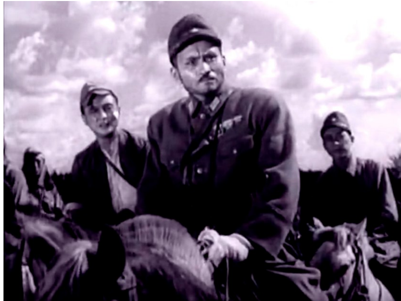
Image 36. L'officier japonais Matsui sur son cheval en train de diriger ses troupes 163

Pour la première apparition de Matsui, les réalisateurs ont conçu la scène suivante :