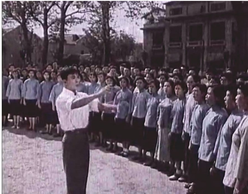
Image 31. Nie Er dirigeant le chœur d'étudiants chantant La chanson de fin d'études 155 .

Dans cette scène, le réalisateur utilise les mains de Nie Er comme intermédiaire : un plan montre ses deux mains serrant celles de Su Ping, membre du Parti, qui est son maître spirituel, suivi par un second plan où les mains de Nie Er jouent du piano. Les mains nouent habilement un lien entre le rôle de guide du Parti et l'engagement de Nie Er dans le combat, comme si le soutien du Parti donne à Nie Er le courage et l'inspiration pour composer des mélodies antijaponaises. Dans cette scène de La chanson de fin d'études , le réalisateur recourt à un procédé narratif mêlant réalité et fiction. En réalité, cette chanson est une des musiques du film antijaponais Destin de lauréats . Le réalisateur incorpore donc quelques images du tournage de ce film, comme sa projection au cinéma et la sortie de jeunes du cinéma. Dans le film, par contre, le réalisateur montre Nie Er qui dirige un chœur d'étudiants chantant La chanson de fin d'études (voir image 31).