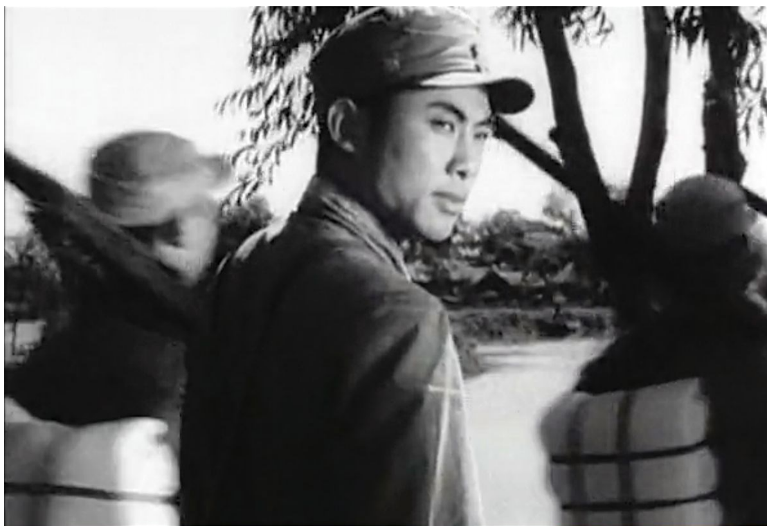
Image 33. L'instructeur tournant la tête et cherchant Ermeizi du regard 157

Dans le film, lorsque la Nouvelle Quatrième armée, saluée par les villageois, quitte le village de Liubao pour la première fois, l'instructeur cherche à distinguer Ermeizi dans la foule, mais en vain. Il demande alors à son frère cadet, Xiaoniu : « Où est passée ta grande sœur ? ». Xiaoniu secoue la tête : « Aucune idée ». Puis Xiaoniu rejoint Li Jin et l'appelle tendrement : « Brigadier adjoint ». Li Jin lui caresse la tête et se met en marche sans avoir prononcé un mot. À cet instant, l'instructeur se livre en voix-off à un monologue : « Nous quittons Liubao d'un pas plutôt rapide. J'aperçois Li Jin et songe qu'il va certainement jeter un regard derrière lui. Mais il ne le fait pas, et pourtant je ne peux moi-même m'empêcher de me retourner et de regarder au loin... » (ibidem) (voir image 33). À ce moment-là, la réalisatrice filme, en plan rapproché, le profil de l'instructeur qui regarde derrière lui. En arrière-plan, les troupes en marche symbolisent la discipline de l'armée communiste : les soldats n'ont pas droit aux relations amoureuses. L'instructeur tourne la tête, le regard fixe, signifiant ainsi qu'il comprend les sentiments amoureux liants Li Jin et Ermeizi et qu'il compatit avec la peine de leur séparation. C'est une façon de dévoiler sa part d'humanité.