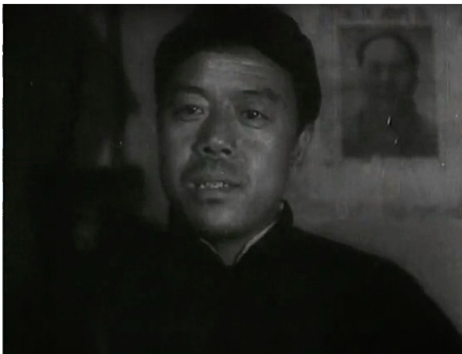
Image 15. Le secrétaire du comité du Parti et chef de brigade Lao Ma encourageant les milices à persévérer dans la résistance contre les Japonais 73

Par ailleurs, au début du film La renaissance de notre terre , un portrait – très net – de Mao est accroché dans la salle de réunion de la Nouvelle quatrième armée (voir image 16).