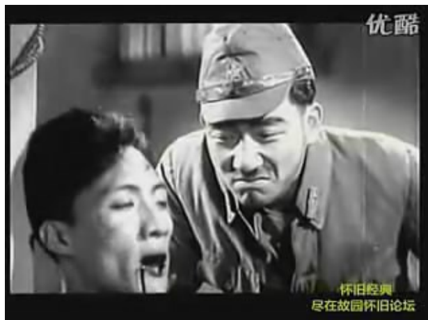
Image 25. Portrait de l'officier japonais 87