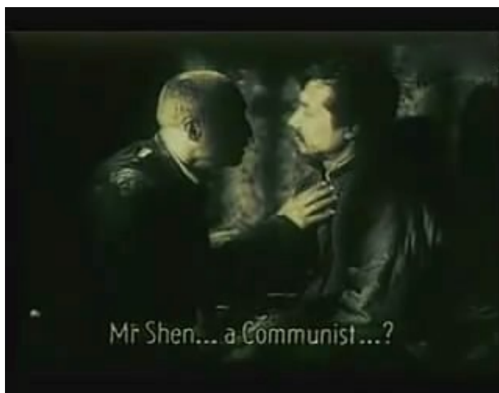
Image 5. Shen Yuan se présentant au policier sous son identité communiste 56