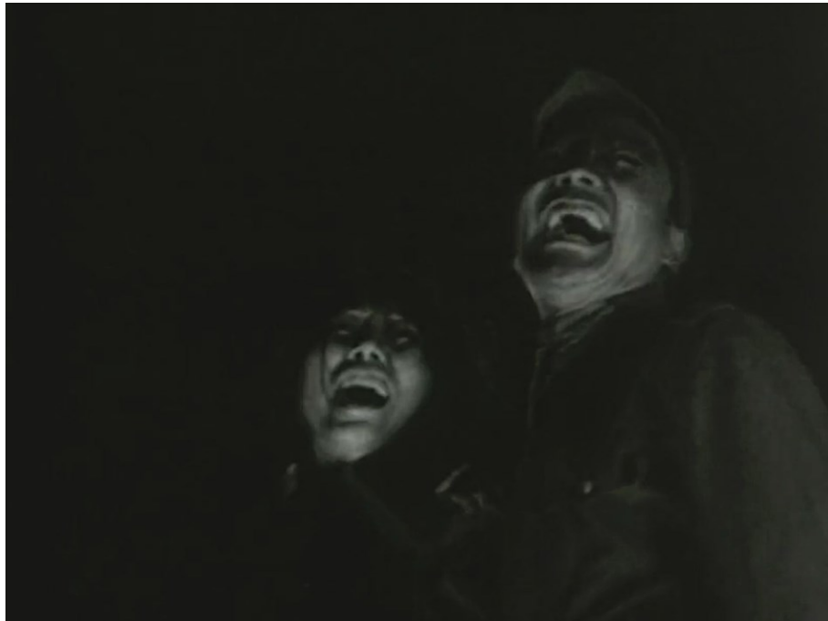
Image 28. Les éclats de rire de deux soldats japonais 92