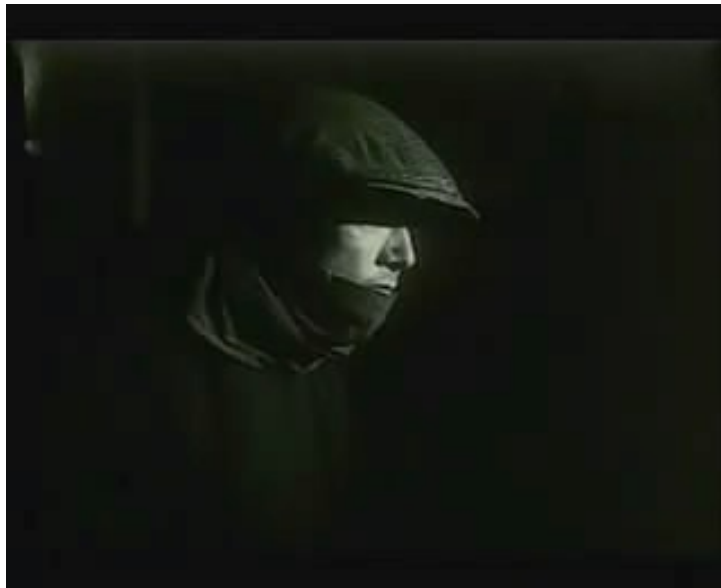
Image 4. Shen Yuan se cachant dans un coin 55

Enfin, Shen Yuan est arrêté par le gouvernement du Guomindang. Avant son exécution, il s'entretient avec le policier. Pour la première fois, il se présente sous sa véritable identité – membre du PCC – et explique sa motivation en tant que martyr de la révolution : construire une nouvelle société pour le peuple. Ainsi la création du personnage de Shen Yuan représente-t-elle un élément révolutionnaire, entraînant de fait une déviation du ton de la nouvelle société. De ce point de vue, le film Ma vie témoigne de la période de transition entre l'esthétique cinématographique avant 1949 et celle du début des années 1950.