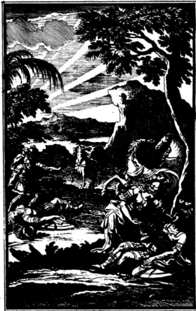
Ann. 26 - Saint Louis , livre XI : combat d'Alzir et Méléodor contre Almasonte et Zahide. Mort d'Almasonte et de Méléodor (F. Chauveau).