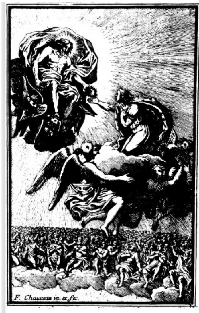
Ann. 24 - Saint Louis , livre VIII : Saint Louis choisit, entre toutes les couronnes que lui propose le Christ, la Couronne d'épines (F. Chauveau).