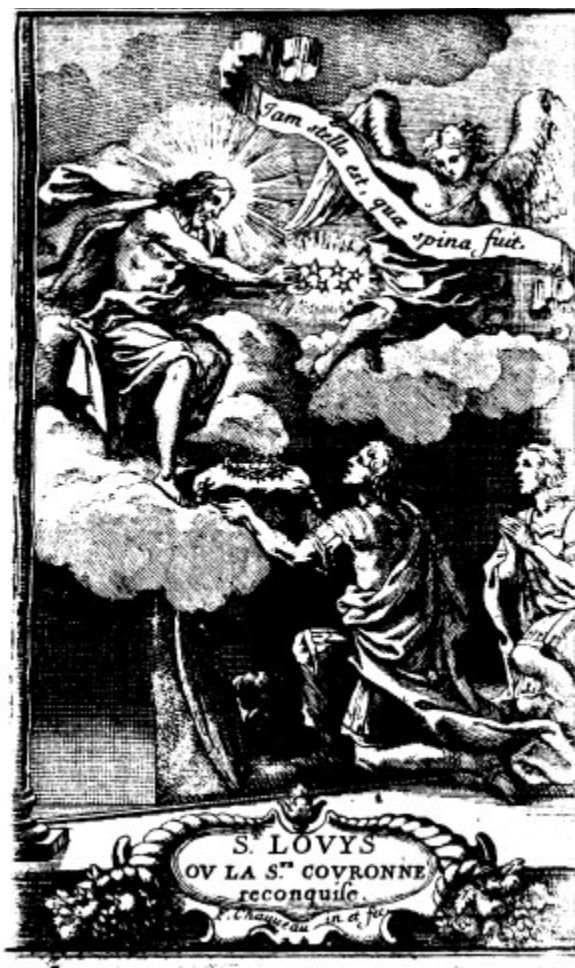
Ann. 3 - Frontispice de Saint Louis : Saint Louis présente la Couronne d'épines au Christ (François Chauveau).