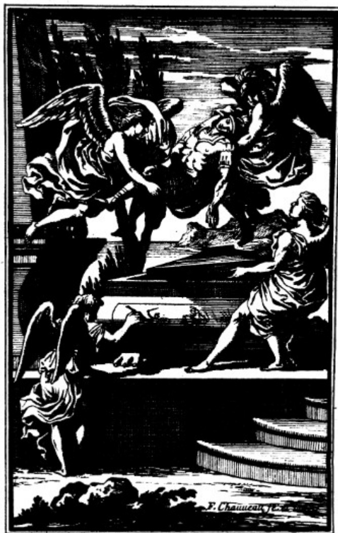
Ann. 28 - Saint Louis , livre XIV : les anges déposent la dépouille de Robert d'Artois sur le tombeau des Maccabées (F. Chauveau).