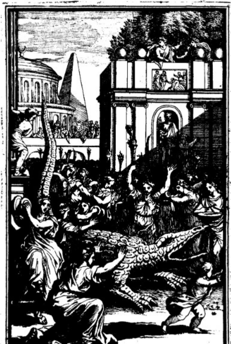
Ann. 21 - Saint Louis , livre III : Alcinde tue le crocodile monstrueux idolâtré par les habitants de Damiette (F. Chauveau).