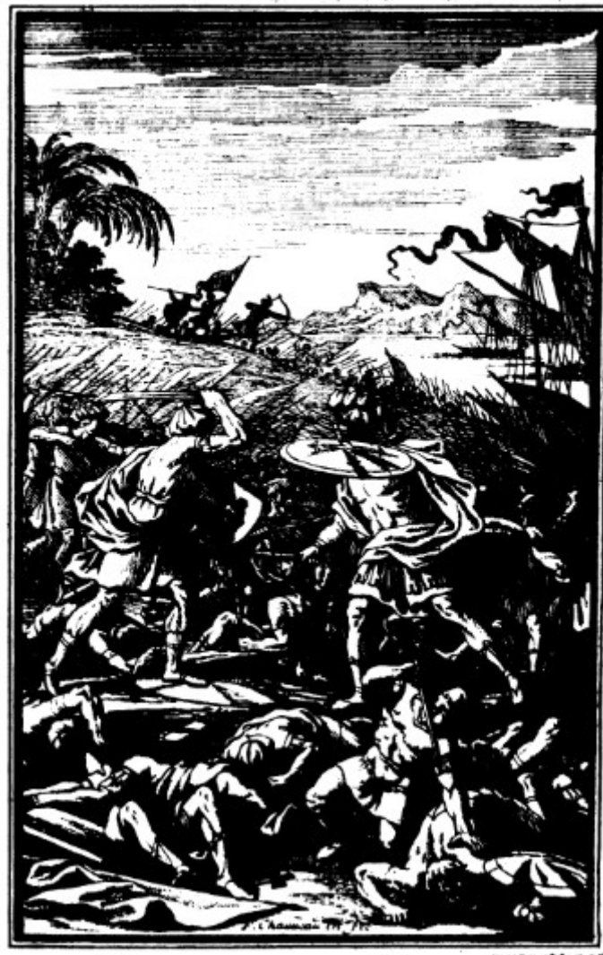
Ann. 23 - Saint Louis , livre VII : les croisés, encerclés sur le mont Tafnis par les galères des Sarrasins, leur livrent bataille. Louis affronte Olgan (F. Chauveau).