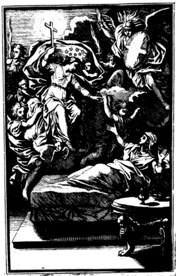
Ann. 29 - Saint Louis , livre XVII : apparition à Zahide, guérie par l'eau de la fontaine Matarée, de la Vierge escortée d'anges et de son ange gardien (F. Chauveau).