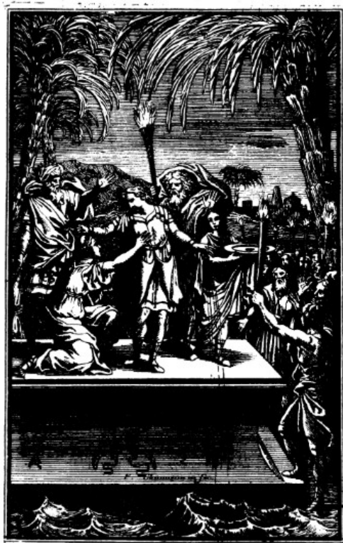
Ann. 22 - Saint Louis , livre VI : Muratan interrompt le sacrifice de Zahide voulu par Mélédin et Mirème (F. Chauveau).