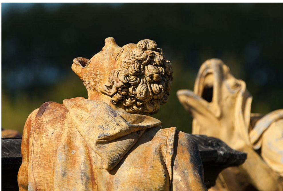
Fig. 5, Gaspard et Balthazar Marsy, fontaine de Latone (détail), 1667, photographie de Thomas Garnier, La métamorphose des paysans .

Quant aux mutants, loin de présenter un caractère monstrueux, fruit de la seule imagination « gothique » des Flamands Marsy, ils témoignent au contraire de la seule volonté de s’en tenir au naturel, têtes et membres des batraciens venant prendre place et s’ajustant au mieux aux corps vêtus des humains, comme pour rendre plausible la mutation : sous nos yeux, la métamorphose devient crédible. Loin d’être saisis d’un sentiment d’effroi vis à vis des monstres, les contemporains appréciaient la vérité des animaux aquatiques et l’expression pitoyable des figures changeantes. (Sabatier 1999 : 80)