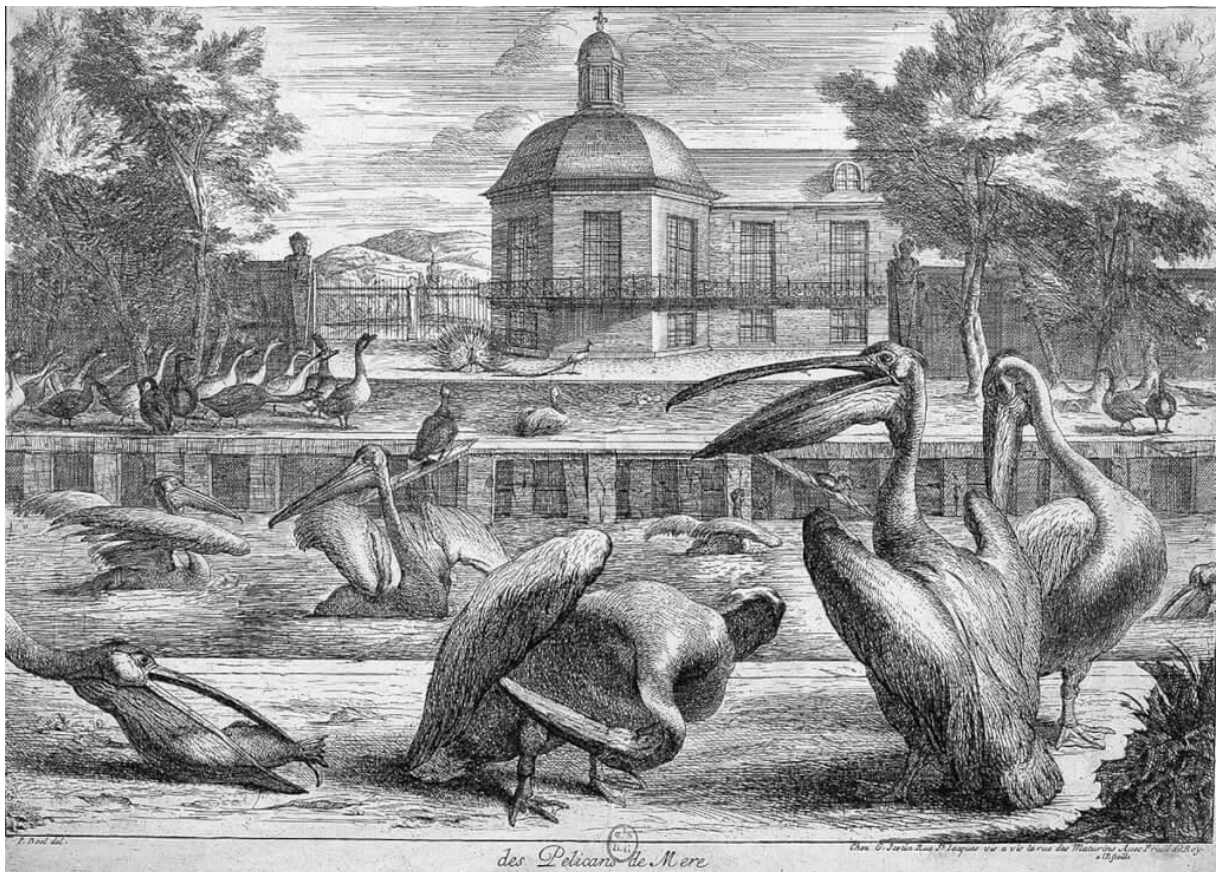
Fig. 1, Pieter Boel et Gérard Scotin, Vue latérale de la Ménagerie de Versailles , gravure, vers 1670, BNF.

Les basses-cours se vident progressivement de leurs bêtes, réinstallées dans les cours latérales, et les ménageries royales permettent de garder les animaux à distance des demeures. L'exclusion des animaux hors du cercle domestique et leur représentation idéalisée dans une nature édenique semblent ainsi témoigner de concert du désir d'apaisement et de civilité du lectorat. Les animaux pacifiés inspirent l'image d'une société qui se civilise, qui réprime et réfrène son animalité dissimulée derrière cette vision idéalisée de la nature. La ménagerie de Versailles devient ainsi un « théâtre de civilité ». Au cœur du dispositif panoptique, le pavillon central, représenté sur plusieurs gravures de Pieter Boel et Gérard Scotin, permet d'observer les animaux de toutes les cours latérales.