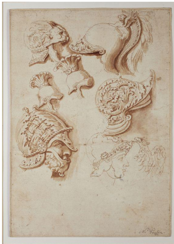
Fig. 4, Nicolas Poussin, Études de casques antiques , vers 1650, musée des Beaux-Arts de Nancy

Madeleine de Scudéry utilise deux comparaisons, l'une pour faire voir et faire valoir poétiquement, la couleur de la langue, l'autre pour donner à voir sa forme particulière : elle « était incarnate comme une feuille de rose, et pour la forme, elle était comme une petite trompe d'Éléphant » (Scudéry [1688] 2022 : 69). La comparaison peut se faire avec des inanimés, comme ici le bas de soie, les épingles, les lames, ou indifféremment avec un vivant ou partie de vivant, comme la feuille de rose ou la trompe de l'éléphant, la seule nécessité étant que le comparant doit être un référent connu, qui permette d'améliorer la connaissance du comparé. Madeleine de Scudéry, à cette fin, propose deux comparaisons très différentes pour donner à voir la tête du caméléon : « Sa tête ressemble assez à celle d'un poisson qu'on appelle Rouget en Normandie, et Gournaut en Provence ; elle a même quelque chose d'un casque à l'antique » (Scudéry [1688] 2022 : 69).