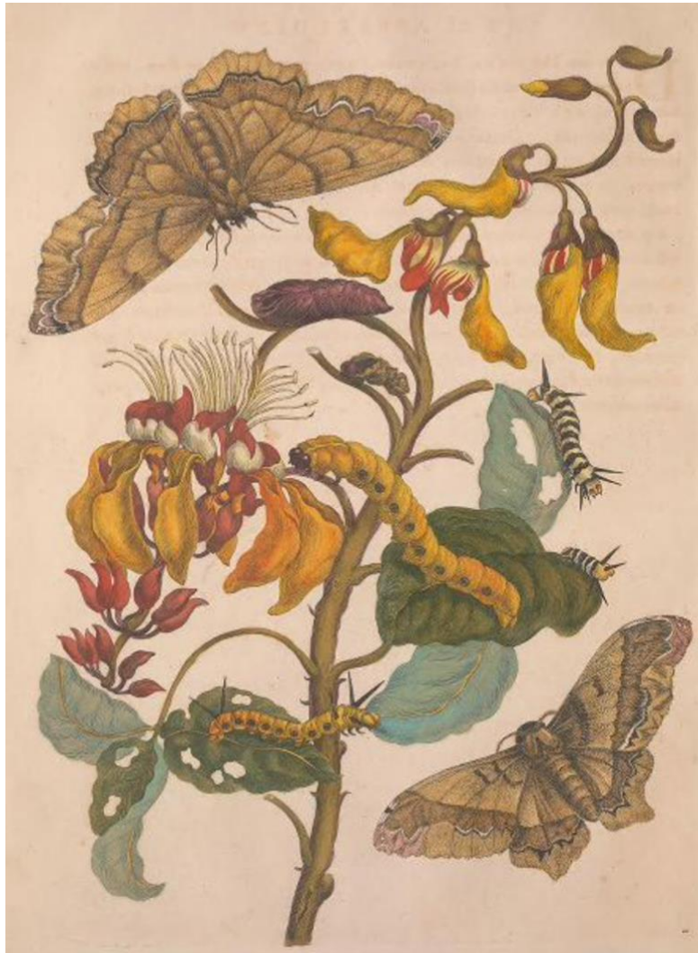
Fig. 9, Maria Sibylla Merian, planche 11 des Metamorphosis Insectorum Surinamensium , aquarelle, 1699.

Fénelon consacre le reste du chapitre à passer en revue quelques caractéristiques comparées des oiseaux et des poissons, puis des fauves et des oiseaux de proie, qui montrent l'unité et l'ordre de la nature malgré sa diversité. Il consacre un chapitre particulier aux insectes intitulé « Merveilles des infiniment petits » : « l'ouvrage n'est pas moins admirable en petit, qu'en grand. Je ne trouve pas moins en petit, une espèce d'infini, qui m'étonne, et qui me surmonte » (Fénelon 1713 : 71).