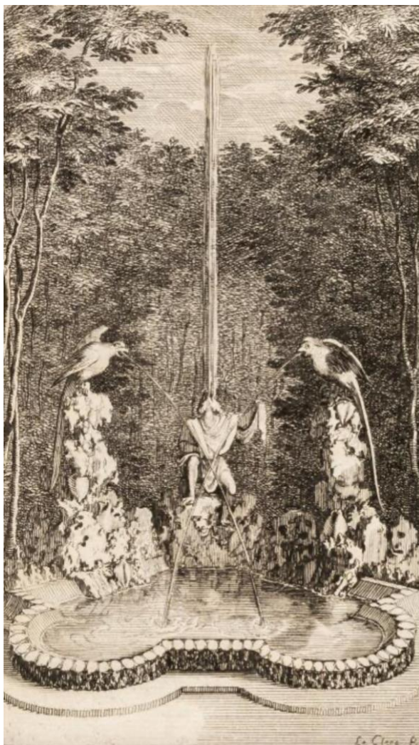
Fig. 7, Sébastien Leclerc, Le Perroquet et le Singe , gravure publiée dans Charles Perrault, Labyrinthe de Versailles , 1677, p. 35.