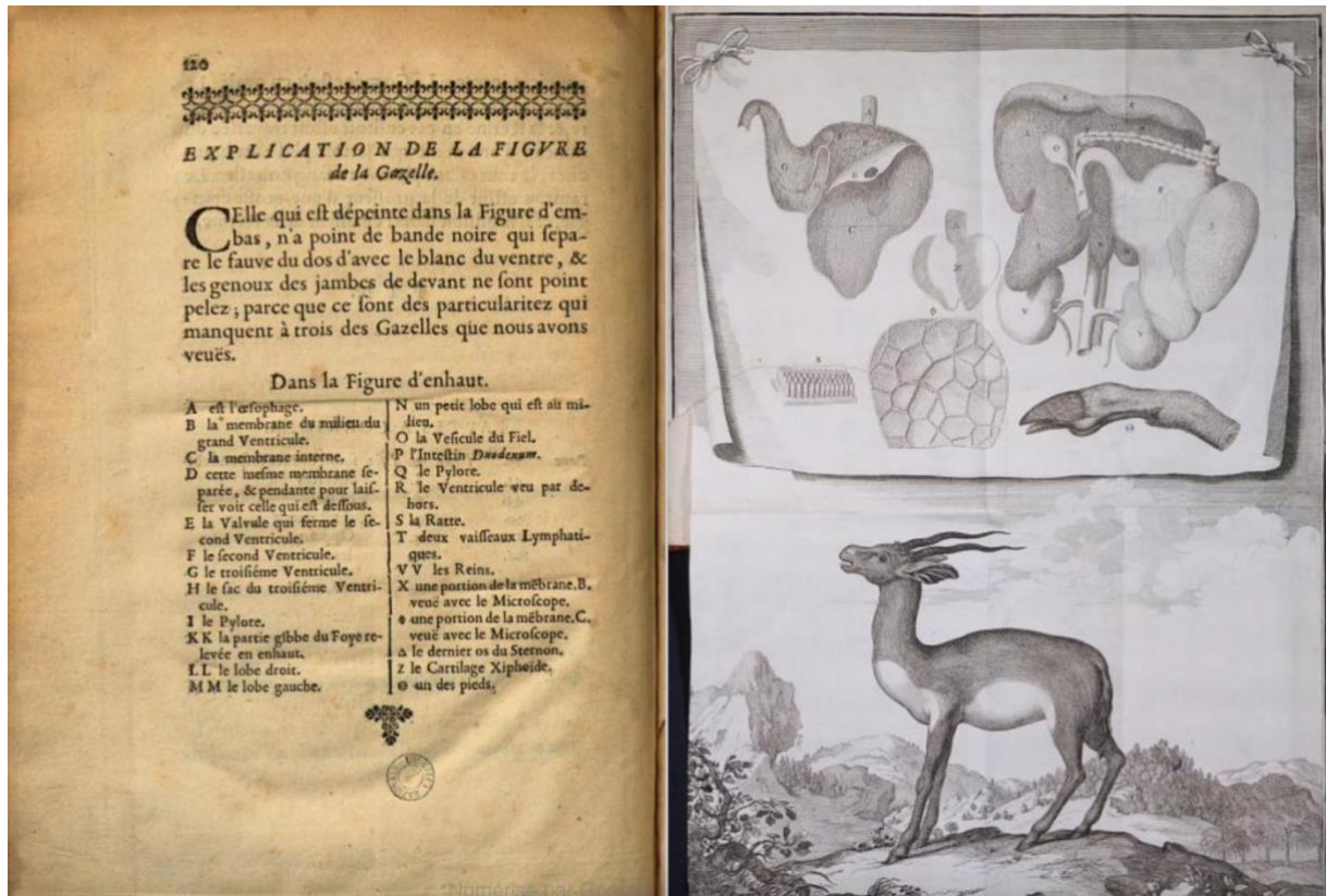
Fig. 3, Abraham Bosse, planche pour la description anatomique de la gazelle, gravure, et Claude Perrault, explication de la figure de la Gazelle, 1669, pages 120-121 de la Description anatomique .

À propos de sa propre « Histoire de deux caméléons », inspirée des récits savants, Madeleine de Scudéry fera conclure à l'un de ses personnages : « Vous aviez grand tort, dit Méliton à Bérénice, après qu'elle eut achevé de lire, de craindre que la compagnie ne s'ennuyât, car ce récit est fort curieux et fort bien écrit » (Scudéry [1688] 2020 : 80). Ce texte constitue en effet, selon Nathalie Grande, « un exemple de l'intérêt mondain pour les sciences, en attendant les salons plus spécialisés du siècle des Lumières auxquels le salon scudérien semble avoir montré la voie » (dans Mazouer dir. 2003 : 102). Comme le montre Philippe Chométy, les sciences naturelles contribuent à suggérer aux Belles-Lettres plusieurs manières de renouveler les moyens de plaire en dispensant, conformément au goût classique, de « sçavantes et utiles leçons » (2013 : 252-253 ; 397). Œuvres littéraires comme œuvres savantes peuvent mobiliser des procédés rhétoriques ou stylistiques communs, comme le rappelle Jean-Luc Robin à propos de l'Arrêt Burlesque :